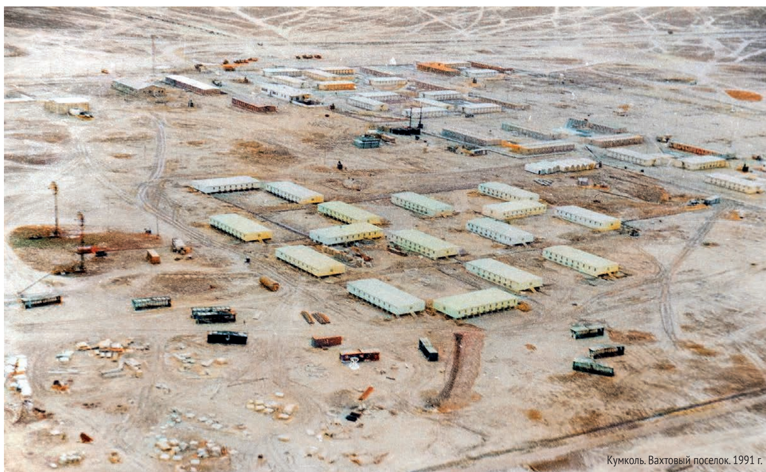
Кумколь. Вахтовый поселок. 1991 г.

значительно ускорило обустройство месторождения.