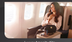
Luxury Amenity Kits