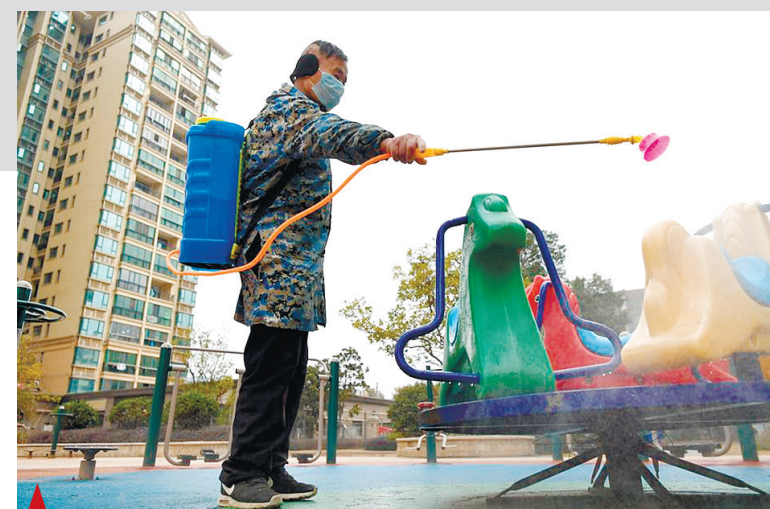
▲ Сотрудник проводит дезинфекцию объектов общественного пользования в общине округа Наньчан города Наньчан, провинция Цзянси на востоке Китая, 28 января 2020 года.