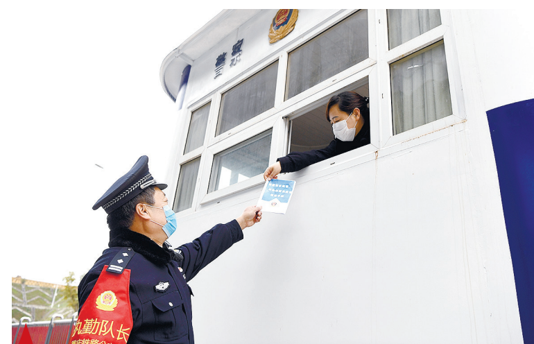
▲ Полицейский передает информацию о борьбе с эпидемией своему коллеге в Чунцине на юго-западе Китая, 4 февраля 2020 года.