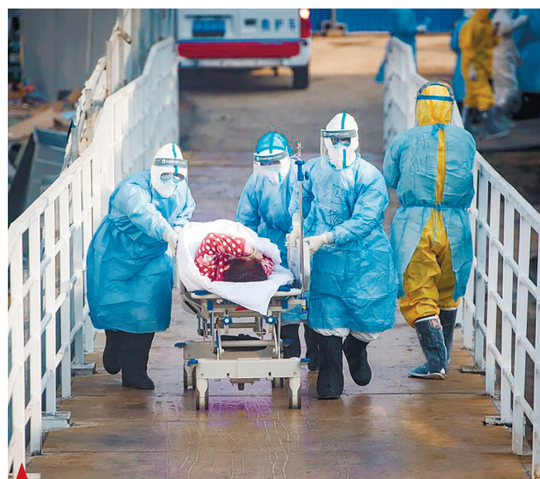
▲ Медицинские работники помогают первой группе пациентов, зараженных новым коронавирусом, попасть в их изоляторы в больнице Хуошэньшань (гора бога огня) в Ухане, провинция Хубэй, Центральный Китай, 4 февраля 2020 г.