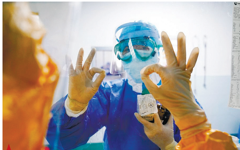
▲ Медицинские работники жестикуют друг другу через окно в городской больнице Чжанчжоу, провинция Фуцзянь на юго-востоке Китая, 2 февраля 2020 года.