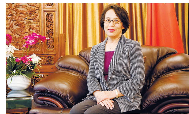
Гэн ЛИПИН, Генеральный консул КНР в Алматы