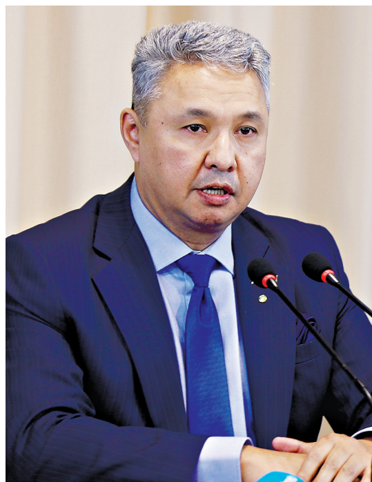
Азат ПЕРУАШЕВ

Выступление президента Касым-Жомарта Токаева на январском заседании правительства явно выходит за обычные рамки и по охвату тем, и по тональности. Чего стоит одна эта фраза: «Нам нужен новый экономический курс... Реформы придется проводить буквально «через колено»».