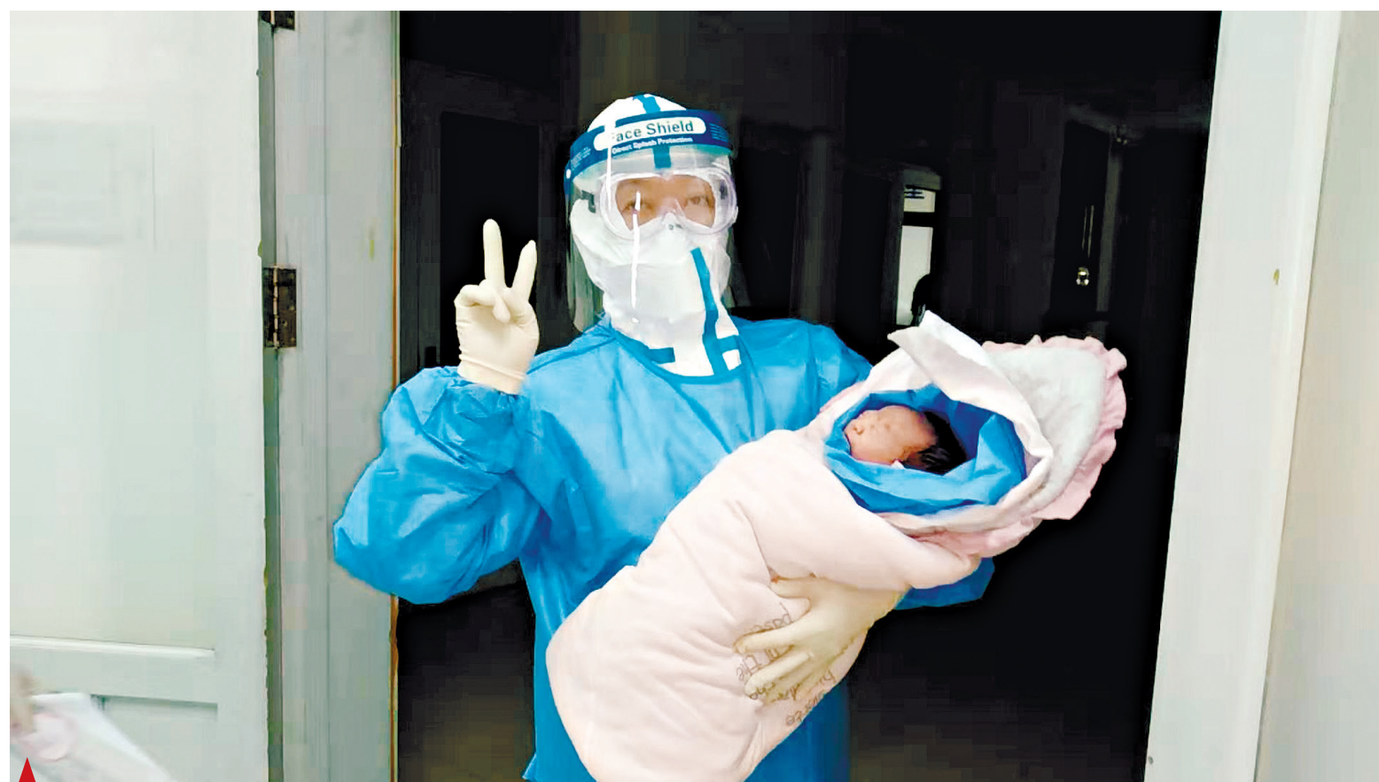
▲ Медицинский работник держит новорожденного в больнице №6 города Харбина в провинции Хэйлунцзян на северо-востоке Китая (Синьхуа)