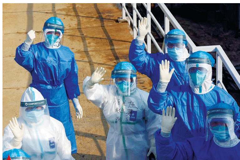
▲ Медицинский персонал фотографируется в больнице Хуошэньшань (гора бога огня) в Ухане, провинция Хубэй, Центральный Китай, 4 февраля 2020 года.