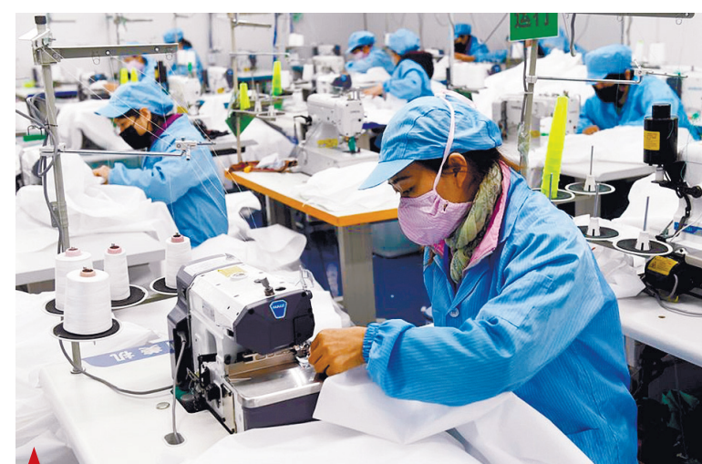
▲ Рабочие делают защитные костюмы в мастерской компании в Наньчине, южно-китайском автономном районе Гуанси-Чжуанский, 3 февраля 2020 года.

加油中国，加油武汉！ Jiayou Zhongguo, Jiayou Wuhan! Держись, Китай! Держись, Ухань!