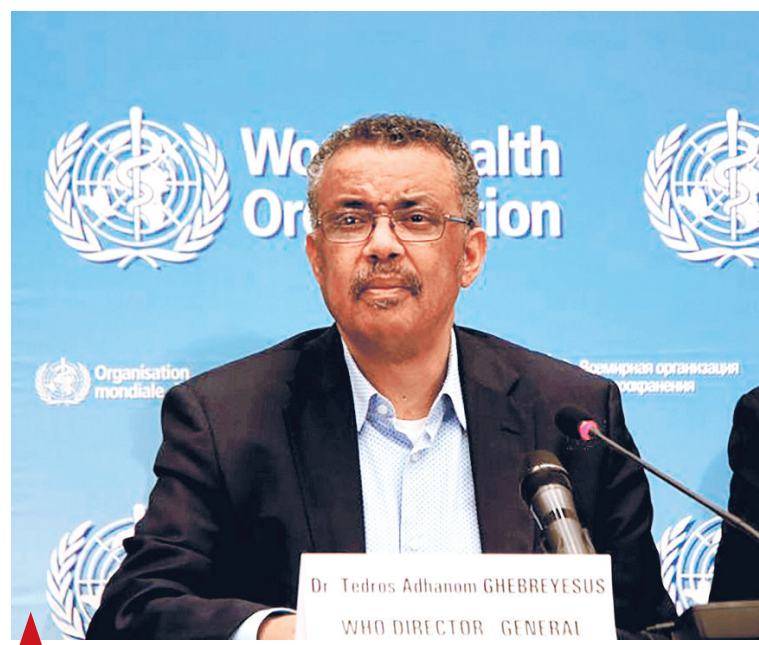
▲ Генеральный директор Всемирной организации здравоохранения (ВОЗ) Тедрос Адханом Гебреус выступал на пресс-конференции после заседания Комитета по чрезвычайной ситуации в штаб-квартире ВОЗ в Женеве, Швейцария, 23 января 2020 года.