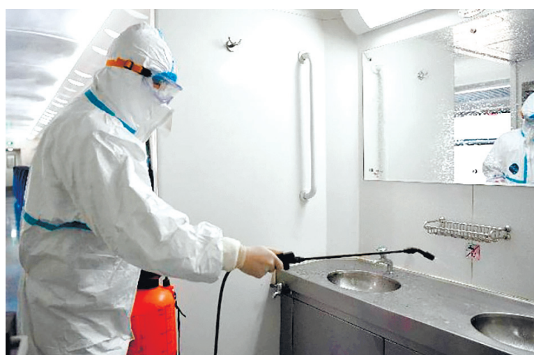
▲ Персонал дезинфицирует оборудование в поезде на железнодорожной станции Ланьчжоу в Ланьчжоу, провинция Ганьсу, северо-запад Китая, 3 февраля 2020 года.