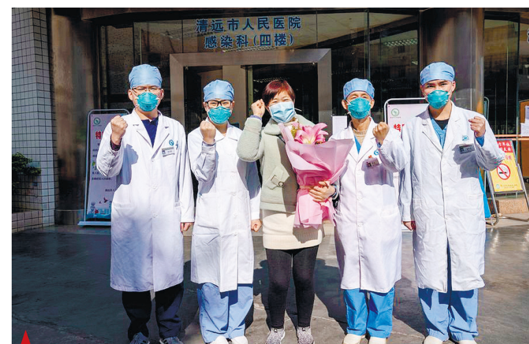
▲ Вылеченный пациент позирует для групповой фотографии с медицинским персоналом перед больницей в Циньюане, провинция Гуандун на юге Китая, 30 января 2020 года.