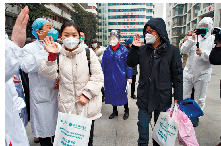
▲ Медицинские работники, у которых диагностирована новая коронавирусная (2019-nCoV) пневмония, излечиваются и выписываются из больницы в Ухане, провинция Хубэй, Центральный Китай, 28 января 2020 года. (Синьхуа / Сяо Ицзю)

加油中国，加油武汉！ Jiayou Zhongguo, Jiayou Wuhan! Держись, Китай! Держись, Ухань!