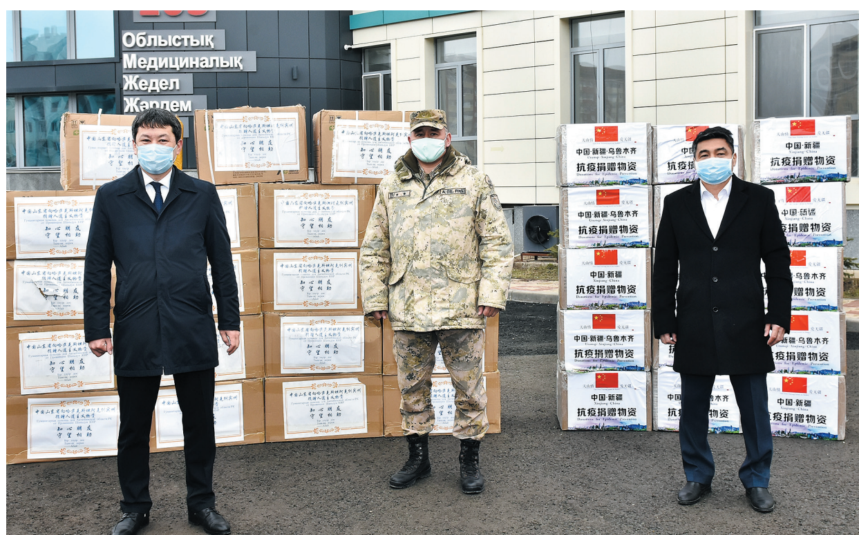
Автокараван из КНР доставил в Актобе 220 тысяч медицинских масок и 3000 защитных костюмов. Более подробно читайте на стр. 6.

Благая весть о прибытии спецборта с китайскими медиками в нашу страну в очередной раз подтвердила давнюю истину, что учиться лучше на чужом опыте, чем на своих ошибках.