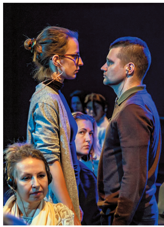
Фрагмент спектакля «Что вы делали сегодня вечером»

В значительной мере театр существовал за счет краудфандинговых проектов. Финансовая поддержка зрителей позволила театру продержаться