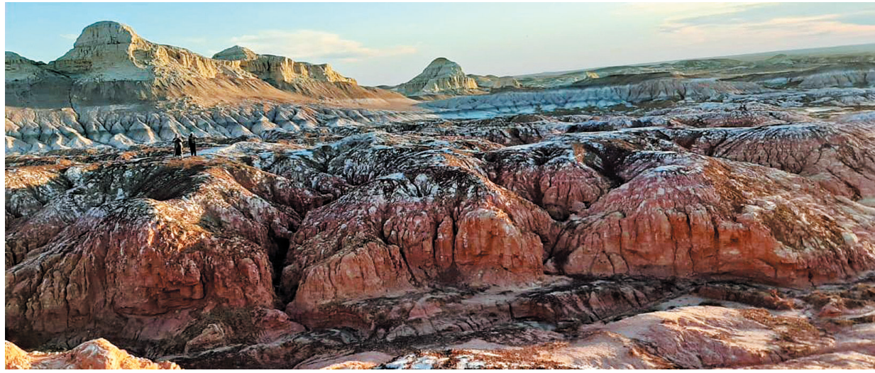
«Планета Марс» в ВКО, Киин-Кериш

В Усть-Каменогорске турдрузья пре-вратились в постоянную, довольно большую туристскую группу близких по духу людей, единомышленников из 36 человек с веселым названием «Шайка-лейка» и девизом «Нам – по пути».