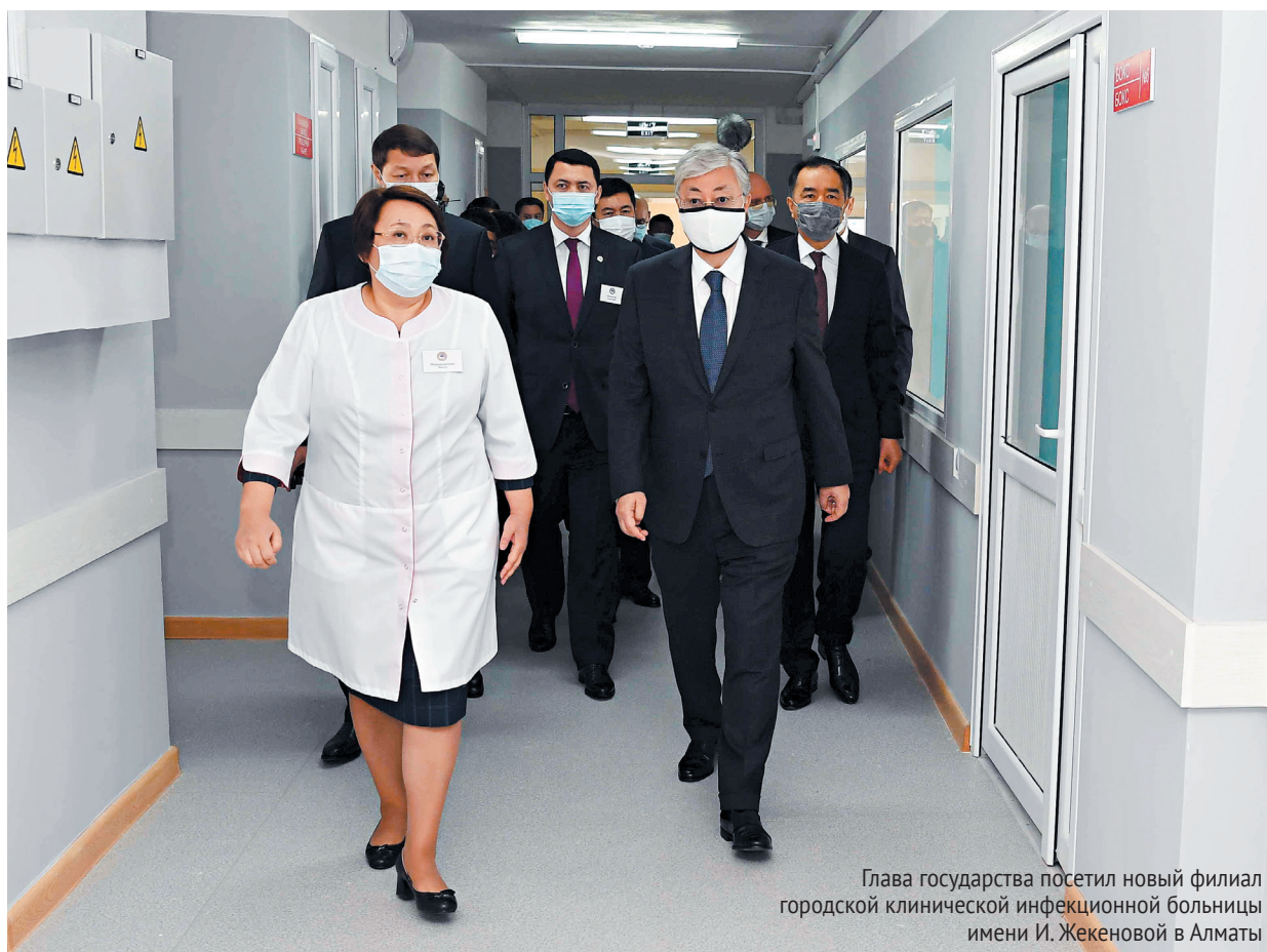
Глава государства посетил новый филиал городской клинической инфекционной больницы имени И.Жекеновой в Алматы

Увы, после завершения режима ЧП за май и июнь коронавирус перешел в наступление, в основном опять-таки из-за малоэффек-