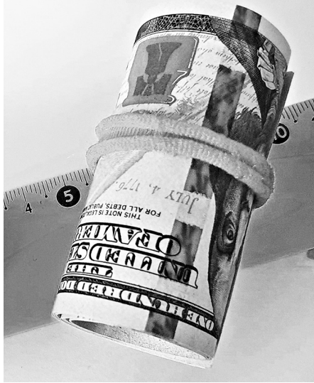
США: ФРС ИДЕТ НА РИСК

Внимание мировой экономической общественности на прошлой неделе было приковано к заседанию ФРС США, которое впервые состоялось с момента вступления в должность 46-го президента США Джо Байдена. Как и ожидалось, ФРС приняла решение оставить без изменения ключевую ставку в диапазоне 0-0,25%, что было продиктовано слабым состоянием рынка труда в США, где 9 млн человек до сих пор не могут прийти в себя от потери занятости из-за кризиса, вызванного бушующим в стране коронавирусом.