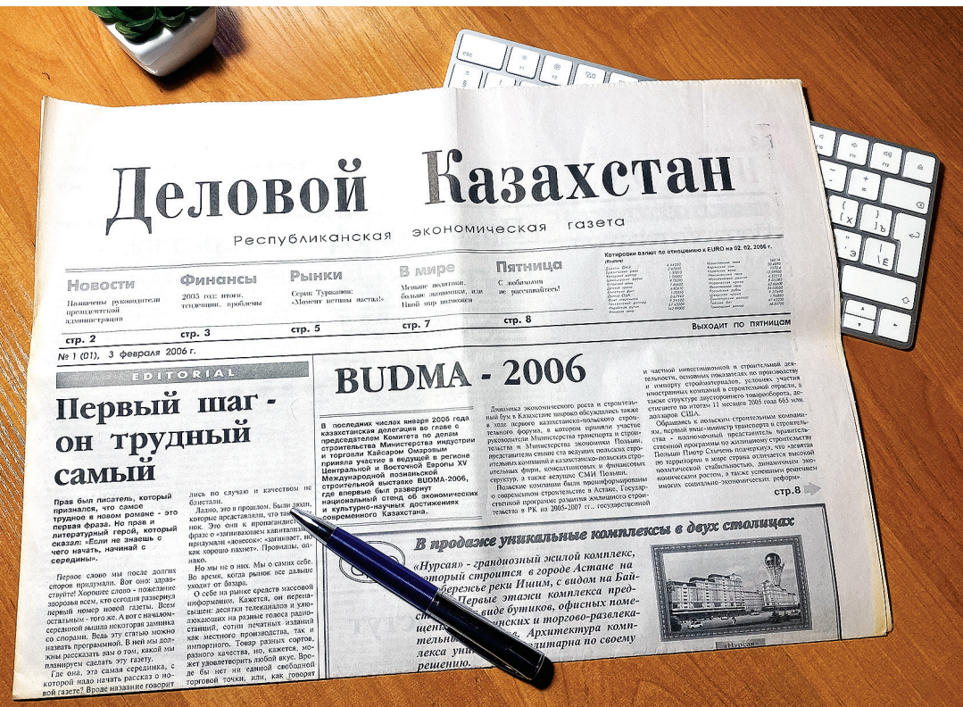
Уже история: первый номер «Делового Казахстана» за 3 февраля 2006 года

Юбилейная дата – хороший повод сказать спасибо всем тем, кто в разные годы трудился в редакции, внес вклад в создание, становление газеты и продолжает развивать ее сегодня. Мы высоко ценим труд наших авторов, которые выражают на страницах газеты мнение о происходящем в нашей стране. Сегодня коллектив газеты «Деловой Казахстан» – это профессиональная команда, сложившаяся из творческих, постоянно развивающихся, нестандартно мыслящих людей.