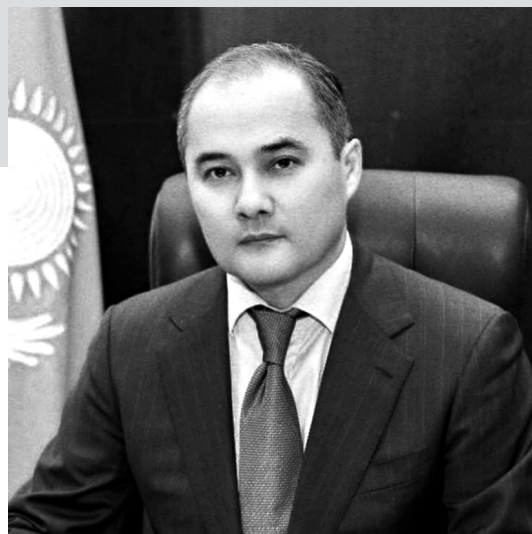
Аким Жезказгана Кайрат АБСАТПАЕВ

В текущем году планируется проведение 174 спортивных мероприятий, из них 5 республиканских и 19 областных турниров. Благодаря поддержке СК «Намыс» завершится строительство спортивной академии с общежитием на 200 человек, что откроет доступ детям из сельских местностей региона к занятиям профессиональным спортом. Мы нацелены постоянно повышать качество спортивных услуг, оказываемых населению, способствовать их всестороннему физическому развитию.