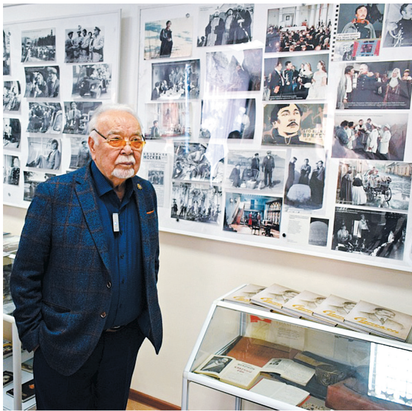
Народный артист СССР Асанали АШИМОВ

Мажит Бегалин родился в семье казахского писателя Сапаргали Бегалина. Его отец является одним из основоположников казахской