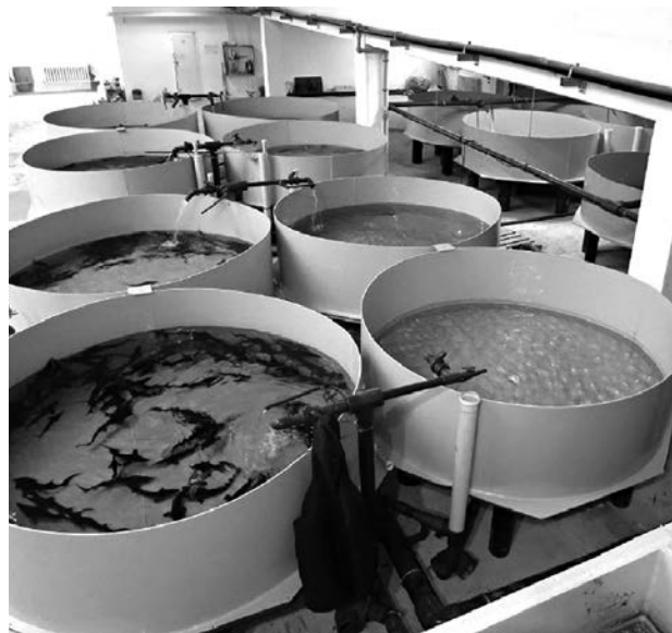
Наталья БУТЫРИНА, Актау

Сегодня мангистауские фермеры, которые занимаются рыбным хозяйством, могут получить безвозвратные субсидии в рамках госпрограммы, которой предусмотрены меры по частичному возмещению затрат предпринимателей.