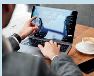
ФОТО-ОБЪЯСНЕНИЕ В ЛЮБВИ