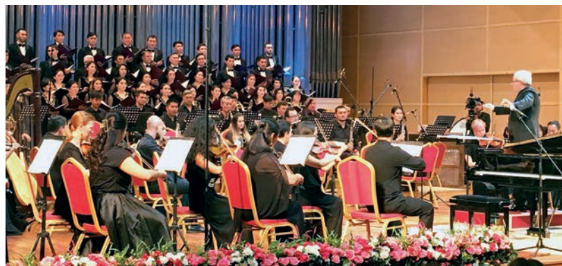
Исполняется кантата «I raggi di Dante»

тия» – «дань уважения творцам, всем тем, кто строил мироздание». Симфоническая картина для оркестра «The Sacred Universe of Particles» / «Сакральный мир частиц» написана под впечатлением посещения ЦЕРН – Европейской организации по ядерным исследованиям.