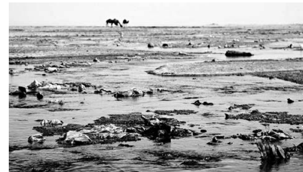
Наталья БУТЫРИНА, Актау

В настоящее время в рамках I этапа восстановления хвостохранилища Кошкар-ата продолжаются работы по рекультивации на 905 гектарах. Из республиканского бюджета на эти цели в текущем году предусмотрено 3 млрд тенге.