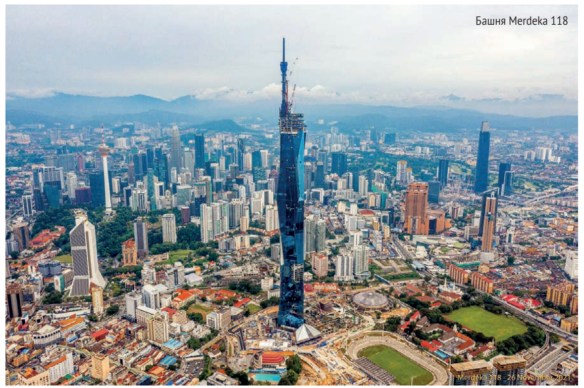
Башня Merdeka 118

Представители туристических кругов Казахстана и Малайзии единодушно считают, что расширение туристических обменов углубит взаимопонимание, укрепит дружбу между народами наших стран. По мере укрепления и развития политических и торгово-экономических связей между Малайзией и Казахстаном будет возрастать и число туристов, посещающих обе страны.