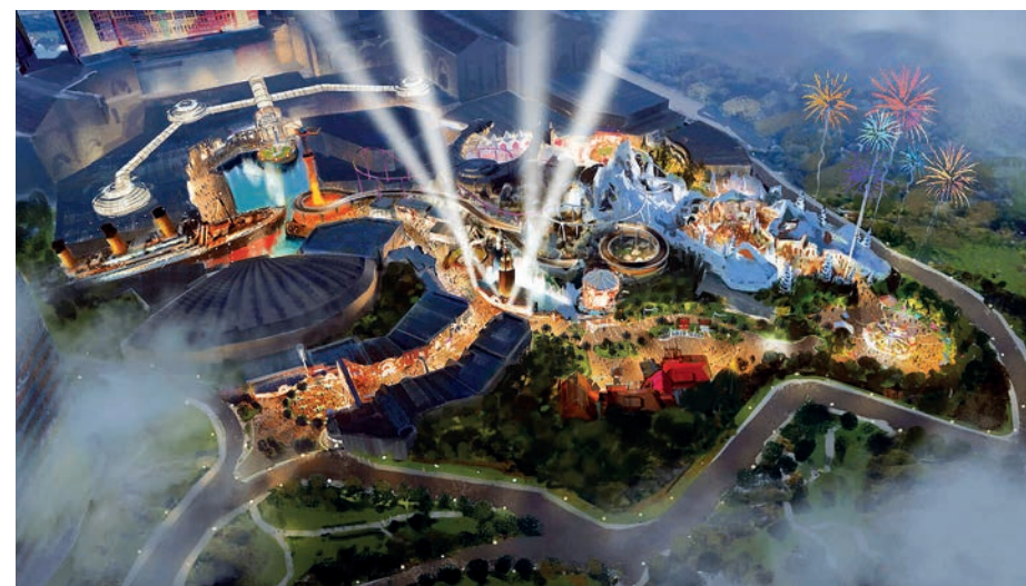
Тематический парк Genting SkyWorld