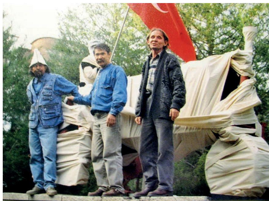
Лидеры арт-группы «Кызыл трактор»

Биеннале «Korkut» и выставка Sound OFF продлятся до 5 ноября.