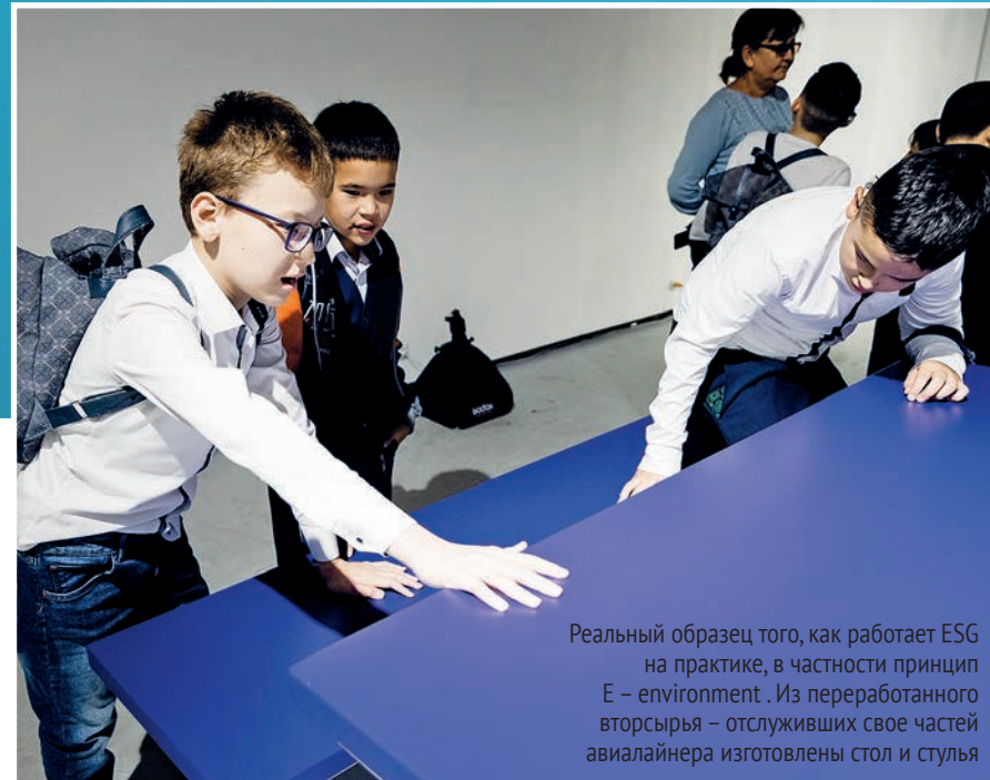
Реальный образец того, как работает ESG на практике, в частности принцип E – environment. Из переработанного вторсырья – отслуживших свое частей авиалайнера изготовлены стол и стулья

Первый индекс ESG появился в 2006 году. Со временем он обрел популярность в мире. ESG-принципы в том виде, как мы их сегодня знаем, впервые сформулировал бывший генеральный секретарь ООН Кофи Аннан. А в 2015 году впервые была проведена конференция по проблемам ESG.