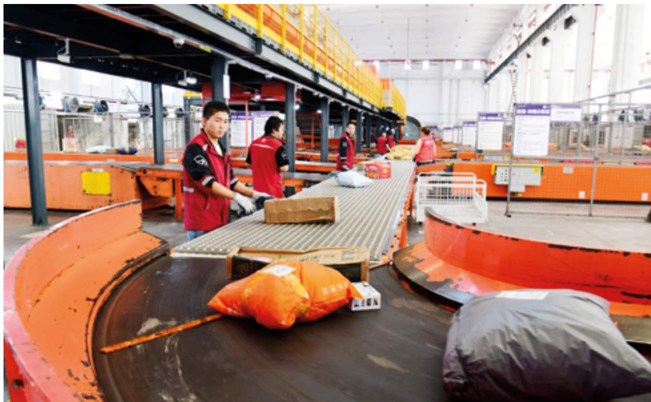
Логистика с увеличением длительности мероприятия стала более организованной

цели время. С увеличением же этого времени торговый фестиваль стал положительной практикой для покупателей, грузоотправителей и продавцов.