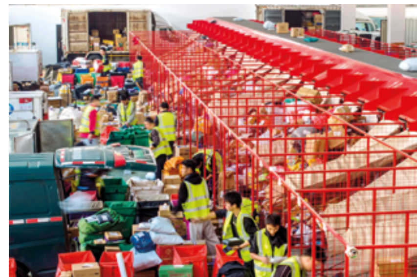
В рамках фестиваля Double 11 покупатели из многих стран мира могут заказать товары на китайских электронных платформах

Такие товары, как сувениры, игрушки и предметы коллекцио-