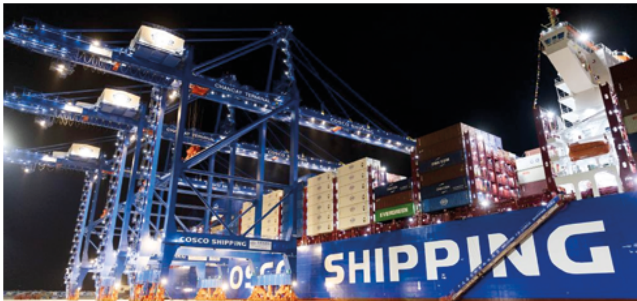
Порт Чанкай – часть масштабной стратегии, направленной на соединение континентов и создание устойчивой инфраструктуры для долгосрочного экономического роста

Торжественное открытие порта Чанкай 14 ноября 2024 года стало важной вехой для Перу и всей Южной Америки. Этот современный глубоководный порт, построенный китайской компанией Cosco Shipping, знаменует собой новый этап в глобальной интеграции и развитии международной торговли в рамках Инициативы «Один пояс и один путь» (BRI).