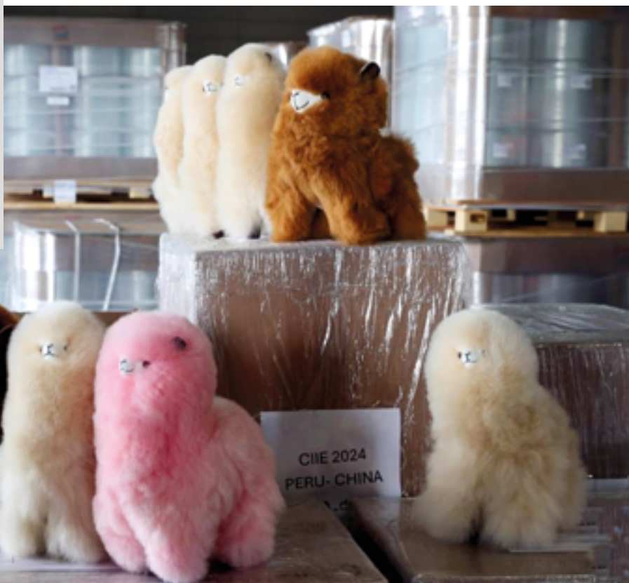
Игрушки в виде перуанской альпаки, или «вармпака», стали одним из самых популярных товаров на Китайской международной импортной выставке (CIEE) 2024 года

анского региона развитию трансграничной торговли, инвестиций и технологического сотрудничества создала такую динамичную среду, где экономики могут процветать сообща. Эта открытость к интеграции дала возможность использовать сильные стороны друг друга в целях достижения взаимовыгодных результатов