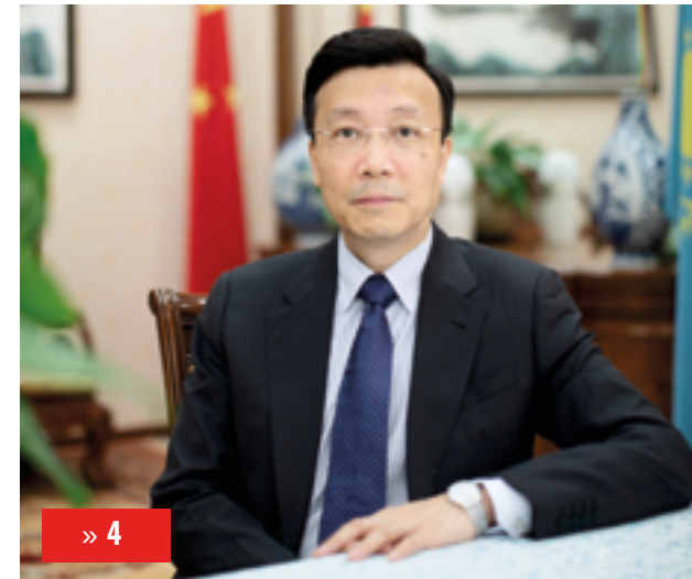
ЧЖАН СЯО: «КАЗАХСТАН – НАДЕЖНЫЙ ПАРТНЕР КИТАЯ»