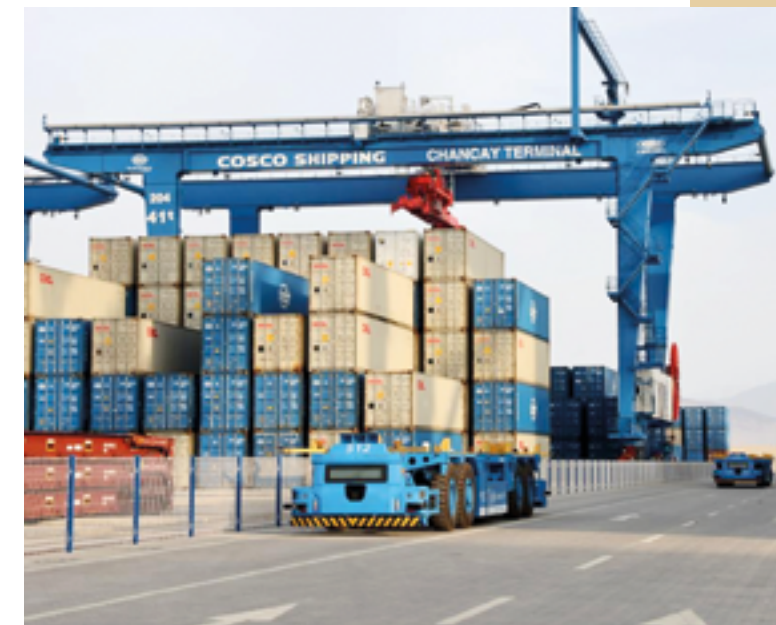
Порт Чанкай – крупнейший в рамках BRI на американском континенте проект готовится радикально изменить торговую логистику

Китай и Перу имеют исторические связи, уходящие в прошлое на 175 лет, начиная с первой волны