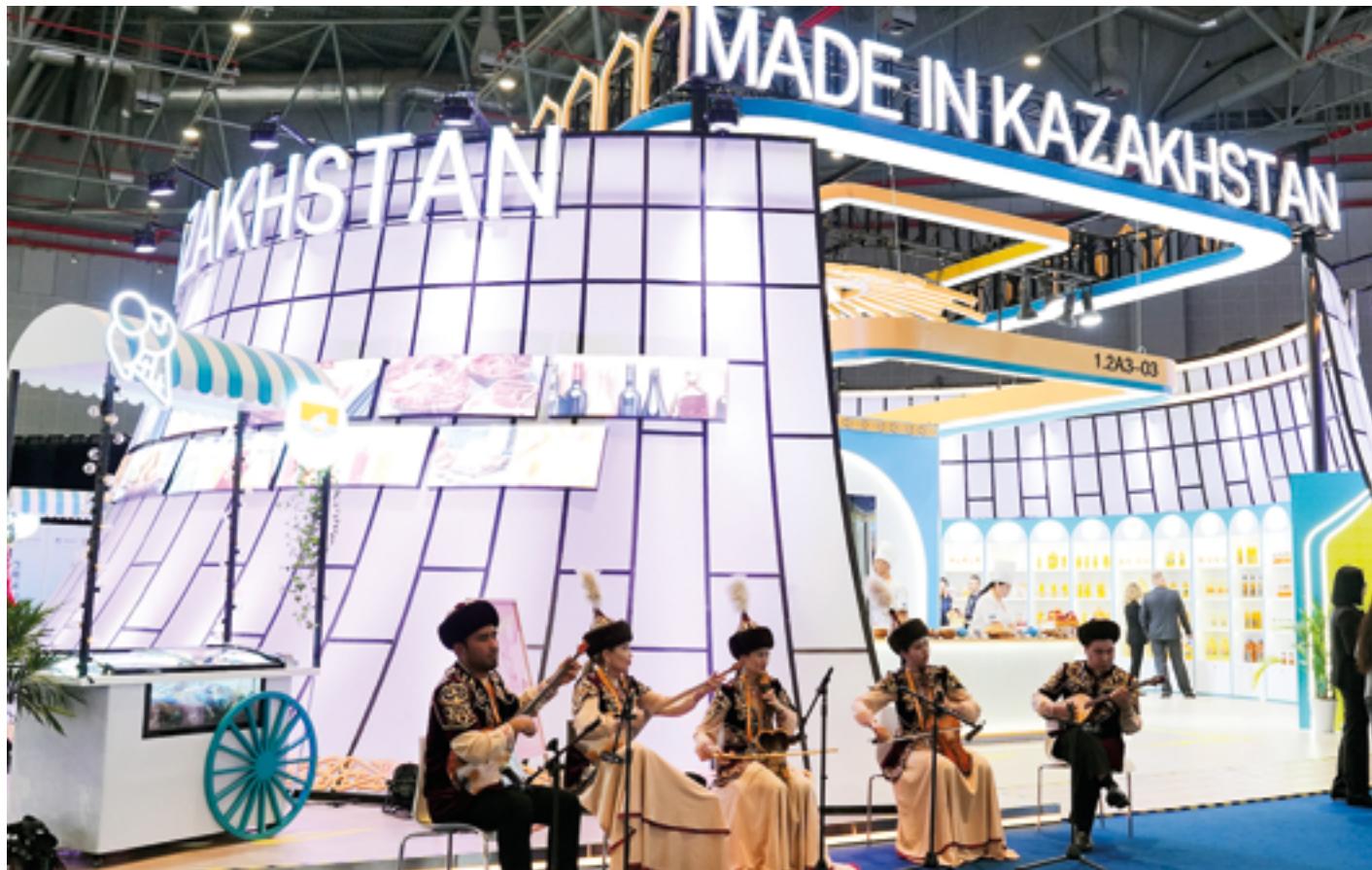
Участие Казахстана в CIIE-2024 стало важной вехой на пути к укреплению торгово-экономических отношений с Китаем и другими странами

На прошедшей в Шанхае VII Китайской международной выставке импорта (China International Import Expo, CIIE) премьер-министр Казахстана Олжас Бектенов представил стратегические достижения нашей страны и перспективные направления для сотрудничества. Ежегодное мероприятие, ставшее крупнейшей площадкой для многоотраслевого обмена, собрало лидеров стран и представителей бизнес-сообщества со всего мира.