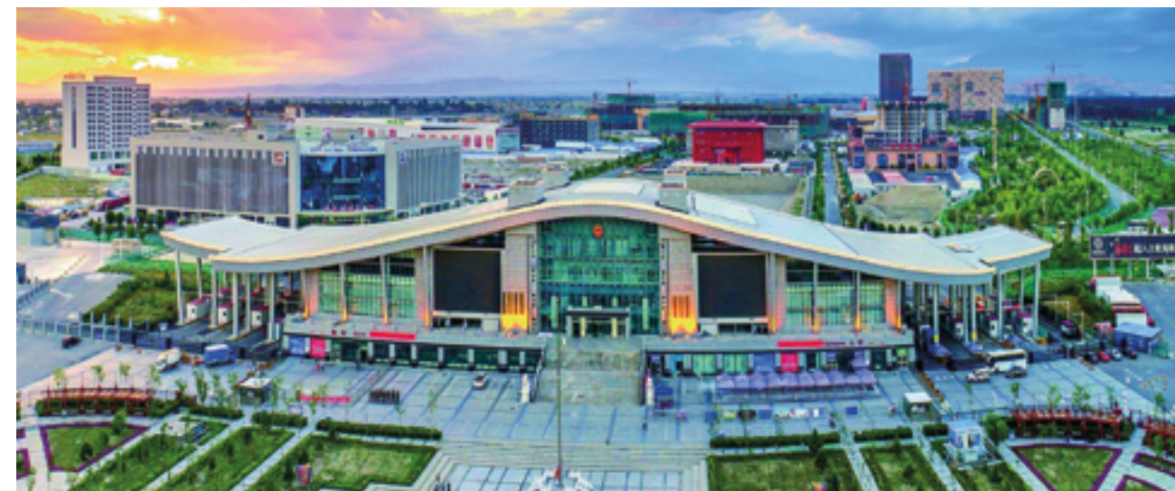
Хоргос – Международный центр приграничного казахстанско-китайского сотрудничества

Между тем 6 ноября около 11:00 по пекинскому времени из города уездного уровня Усу округа Тачэн Синьцзян-Уйгурского автономного района на северо-западе Китая в Алматы отправился первый грузовой поезд, курсиру-