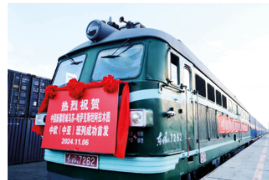
Первый грузовой поезд Усу – Алматы, запущенный в рамках международных железнодорожных грузоперевозок Китай-Европа 6 ноября 2024 г.

Вместе с тем введение в эксплуатацию нового маршрута грузоперевозок Китай-Европа (Китай-Центральная Азия) со стартовой станцией Усу будет способствовать модернизации и агломерации региональной промышленности, оптимизации структуры местных производств и придаст новый импульс экономическому развитию внутренних районов северной части Синьцзяна.