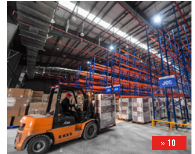
КАЗАХСТАН – КИТАЙ: НОВЫЕ ТОЧКИ РОСТА ТОВАРОБОРОТА