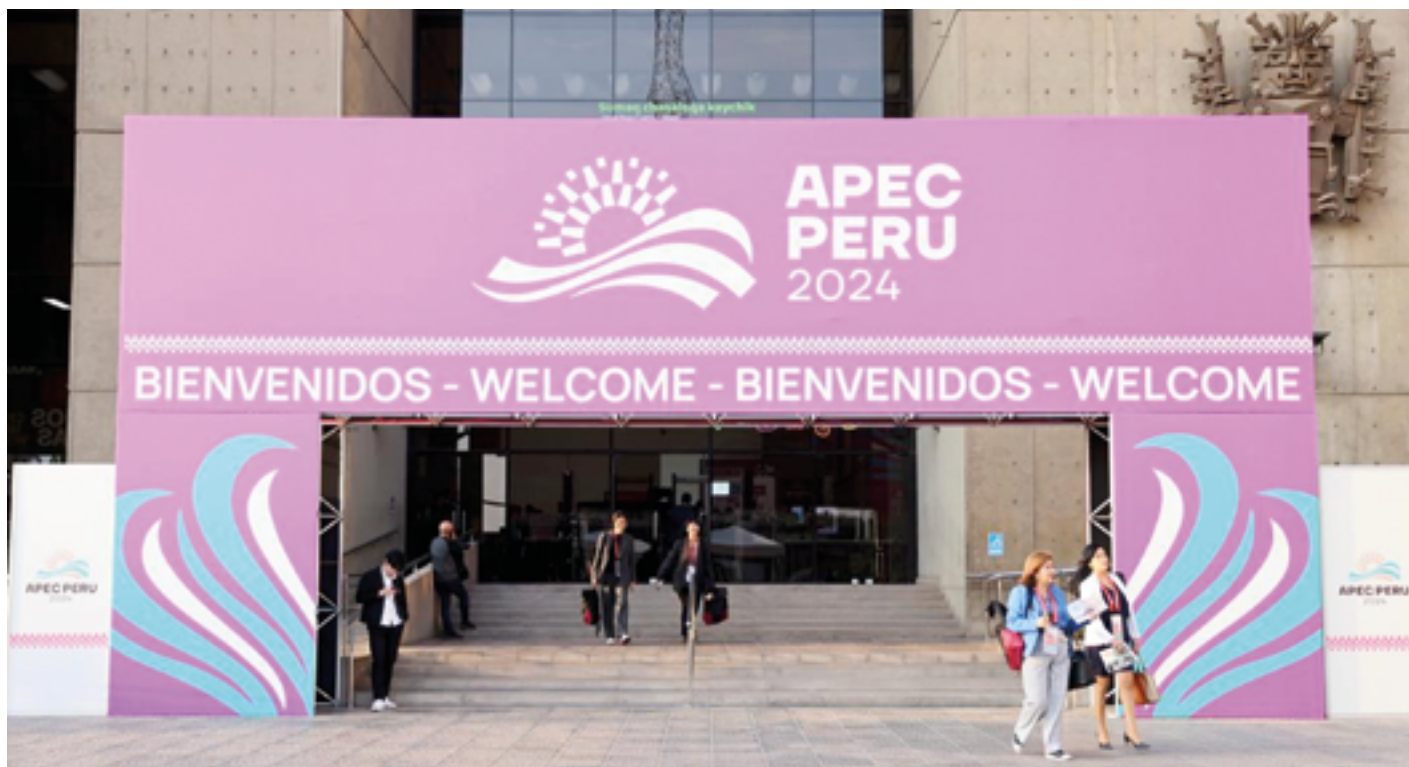
Участники 31-й встречи лидеров экономик стран АТЭС в Перу подтвердили свою приверженность построению интегрированного, открытого региона, который ставит сотрудничество выше конфронтации

В то время как в середине нынешнего месяца высокопоставленные персоны готовились собраться в столице Перу Лиме на 31-ю встречу лидеров экономик стран АТЭС (Азиатско-Тихоокеанское экономическое сотрудничество), возникал лишь один важный вопрос: как Азиатско-Тихоокеанский регион может обеспечить дальнейшее развитие в мире, полном неопределенности?