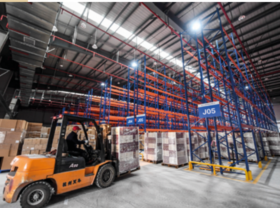
Активизация трансграничной электронной коммерции – один из приоритетных пунктов развития двустороннего партнерства между нашими странами

Посол Казахстана в Китае Шахрат Нурышев провел встречу с заместителем министра коммерции КНР – заместителем представителя Китая на международных торговых переговорах Лин Цзи, в ходе которой были обсуждены состояние и перспективы развития торгово-экономического сотрудничества, совместной реализации в Казахстане инвестиционных проектов и другие вопросы, представляющие взаимовыгодный интерес.