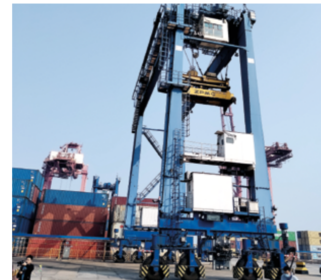
Китайско-казахстанская международная логистическая база в Ляньюньгане, провинция Цзянсу, Китай

Прошедший 2024 год доказал, что Казахстан и Китай способны эффективно сотрудничать во всех сферах – от экономики и логистики до культуры и