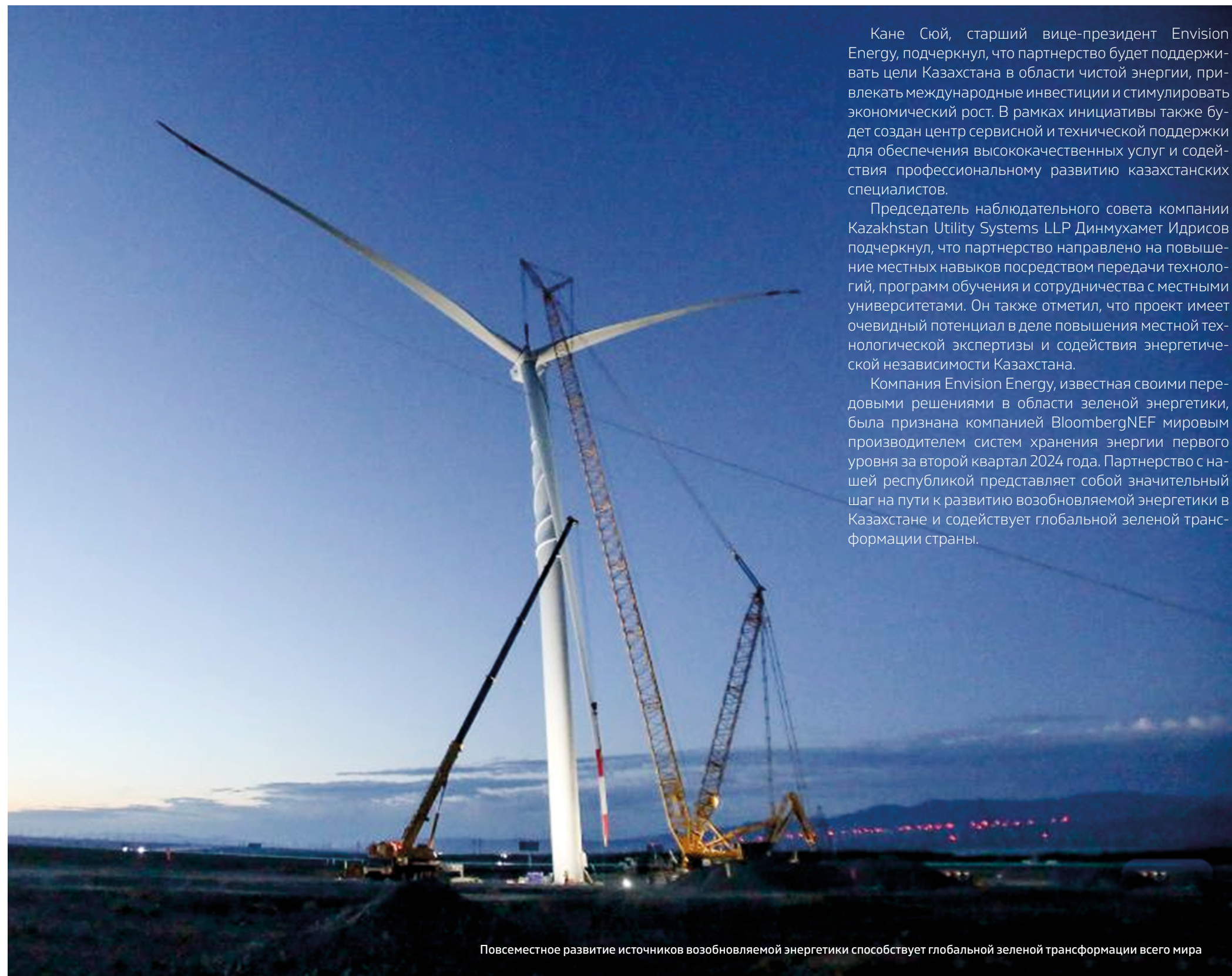
Повсеместное развитие источников возобновляемой энергетики способствует глобальной зеленой трансформации всего мира

Согласно распространенным данным, годовая мощность производства ветровых турбин на объекте составит 2 ГВт, ежегодно будет производиться 250 комплектов. Кроме того, здесь будут производиться системы хранения энергии мощностью 1 ГВт-ч в год, поставки составят 100 комплектов в год. Участие в строительстве компании Envision Energy предоставит Казахстану передовые технологии, наработанный опыт и экспертные знания, что вкпе поможет ускорить переход страны к устойчивой энергетике.