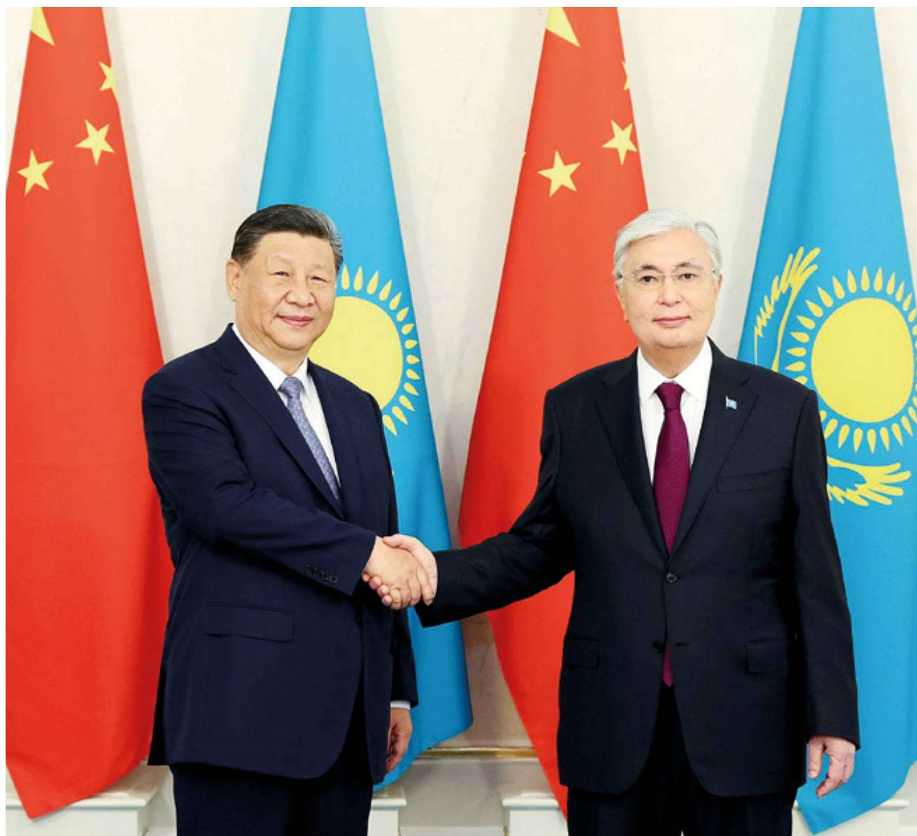
Под руководством лидеров двух стран отношения Китая и Казахстана вышли на качественно новый уровень

Вступив в 2025 год, Казахстан и Китай подводят итоги насыщенного и плодотворного 2024 года. За последние 12 месяцев двусторонние отношения между нашими странами вышли на новый уровень, ознаменовавшись укреплением политического взаимного доверия, значительным расширением экономического сотрудничества и запуском множества совместных намерений в рамках Инициативы «Один пояс и один путь».