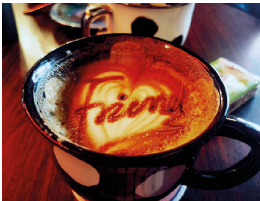
Кофе становится все более популярным напитком в Китае

Китай, известный своими чайными традициями, сегодня превратился в самый быстрорастущий рынок потребления кофе в Восточной Азии, заняв уникальное положение на мировом рынке кофе.