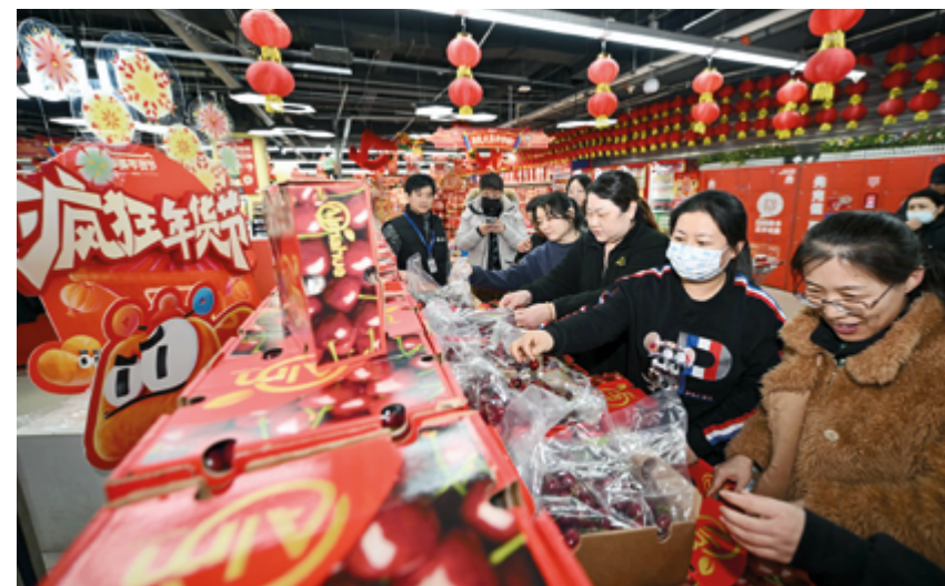
Покупатели выбирают недавно прибывшую чилийскую вишню в супермаркете в Тяньцзине, Северный Китай, 26 декабря 2024 г.

Фестиваль, который в этом году пришелся на 29 января, и сопровождавшие его недельные общенациональные празднования, приуроченные к этой дате, не только спровоцировали всплеск внутреннего потребления, но и создали внушительные возможности для международного бизнеса, ведь китайские потребители активно осваивают как товары