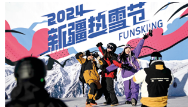
Префектура Алтай переживает расцвет снежно-ледовой экономики в регионе