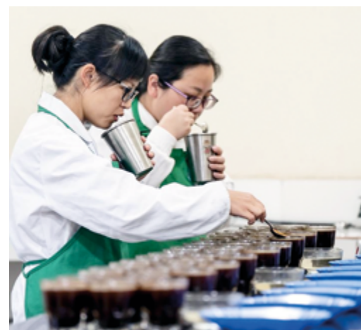
Тестирование сырых кофейных зерен в Центре поддержки фермеров Starbucks в Пуэре, провинция Юньнань на юго-западе Китая

Обычный китаец, несущий чашку кофе, уже ни у кого не вызывает удивления. Будь то кофе по дороге