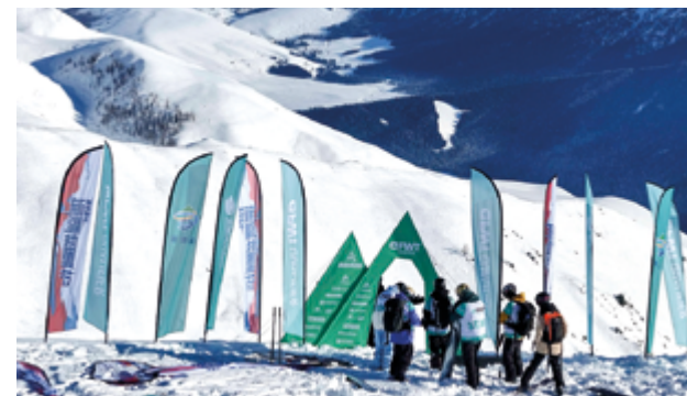
Место проведения квалификационного турнира FWT на международном горнолыжном курорте Цзикепулин, округ Алтай, СУАР, 4 декабря 2024 г.

Алтай сегодня играет важную роль в планах китайских властей