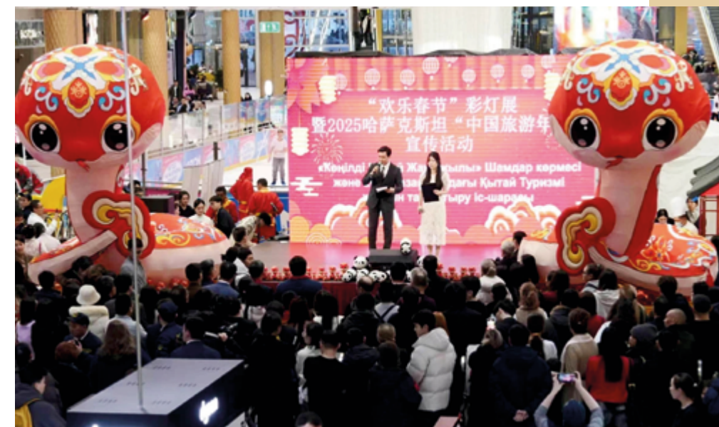
Праздничное мероприятие для посетителей MEGA подарило возможность поближе познакомиться с китайской культурой

Официальный старт Года культурного туризма Китая в