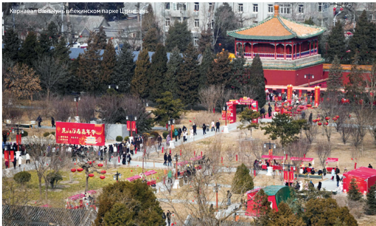
Карнавал Ваньчунь в пекинском парке Цзиншань

Потребительский бум, стремительной волной пронесшийся в дни празднования Нового года по лунному календарю, не только продемонстрировал устойчивость и жизнеспособность экономики Китая, но и выявил потенциал сотрудничества международного масштаба.