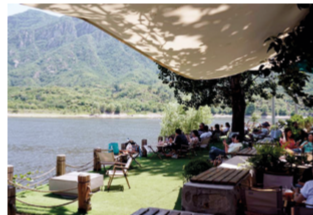
Кофейня Heuyin в окрестностях Пекина

Все больше и больше людей в Китае проникаются любовью к кофе и многое знают о его качестве. «Для меня кофе – это напиток, который может оказать благотворное влияние как физически, так и