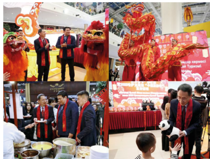
Для гостей мероприятия была подготовлена насыщенная культурная программа

Год культурного туризма Китая в Казахстане обещает стать ярким этапом в истории сотрудничества двух стран, открывая перед ними новые горизонты взаимопонимания и совместного развития.