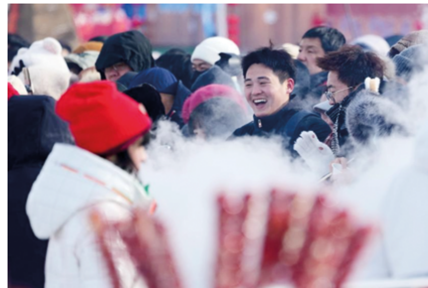
Новый год по лунному календарю – время воссоединения семьи и красочных праздничных мероприятий

Судя по всему, китайских туристов дальность перелетов отнюдь не смущала. Так, гости из Поднебесной были обнаружены даже на нетронутых пляжах танзанийского Занзибара, где они с восторгом осматривали окружающие их