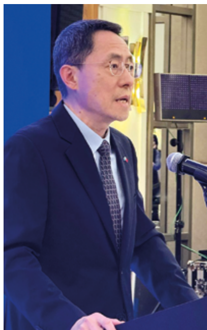
Хань Чуньлинь, Чрезвычайный и Полномочный Посол КНР в Казахстане

В Астане прошел Казахстанско-китайский бизнес-форум, на котором представители деловых кругов двух стран обсудили дальнейшее расширение двустороннего торгово-промышленного сотрудничества. В мероприятии приняли участие около 80 представителей бизнеса Казахстана и Китая.