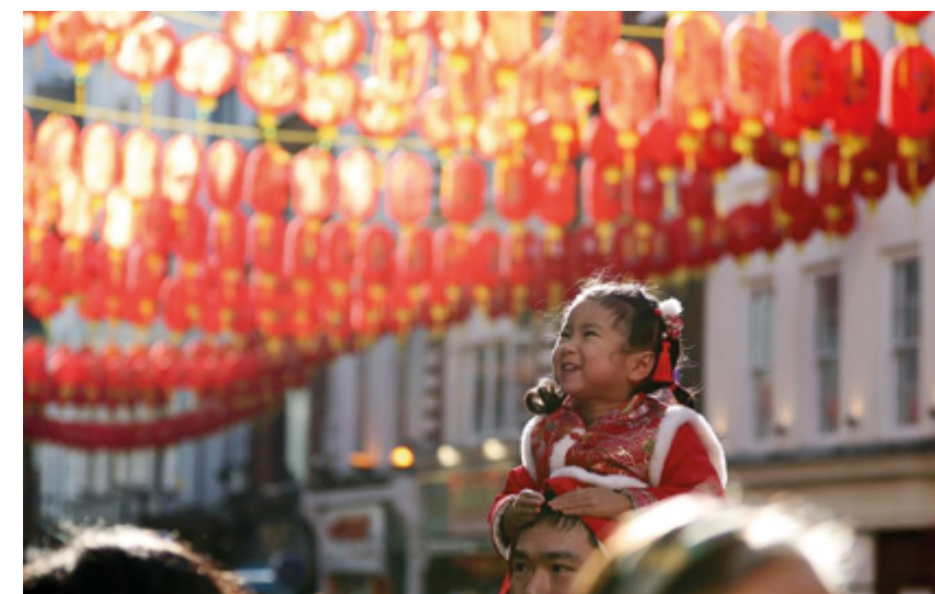
Весенний фестиваль – это не только шопинг и застолье, но и время путешествий и культурных открытий

Вот и чилийская вишня, имеющая привлекательный ярко-красный цвет и символизирующая процветание в китайской культуре, также удостоилась звания одного из фаворитов среди китайских покупателей.