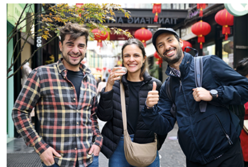
Туристы из-за рубежа с удовольствием прибывали в Китай, чтобы самостоятельно принять участие в Празднике встречи весны

Между тем Праздник весны 2025 года, без сомнений, ознаменовал новую веху для переживающей сегодня свой расцвет киноиндустрии Китая: по данным