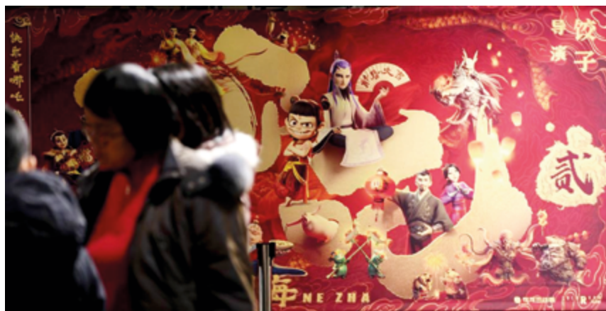
Вышедший в прокат в первый день Праздника весны китайский анимационный блокбастер «Нэчжа 2» побил все рекорды кассовых сборов

«Мы хотим продолжать исследовать рынок, развивать электронную коммерцию и продвигать наш бренд Garces Fruit. Я