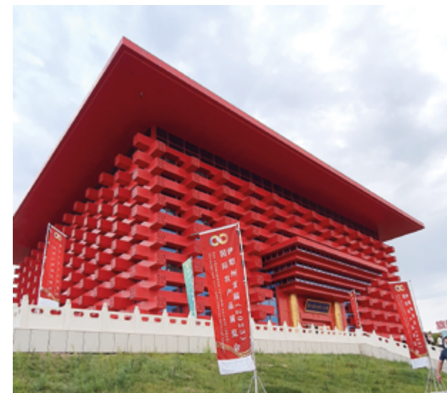
Рабочий офис казахстанских и китайских СМИ на МЦПС «Хоргос»

обсуждали не только двусторонние отношения, но и вопросы глобальной безопасности. Особую роль играет взаимодействие в рамках Шанхайской организации сотрудничества (ШОС) и формата «Китай – Центральная Азия».