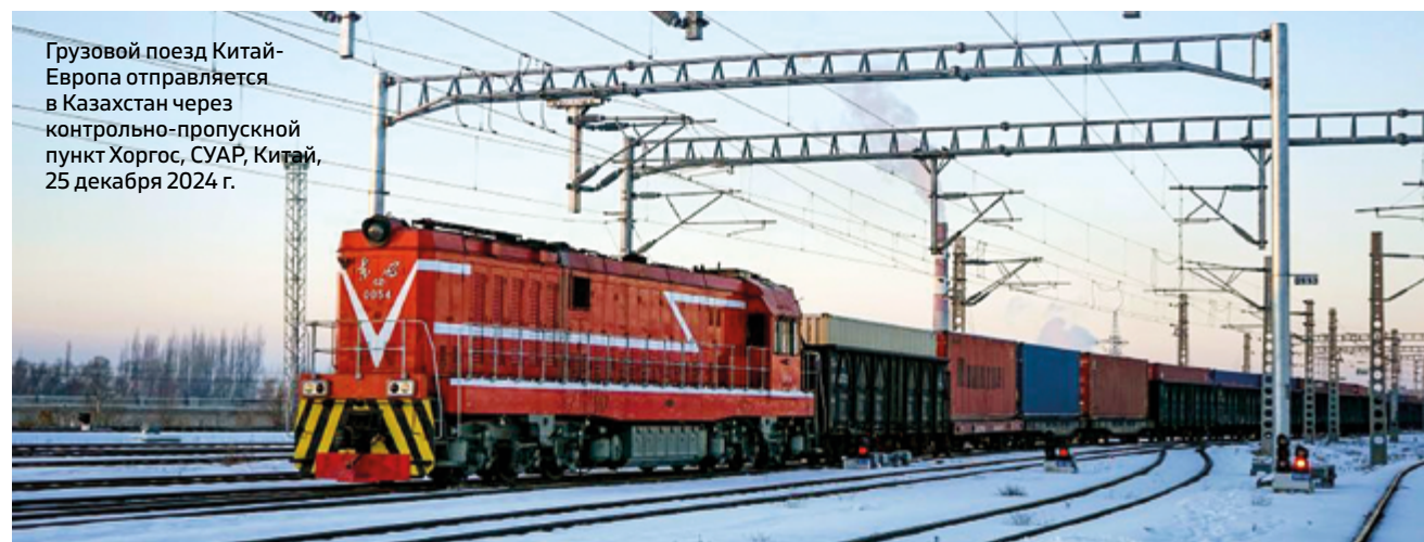
Грузовой поезд Китай-Европа отправляется в Казахстан через контрольно-пропускной пункт Хоргос, СУАР, Китай, 25 декабря 2024 г.

Политическое сотрудничество между Казахстаном и Китаем остается важным фактором региональной стабильности. В 2024 году главы двух государств провели несколько встреч, на которых