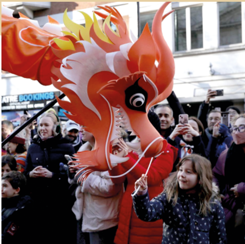
Мероприятия по случаю празднования китайского Нового года в Лондоне, Великобритания, 2 февраля 2025 г.

думаю, что предстоит еще многое сделать», — добавил бизнесмен.