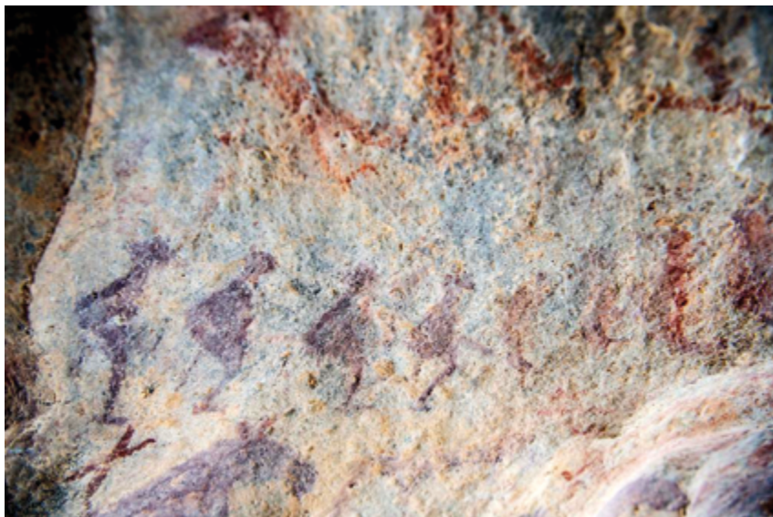
Наскальный рисунок, изображающий древних людей, катающихся на покрытых мехом деревянных лыжах во время охоты, поселок Хандгайт, Алтайский округ, СУАР

В сезон зимнего туризма 2023-2024 гг. Алтай посетили около 4,89 млн человек, а общий доход от туризма составил 5,1 млрд юаней (около 711,3 млн долларов). Регион обеспечил около половины роста как посещений, так и прибыли от общего объема доходов Синьцзяна.