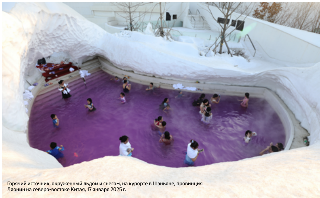
Горячий источник, окруженный льдом и снегом, на курорте в Шэньяне, провинция Ляонин на северо-востоке Китая, 17 января 2025 г.