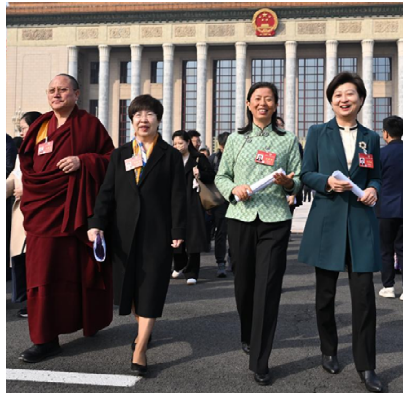
По итогам состоявшегося мероприятия ожидается продолжение работы по укреплению инициативы «Один пояс и один путь», способствующей развитию инфраструктуры и торговых связей по всему миру

Во внешнеполитическом курсе Китай подтверждает свою приверженность миру и многостороннему сотрудничеству. Ожидается продолжение работы по укреплению инициативы «Один пояс и один путь», способствующей развитию инфраструктуры и торговых связей по всему миру. Также Китай стремится углубить партнерство со странами Глобального