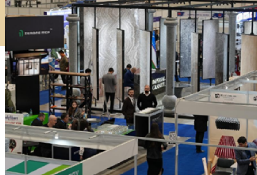
Посетители UzBuild, международной выставки строительства и дизайна интерьера, в Ташкенте, столице Узбекистана, 25 февраля 2025 г.