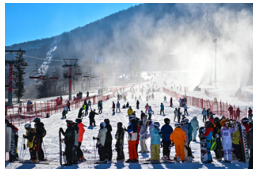
Любители лыж и сноуборда на склонах горнолыжного курорта Бэйдаху в городе Цзилинь, провинция Цзилинь на северо-востоке Китая, 23 ноября 2024 г.

«Это моя первая поездка в Китай. Мы купались в горячих источ-