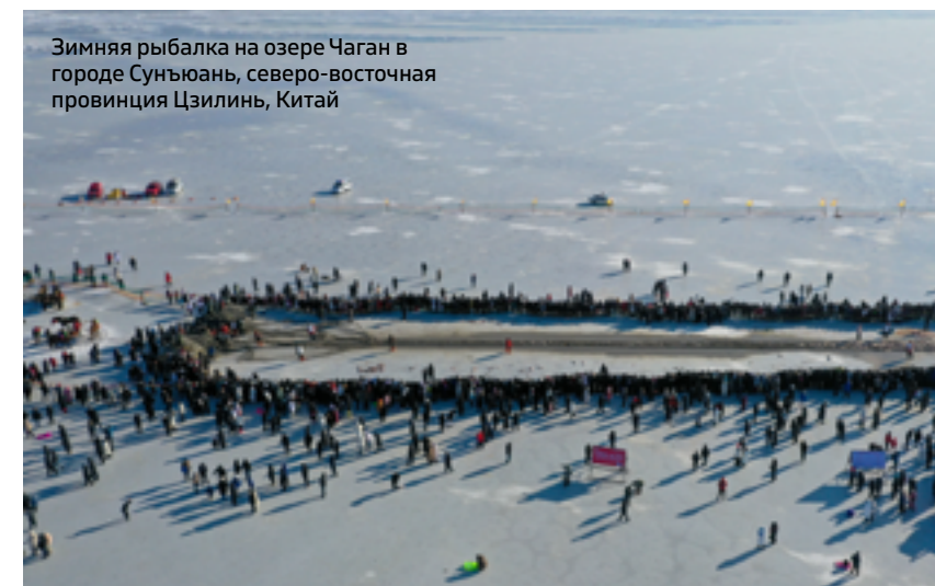
Зимняя рыбалка на озере Чаган в городе Сунъюань, северо-восточная провинция Цзилинь, Китай

Отметим также, что согласно рекомендациям, опубликованным Государственным советом в прошлом году, Китай намерен превратить свою снежно-ледяную экономику в отрасль с оборотом в 1,2 трлн юаней к 2027 году и в 1,5 трлн юаней к 2030 году.