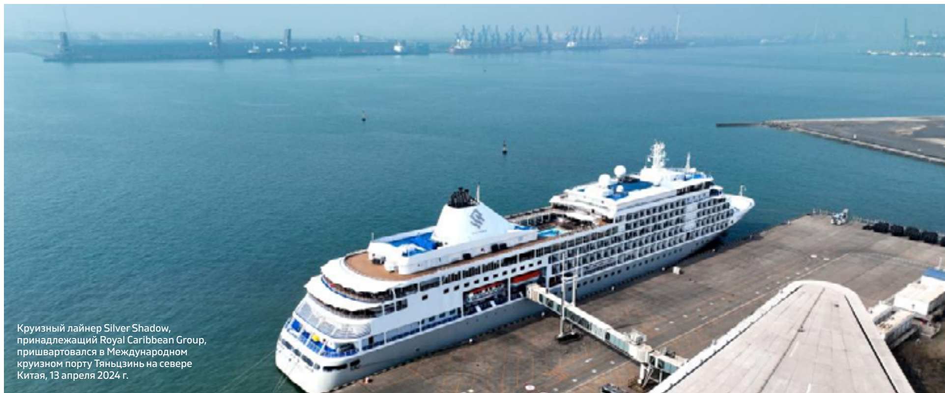
Круизный лайнер Silver Shadow, принадлежащий Royal Caribbean Group, пришвартовался в Международном круизном порту Тяньцзинь на севере Китая, 13 апреля 2024 г.