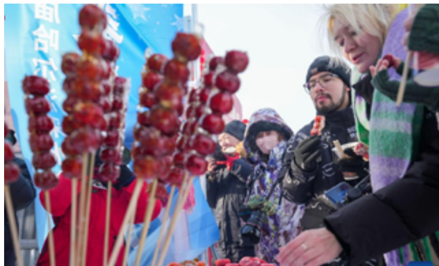
Харбин набрал грандиозную популярность в социальных сетях, привлекая многочисленных туристов

родов, отметил, что северо-восточный Китай должен гордиться своим сочетанием ледовых и снежных развлечений с горячими источниками, ведь в регион