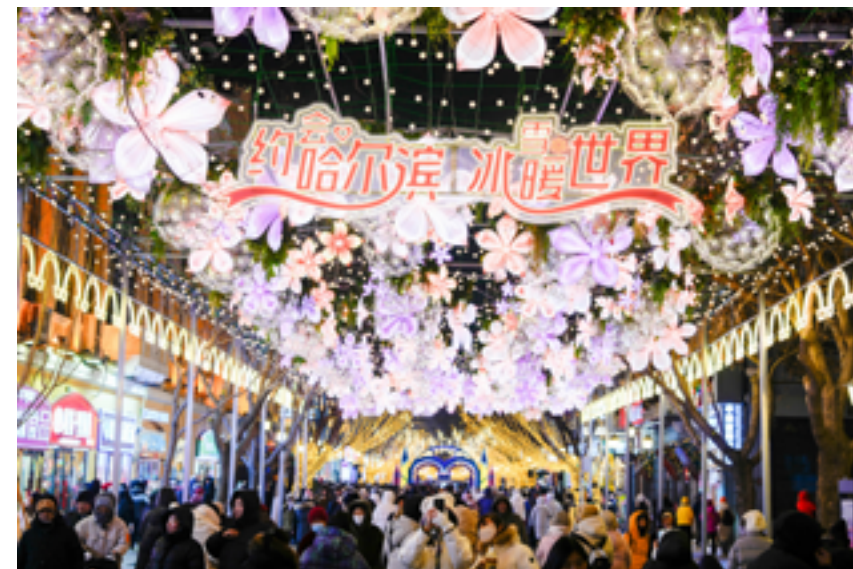
Центральная улица в Харбине, провинция Хэйлунцзян на северо-востоке Китая, 30 января 2025 г.

Этой зимой здесь представили новую услугу: теперь гости могут понежиться в горячих источниках на открытом воздухе, наслаждаясь блюдами из мяса и овощей, сваренных в шипящих горшках, причем прямо в бассейнах установили столы и табуреты.