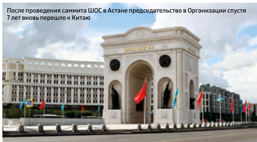
После проведения саммита ШОС в Астане председательство в Организации спустя 7 лет вновь перешло к Китаю

Циндаоский саммит Шанхайской организации сотрудничества, ставший знаковой вехой в развитии организации. В 2025 году Китай, оправдывая ожидания, вновь проведет дружеский, сплоченный и плодотворный саммит Шанхайской организации сотрудничества, чтобы вывести организацию на новый этап высококачественного развития, характеризующийся укреплением единства, углублением взаимодействия, динамичностью и эффективностью. В ходе саммита будет принята Декларация саммита, приуроченная к 80-летию Победы в Войне сопротивления китайского народа