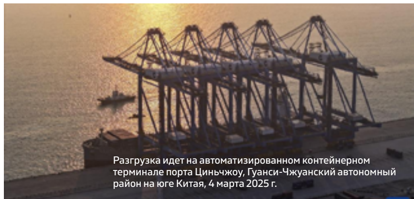
Разгрузка идет на автоматизированном контейнерном терминале порта Циньчжоу, Гуанси-Чжуанский автономный район на юге Китая, 4 марта 2025 г.

Экспорт Китая продолжал демонстрировать структурные улучшения в первые два месяца. Вывоз машиностроительной и электротехнической продукции, состав-