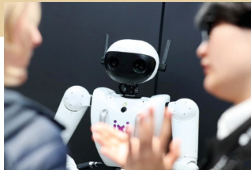
На мероприятии был представлен широкий ряд инновационных продуктов

«Человеческое общество стремительно движется к интеллектуальному миру, где вездесущие интеллектуальные приложения требуют более мощных сетевых