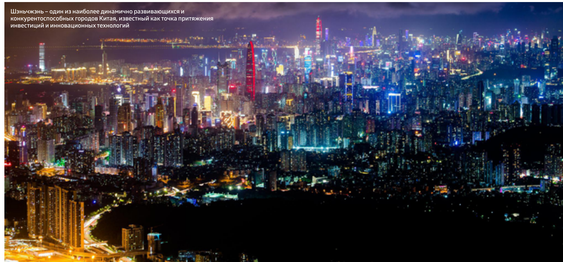
Шэньчжэнь – один из наиболее динамично развивающихся и конкурентоспособных городов Китая, известный как точка притяжения инвестиций и инновационных технологий

зинов, представляющих выход международных и отечественных брендов на глобальный, азиатский, китайский или муниципальный рынок. Так, в прошлом году в Шанхае компания Apple открыла свой крупнейший розничный магазин на материковой части Китая, а Starbucks выпустила на китайский рынок шесть напитков Oleato – кофе с оливковым маслом.