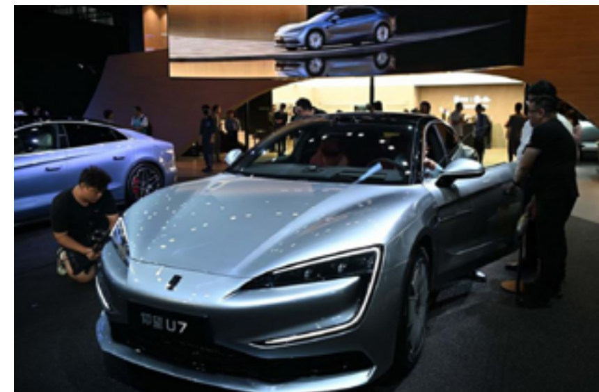
Yangwang U7 от BYD на 22-й Международной автомобильной выставке в Гуанчжоу в Китайском импортно-экспортном выставочном комплексе, 15 ноября 2024 г.

Президент DJI Ло Чжэньхуа солидарен с этим утверждением,