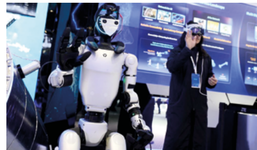
Стремительное развитие новых технологий вызывает системные изменения в повседневной жизни, производстве и управлении

Поскольку искусственный интеллект и телекоммуникации пере-