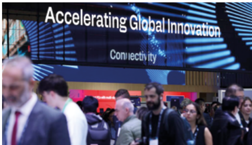
Посетители Всемирного мобильного конгресса-2025 в Барселоне, Испания, 5 марта 2025 г.

На Всемирном мобильном конгрессе (MWC) 2025 года, который состоялся в начале марта в Барселоне, Испания, искусственный интеллект прочно зарекомендовал себя в качестве основного компонента мобильной и телекоммуникационной отрасли.