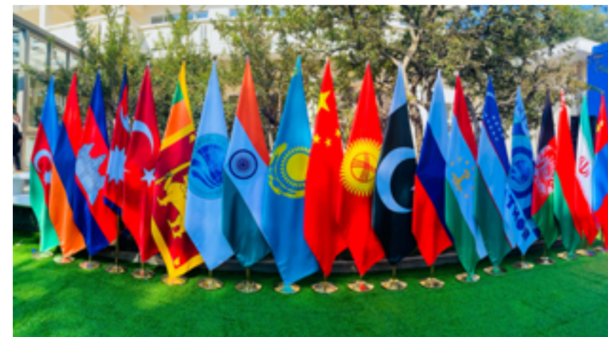
На сегодняшний день ШОС – трансрегиональная международная организация с самой большой территорией охвата и самым многочисленным населением в мире

С момента своего создания в 2001 году Шанхайская организация сотрудничества всегда придерживается «шанхайского духа» – взаимного доверия, взаимной выгоды, равноправия, взаимных консультаций, уважения многообразия культур и стремления к совместному развитию, и продолжает укреплять политическое взаимное доверие, расширять добрососедские и дружеские отношения, совместно защищать региональную безопасность и развивать практическое сотрудничество, что способствует постоянному росту ее влияния, сплоченности и притягательности. В настоящее время «семья» Шанхайской организации сотрудничества выросла от первоначальных 6 государств-основателей до нынешних 10 государств-членов, также в нее входят 2 государства-наблюдателя, 14 стран-партнеров по диалогу, охватывая 26 стран на трех континентах, общей площадью более 36 миллионов квадратных километров, что составляет более 65% Евразийского континента. Население его государств-членов превышает 3,3 миллиарда человек, что составляет около 42% от общей численности населения мира, сегодня