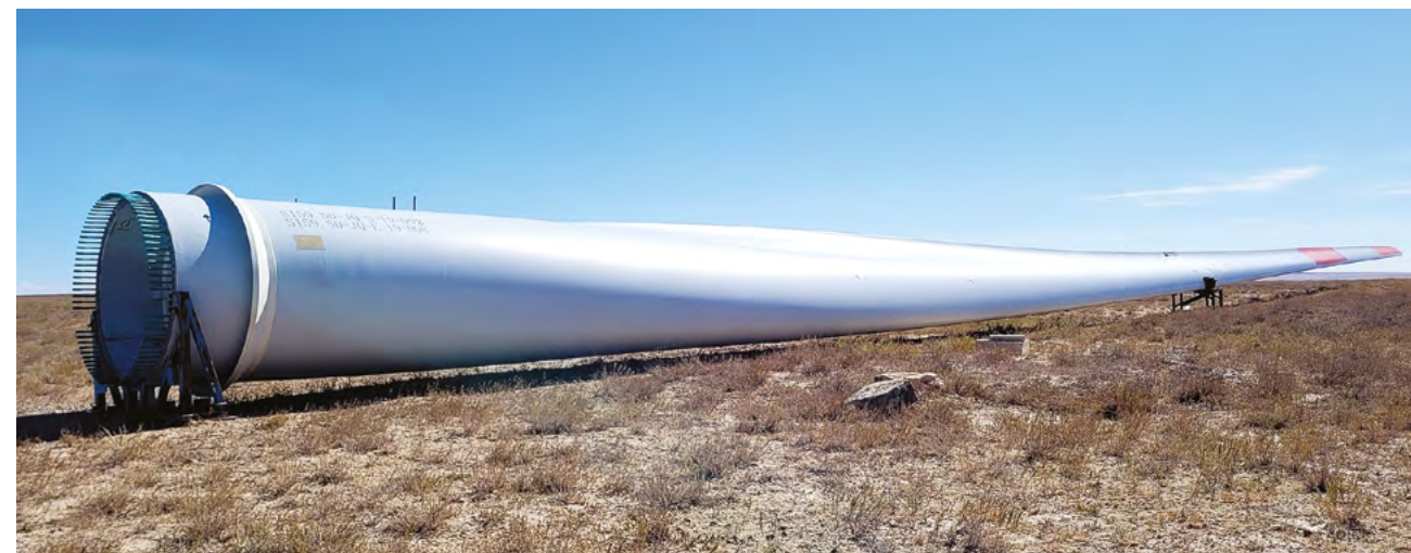
Партнерство с Китаем помогает Казахстану как стабилизации, так и активному развитию

Торговля, которая растет вопреки кризисам. За последние десять лет товарооборот Казахстана и Китая вырос более чем вдвое и в 2023-2024 гг. превышал 40 млрд долларов – рекорд за всю историю отношений. Для сравнения: это больше, чем Казахстан торгует со всеми странами Центральной Азии вместе взятыми. Китай остается крупнейшим рынком для казахстанских металлов, урана, химической продукции, продовольствия и энергетики. В условиях