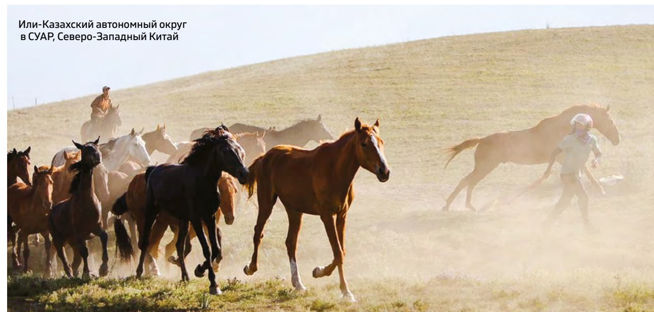
Или-Казахский автономный округ в СУАР, Северо-Западный Китай

...Автобус наш, тем временем, продолжал свой путь сквозь просторы Синьцзяна, и звуки «Дударай» еще долго наполняли салон – светлые, певучие, будто рожденные самой степью. Они словно становились мостом между культурами, людьми и чувствами, объединяя нас – таких разных, но удивительно близких.