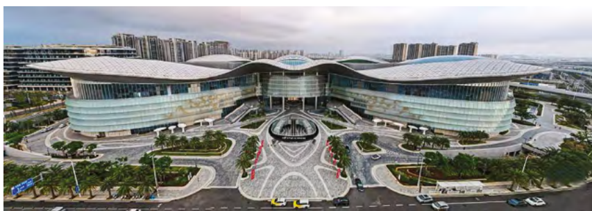
Хайнаньская зона свободной торговли переходит на новый этап своего развития

Хэ Лифэн особо отметил, что общеостровные специальные таможенные операции должны послужить возможностью для углубления реформ в ключевых секторах, неуклонного продвижения высококачественного развития, совершенствования системы предотвращения и контроля