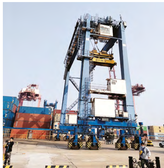
Ежегодно Китай создает более одной трети роста мировой экономики

Можно сказать проще: когда гигант продолжает идти, у мира появляется шанс не остановиться.