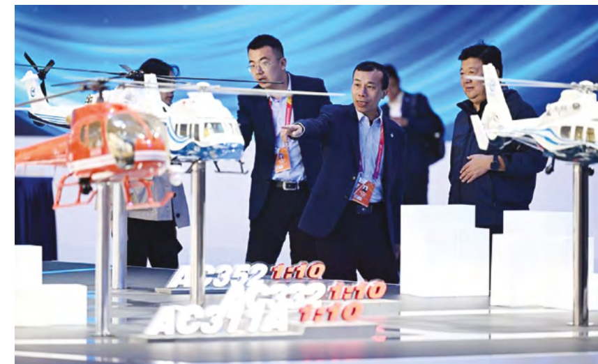
Посетители 7-й Китайской вертолетной выставки в Тяньцзине, 16 октября 2025 г.

По словам Чжу, система развернута более чем в 30 провинциях и муниципалитетах по всему Китаю. Она предоставляет интегрированное решение «беспилотники-сеть-облако» для таких секторов, как местные энергетические компании, возобновляемая энергетика, пожаротушение и реагирование на чрезвычайные ситуации, городское управление, лесное хозяйство и интеллектуальный туризм.