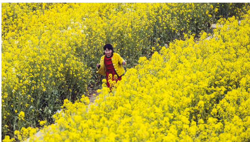
К концу 2020 г. в стране были полностью выведены из нищеты 98,99 млн малообеспеченных сельских жителей

«слабая птица» не только может взлететь первой, но и набрать высоту. Успех Китая показывает, что достигнутые аналогичные