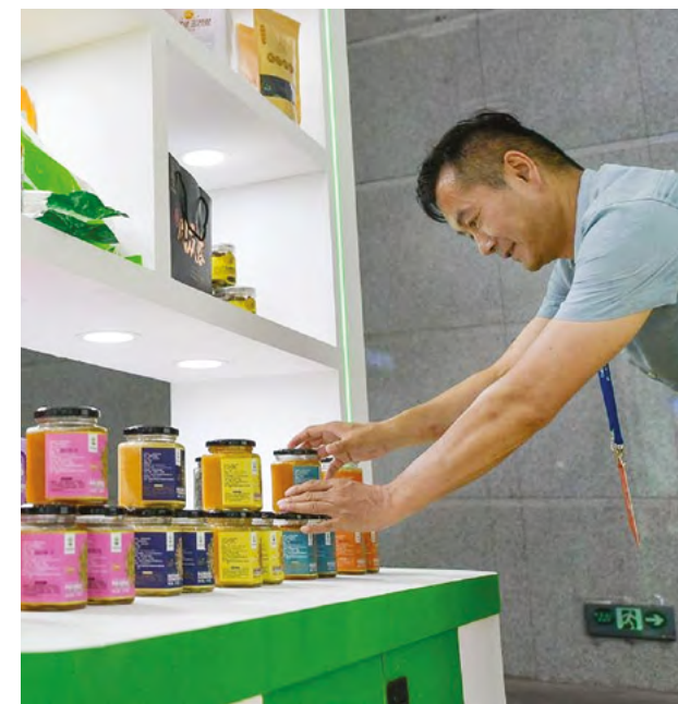
Открытость к сотрудничеству превращают страну в один из ключевых стабилизаторов 21-го века

Логистика, меняющая карту региона. Китайские инвестпроекты в транспортной инфраструктуре расширили пропускную способность ключевых погранпереходов, а мультимодальные хабы обеспечили рост транзита. Сегодня более 50% транзита между Китаем и Европой по сухопутному маршруту проходит через Казахстан, а новые проекты усиливают роль Казахстана как центрального звена Евразии.