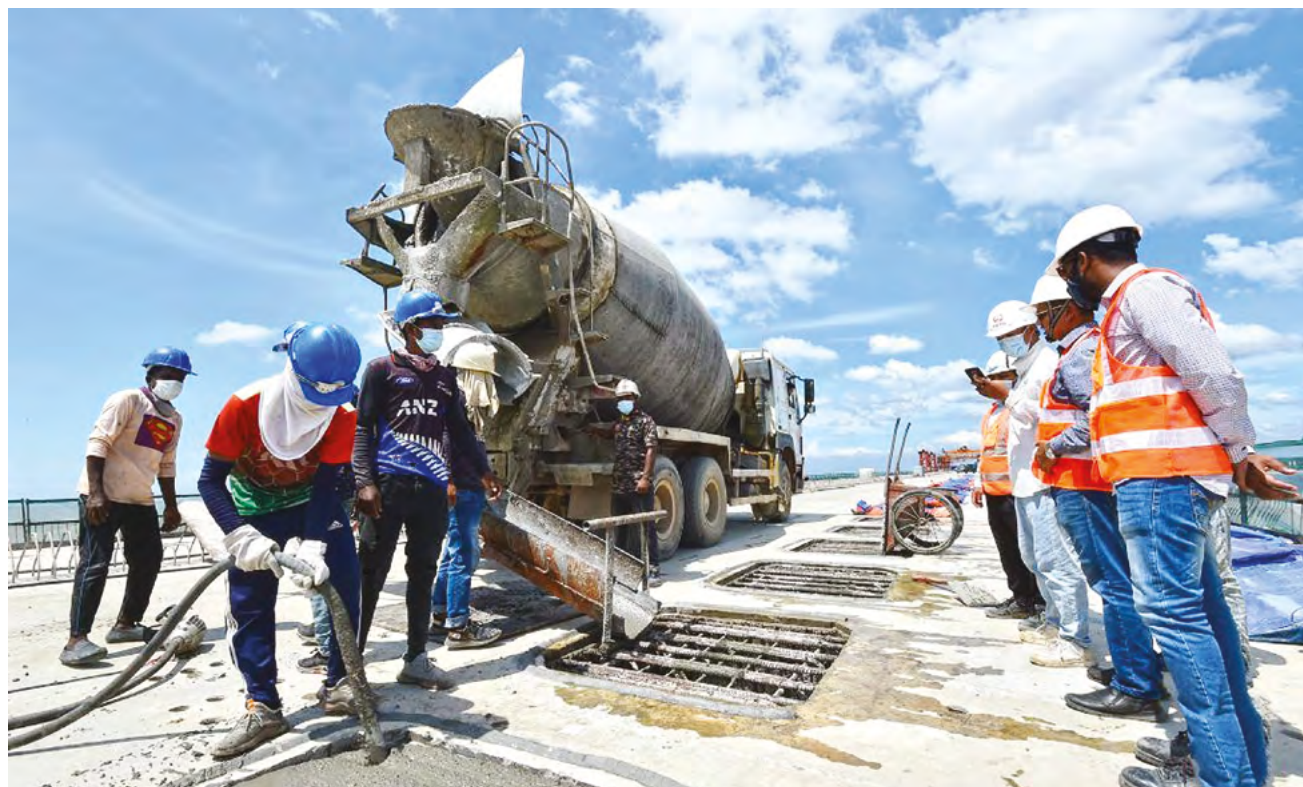
Строительство стратегически важного объекта – моста Падма в Бангладеш стало возможным благодаря содействию китайской стороны

чивого развития. В июле в Синьцзяне был официально учрежден Китайско-Центрально-Азиатский центр сотрудничества по сокращению бедности, торжественное открытие которого состоялось на Втором саммите «Китай – Центральная Азия» и ознаменовало новый этап взаимодействия Китая со странами региона в сфере сокращения бедности.