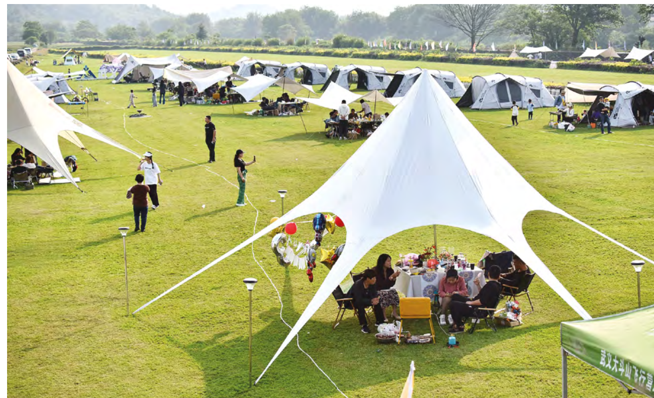
Сокращение бедности в Китае было выведено на уровень государственной стратегии

и расширять результаты борьбы с бедностью, всесторонне способствовать возрождению сельских местностей и стимулировать продвижение к китайской модернизации.