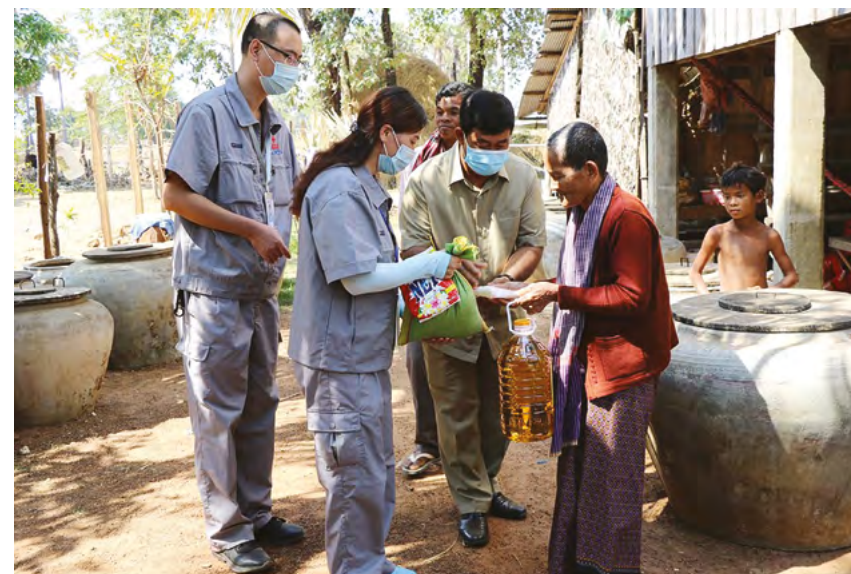
Китайские инженеры доставляют предметы первой необходимости сельским жителям рядом с новой скважиной, построенной КНР в провинции Кампонг Спё, Камбоджа, 15 января 2021 г.

Сотрудничество по сокращению бедности становится новой яркой точкой и драйвером взаимодействия Китая со странами Центральной Азии. Стороны как на двусторонней основе, так и на многосторонних площадках, включая ШОС и механизм «Китай-Центральная Азия», поддерживают тесные контакты по вопросам сокращения бедности и развивают гибкие и многообразные формы практического взаимодействия