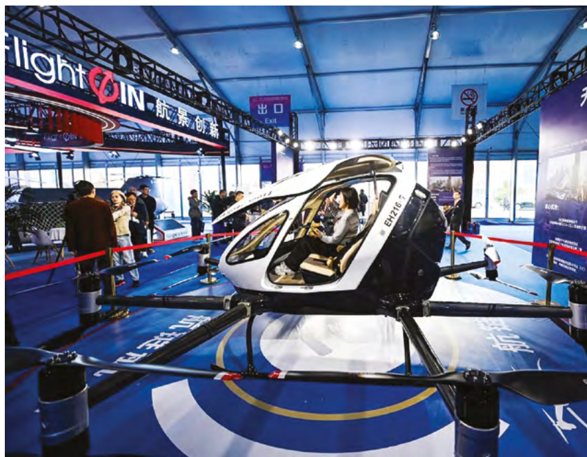
Электрический летательный аппарат вертикального взлета и посадки (eVTOL) представлен на 7-й Китайской вертолетной выставке в Тяньцзине, Северный Китай, 16 октября 2025 г.

Осенью текущего года китайский Тяньцзинь, в начале сентября проводивший самый масштабный саммит ШОС в истории Организации, отличился еще одним грандиозным событием – в городе была развернута 7-я Китайская вертолетная выставка. Экспозиция разместилась в масштабном павильоне площадью 5000 квадратных метров, каждый из которых был посвящен экономике малых высот.