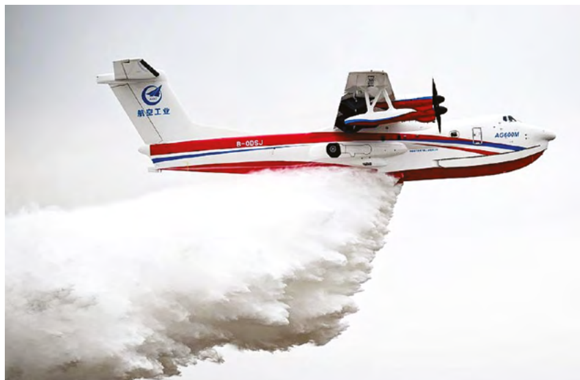
Вертолет-амфибия AG600 выполняет полет во время 7-й Китайской вертолетной выставки в Тяньцзине, 16 октября 2025 г.

Появление таких компаний, как i-KINGTEC, является частью более широкого национального подъема в сфере экономики малых высот. Этот сектор получил беспрецедентный импульс после включения в правительственный отчет о работе в 2024 году, в котором он был позиционирован как новый двигатель роста наряду с биопроизводством и коммерческим космическим сектором.