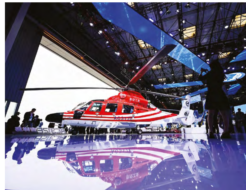
Вертолет AC312E, представленный на 7-й Китайской вертолетной выставке в Тяньцзине, 16 октября 2025 г.