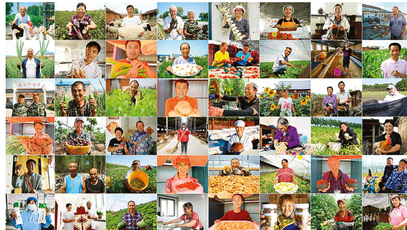
Со времен своего образования КНР выработала успешный путь сокращения бедности с китайской спецификой

нию бедности открыла новые пути для глобального искоренения нищеты. Исходя из национальных реалий, Китай выработал путь сокращения бедности с китайской спецификой.