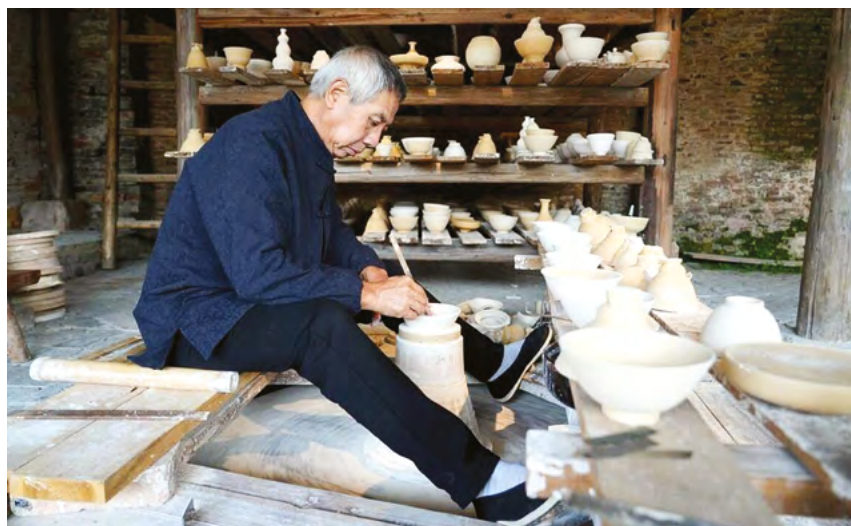
Мастер демонстрирует процесс изготовления фарфора в историко-культурном квартале Таоянли города Цзиндэчжэнь, провинция Цзянси, Восточный Китай

Поднебесная подарила миру много удивительных изобретений, особняком среди которых стоит великолепный фарфор. Со временем изготавливать этот материал научились во многих странах, однако именно китайские фарфоровые изделия пользуются наибольшим спросом среди ценителей и коллекционеров со всего света.