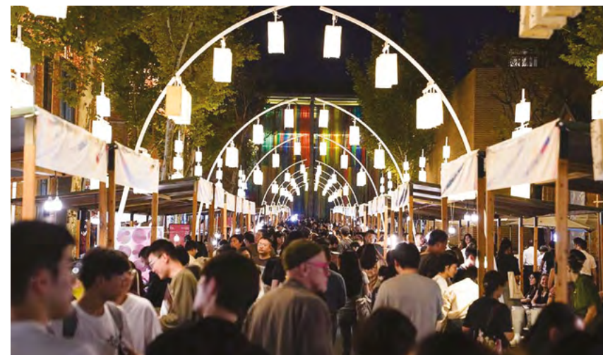
Ярмарка фарфора в культурно-творческом квартале Таосичуань в Цзиндэчжэне, 17 октября 2024 г.

Молодые студии и компании электронной коммерции используют 3D-печать и онлайн-платформы для удовлетворения между-