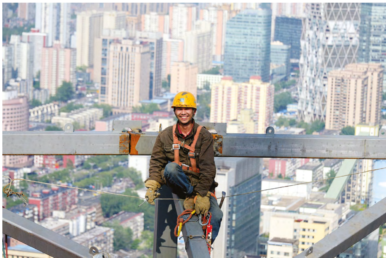
Китай на 10 лет раньше установленного срока достиг цели снижения уровня бедности, поставленной в рамках Повестки дня ООН

поддержки, планировании проектов, использовании средств, доведении мер до каждого домохозяйства, закреплении кадров за конкретными деревнями и оценке эффективности мер по снижению уровня бедности и т.д. Исключается принцип «сплошного орошения» ресурсов, вместо этого проводится индивидуальная и адресная помощь, при которой «лекарство подбирается по диагнозу».