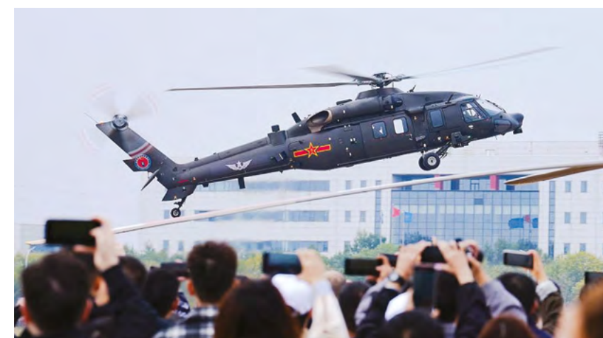
Вертолет пилотажной группы «Фэнлэй» Народно-освободительной армии Китая (НОАК) выполняет трюк во время церемонии открытия 7-й Китайской вертолетной выставки, Тяньцзинь, 16 октября 2025 г.

На прошедшей седьмой Китайской вертолетной выставке было подписано 21 соглашение по проектам в авиационной отрасли. Эти документы охватывают такие области, как экономика полетов на малых высотах, НИОКР, производство оборудования, авиационная подготовка, техническое