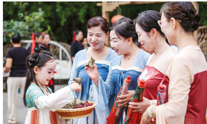
При реализации мер по снижению бедности Китай всегда ставит интересы народа на первое место

«Один пояс и один путь», а также взаимовыгодное сотрудничество в сферах торговли и инвестиций, сельского хозяйства, транспорта и логистики постоянно создают новый импульс для экономического развития двух стран. Смотря в будущее, китайская сторона готова использовать разработку и реализацию 15-й пятилетней программы как важную возможность для укрепления согласования политики развития с Казахстаном, углубления обмена опытом и реализации совместных проектов по сокращению бедности, а также для совместного продвижения развития и процветания государств, достижения социального благосостояния и всестороннего развития личности, с целью формирования сообщества единой судьбы Китая и Казахстана.