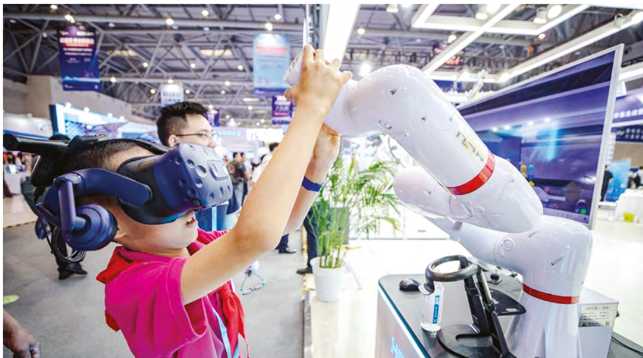
Китайская экономика движется вперед, опираясь на внутренний рынок, инновации и огромный производственный фундамент

нут за собой не только собственную экономику, но и мировой рынок. В период кризиса это становится особенно заметно: Китай снижает мировую инфляцию дешевыми технологиями, поддерживает логи-