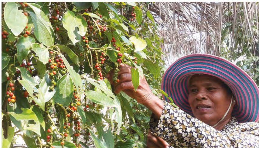
По прогнозам Всемирного банка, к 2030 году инициированное Китаем совместное строительство инициативы «Один пояс и один путь» может помочь около 7,6 млн человек выйти из крайней бедности

ческие направления социально-экономического развития Китая на ближайшие 5 лет. В период реализации 15-й пятилетней программы Китай намерен продолжать укреплять