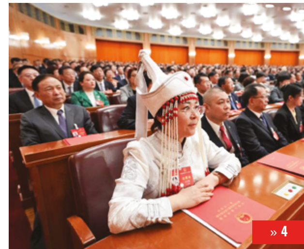
КИТАЙ ФОРМИРУЕТ БУДУЩЕЕ: ИТОГИ «ДВУХ СЕССИЙ»