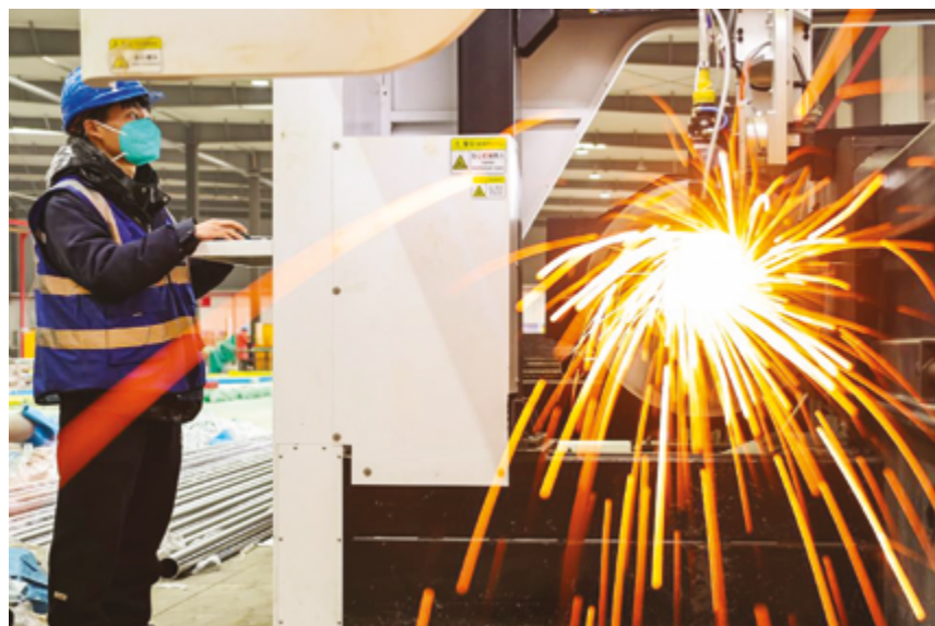
Работы идут в экономической зоне развития Джуронг, провинция Цзянсу

явил он, сославшись на импульс, создаваемый новыми качественными производительными силами, ускоренное построение новой парадигмы развития и