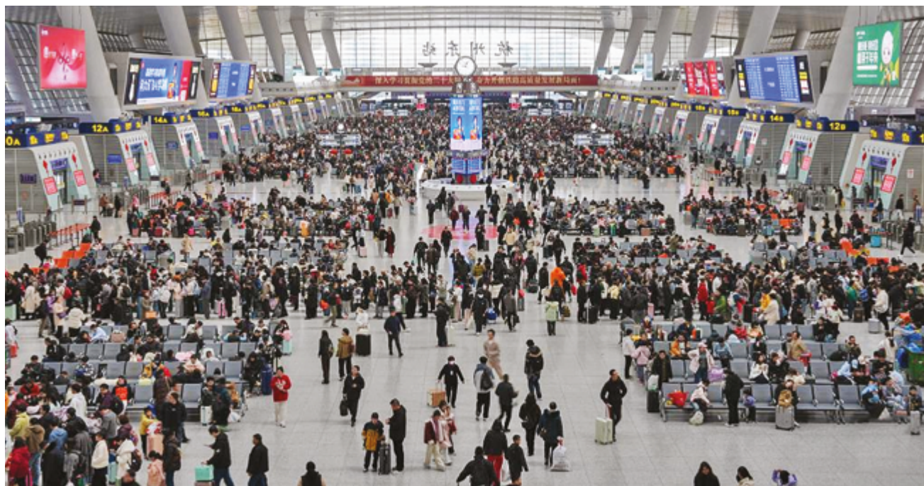
Восточный железнодорожный вокзал Ханчжоу, провинция Чжэцзян, 23 февраля 2026 г.

Будучи второй экономикой мира, Китай оказывает важное влияние на другие страны, аналитики которых внимательно следят за экономическими показателями КНР. Каких результатов удалось добиться Поднебесной с начала текущего года, расскажем здесь.