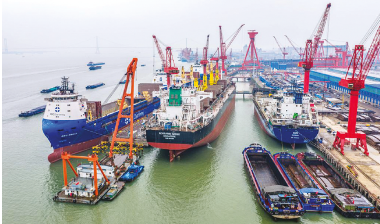
Строящийся корабль на верфи Taizhou Sanfu Shipbuilding Engineering, Тайчжоу, провинция Цзянсу