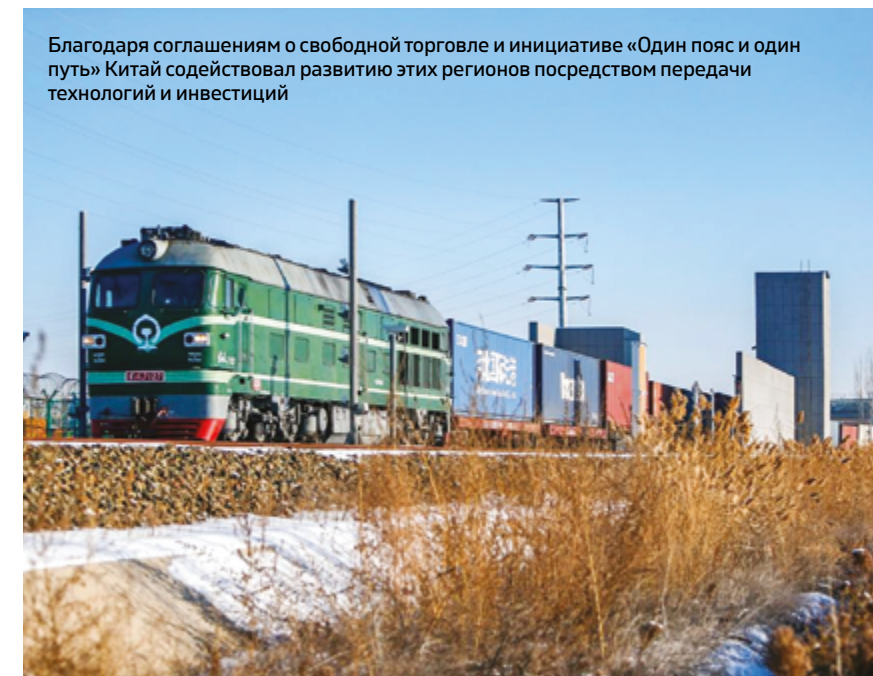
Благодаря соглашениям о свободной торговле и инициативе «Один пояс и один путь» Китай содействовал развитию этих регионов посредством передачи технологий и инвестиций

мического роста, эксперт подчеркнул ответственную роль Китая в глобальном управлении, которая создает новые возможности для Азии, Латинской Америки и Африки.