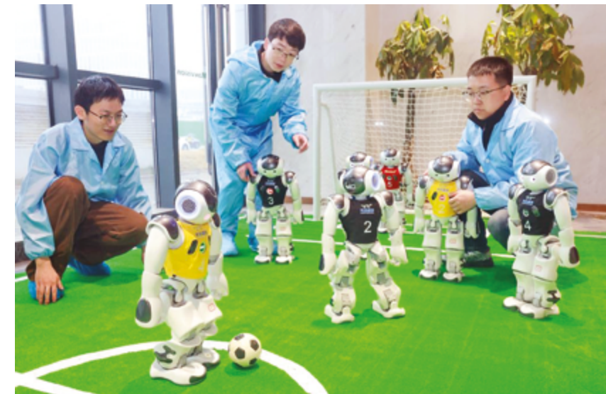
Система роботизированного футбольного поля от компании Hubei Guanggu Shengchuang Technology, Ухань, провинция Хубэй

Представитель Национального бюро статистики отметил, что экономика по-прежнему сталкивается с проблемами, поскольку геополитические риски растут, а