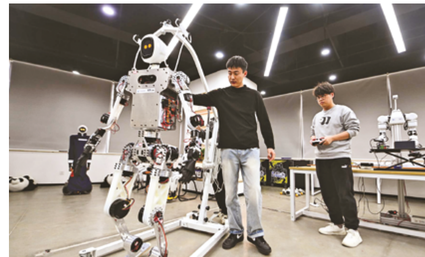
Тестирование робота-манипулятора на предприятии в высокотехнологичной промышленной зоне Биньхай в Тяньцзине, Северный Китай, 27 февраля 2026 г.