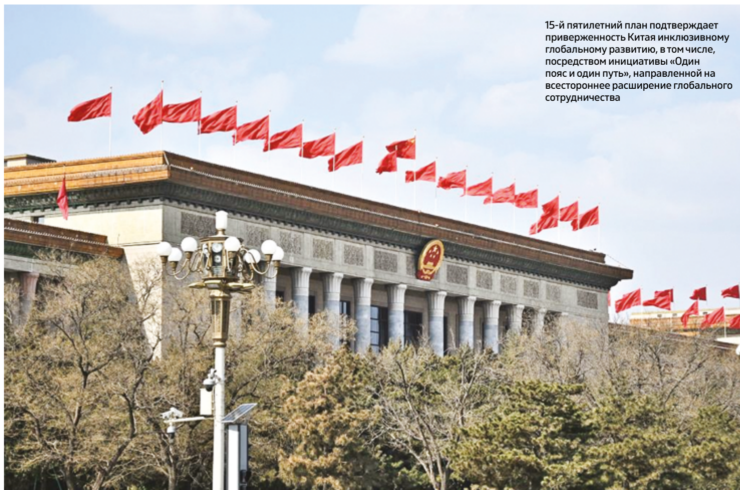
15-й пятилетний план подтверждает приверженность Китая инклюзивному глобальному развитию, в том числе, посредством инициативы «Один пояс и один путь», направленной на всестороннее расширение глобального сотрудничества