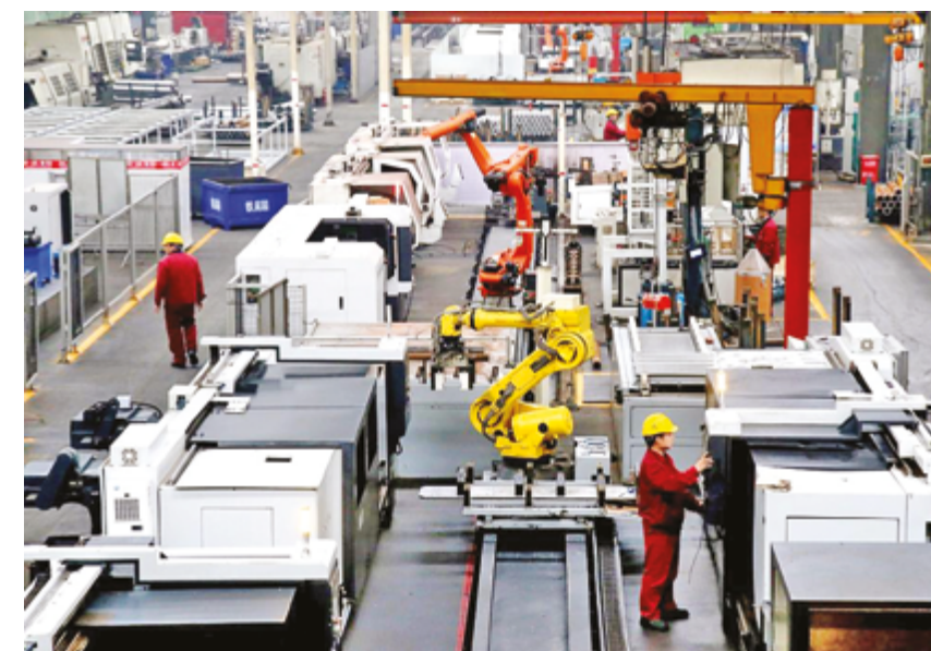
Завод компании Hubei Jiaheng Technology, город Шиянь, провинция Хубэй

По мнению спикера, экономика Китая сохранит устойчивый рост в предстоящий период, заложив прочную основу для достижения целевых показателей страны на весь год.