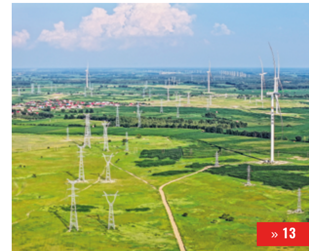
СОХРАНЯЯ ПРИРОДНЫЙ БАЛАНС