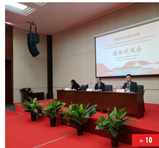
«ДВЕ СЕССИИ» КАК СВЯЗУЮЩЕЕ ЗВЕНО МЕЖДУ ОБЩЕНАЦИОНАЛЬНЫМИ ПРИОРИТЕТАМИ И ЧАЯНИЯМИ НАРОДА