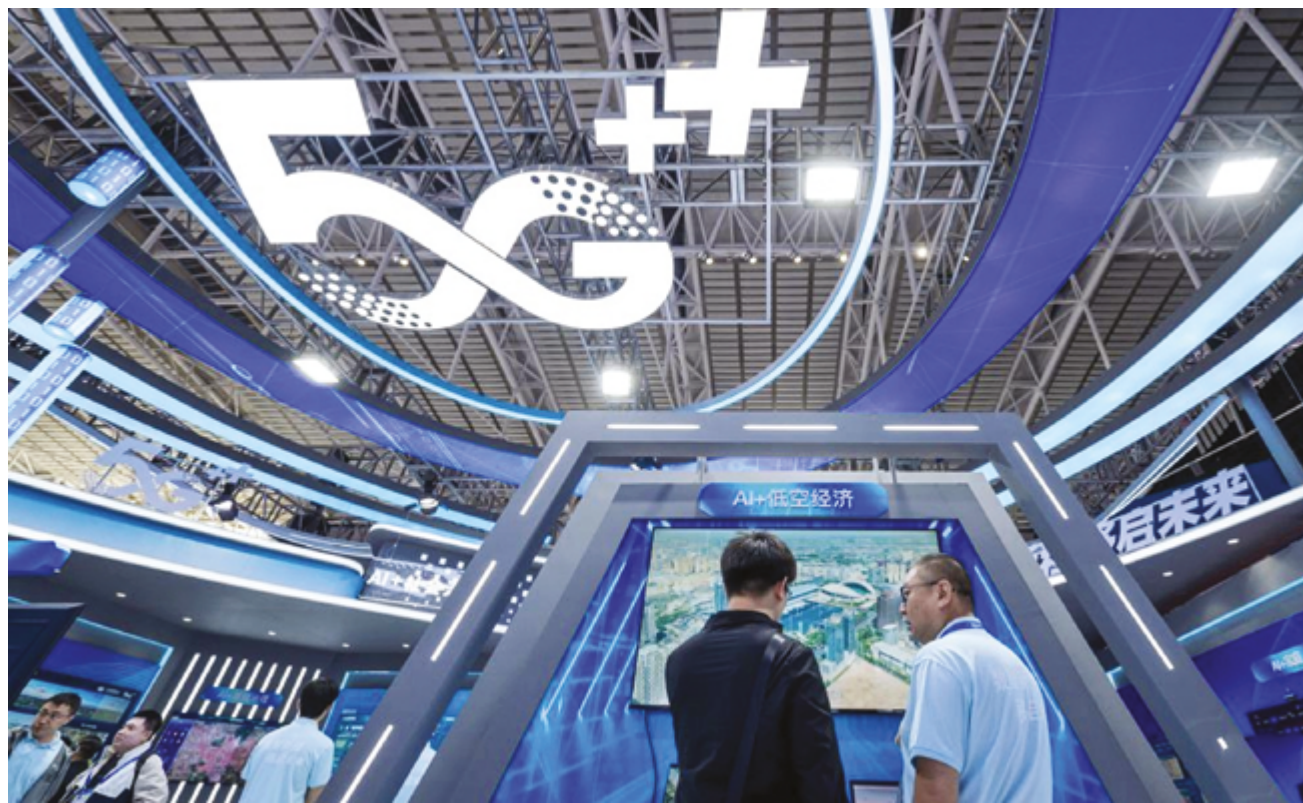
Посетители Харбинской международной экономической и торговой ярмарки в Харбине, провинция Хэйлунцзян на северо-востоке Китая, 19 мая 2025 г.

Новейшие инновационные решения, значительное внимание которым было уделено в ходе обсуждений на полях «двух сессий» текущего года, учитывая прогресс искусственного интеллекта (ИИ), интерфейсов «мозг-компьютер» и мобильной связи 6G, призваны обеспечить высококачественное развитие Китая на новом этапе.