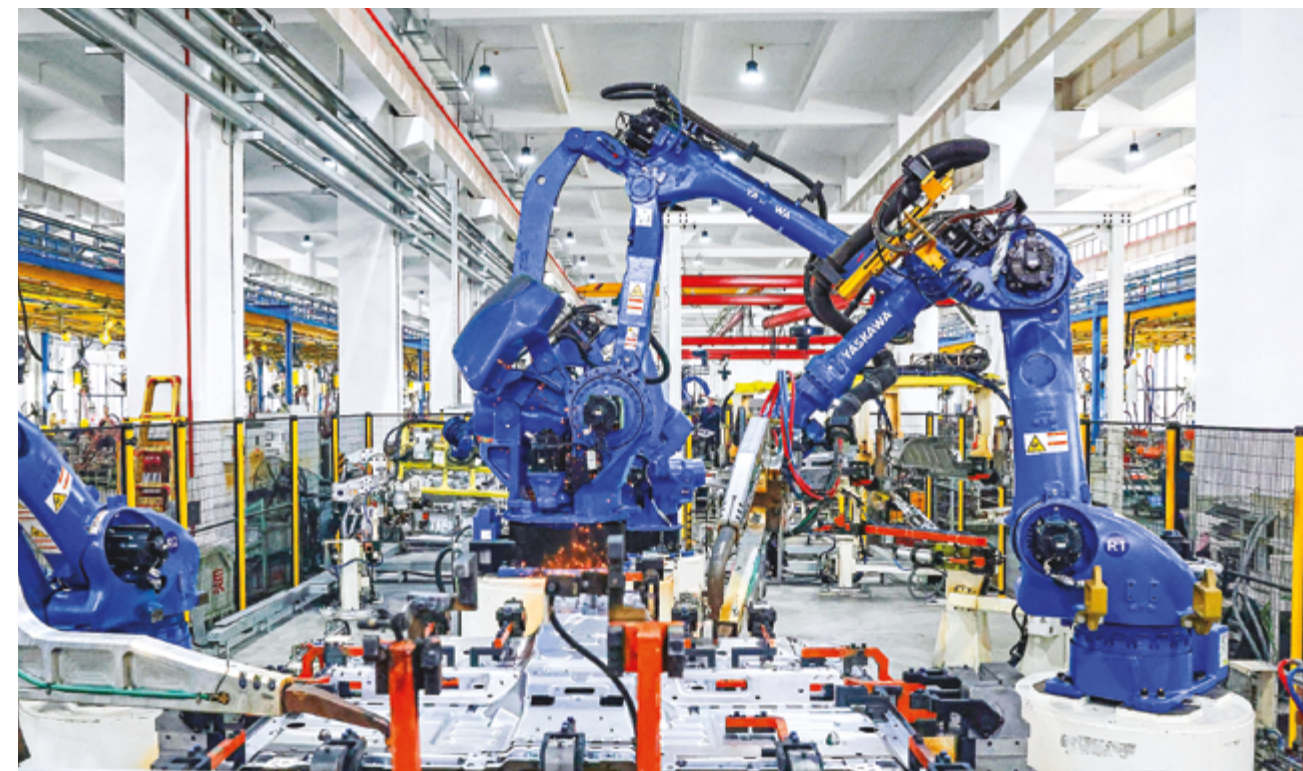
Роботизированная производственная линия сварочного цеха компании Hongquan Industrial Co., Ltd. в городе Янчжоу, провинция Цзянсу

дарственной политики: выпуск специальных облигаций стимулировал инвестиции в инфраструктуру, а рынок недвижимости демонстрирует признаки восстановления. Этому также способствует восстановление внутренней динамики: более высокий, чем ожидалось, экспорт и устойчивое восстановление цен помогли оживить инвестиции в обрабатывающую промышленность, а длинный праздничный период оказал дополнительную поддержку потребительским расходам, особенно в сфере услуг.