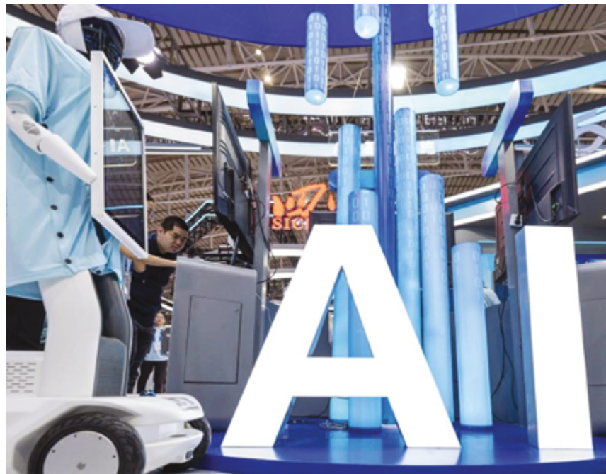
В рамках сотрудничества китайский искусственный интеллект находит активное применение во многих странах мира

Охарактеризовав возобновляемую энергию как «перспективную составляющую развития Китая», эксперт особо подчеркнул, что снижение себестоимости производства солнечной энергии сделало экологически чистой энергию более доступной для стран с низким уровнем дохода и создало возможности для долгосрочного успешного сотрудничества.