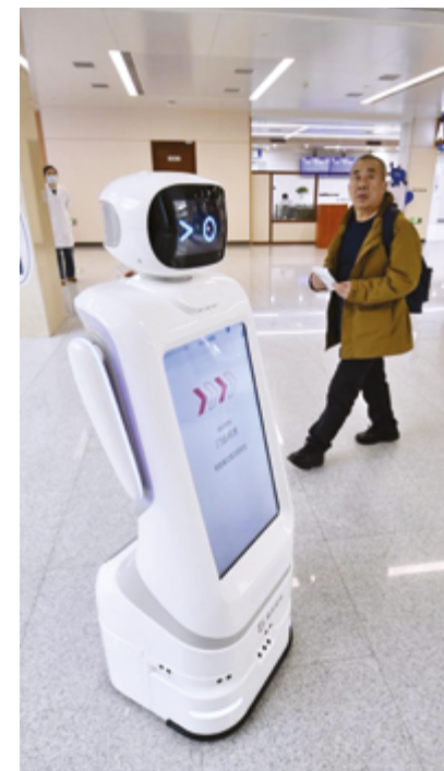
Развитие инноваций в Китае привело к повышению уровня жизни людей в стране

лено «новым качественным производственным силам», а также научному прогрессу, модернизации промышленности и долгосрочному развитию. Он подчеркнул, что план отражает точку зрения, согласно которой долго-