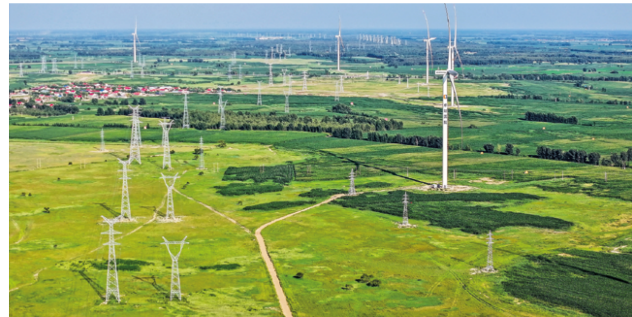
Экологический кодекс Китая открывает новые возможности для сотрудничества в рамках международного сообщества

Согласно недавнему заявлению итальянского эксперта по экологической политике, Экологический кодекс Китая может открыть новые возможности для международного диалога и взаимного обучения.