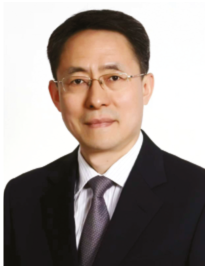
Хань Чуньлин, Чрезвычайный и Полномочный Посол КНР в РК

Китай открывает новые возможности – и для Казахстана тоже. Итоги «двух сессий» показывают, как будет развиваться сотрудничество и какие перспективы это создает для региона.