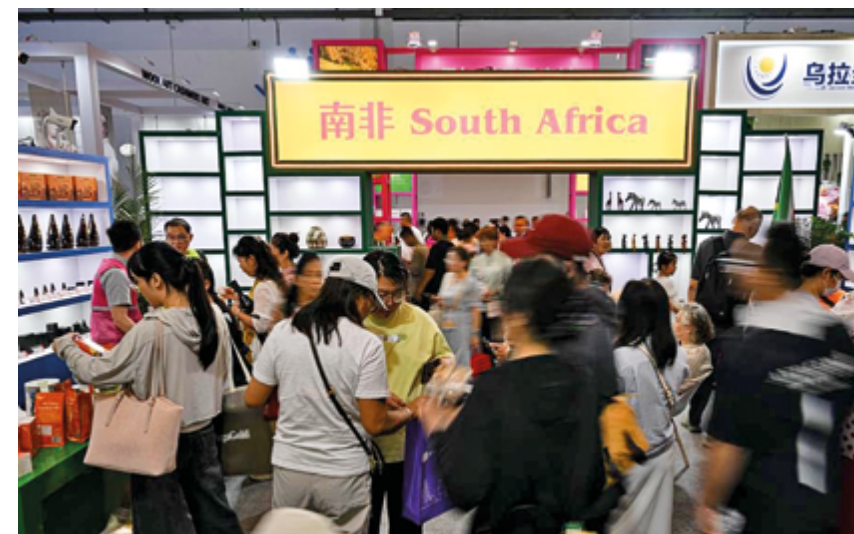
Павильон Южной Африки на 6-й Китайской международной выставке потребительских товаров, 16 апреля 2026 г.