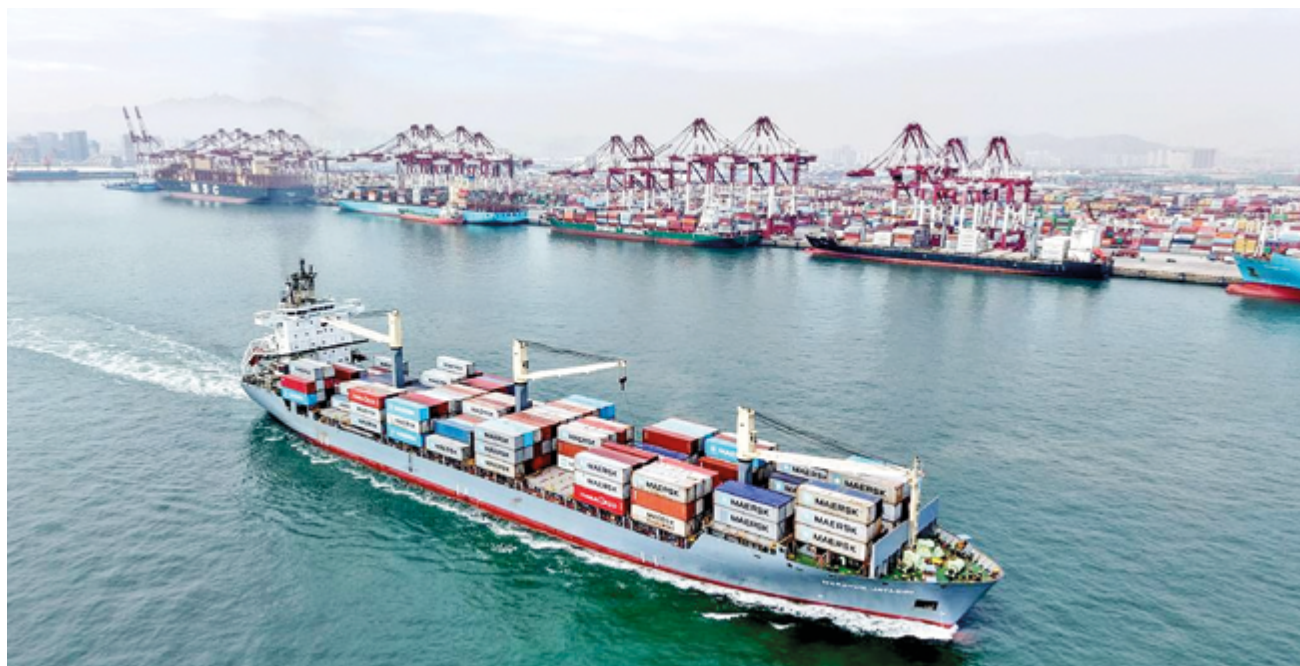
Сбалансированное развитие торговли Китая демонстрирует его твердую приверженность миру и стремление быть не только «мировой фабрикой», но и «мировым рынком»

В начале 2026 года внешняя торговля Китая продемонстрировала положительную динамику, что вылилось в уверенный двузначный рост в первом квартале. Это подчеркивает устойчивость экономики страны и укрепляет ее роль в качестве ключевого стабилизатора мировой экономики в условиях повсеместно наблюдаемой нестабильности.