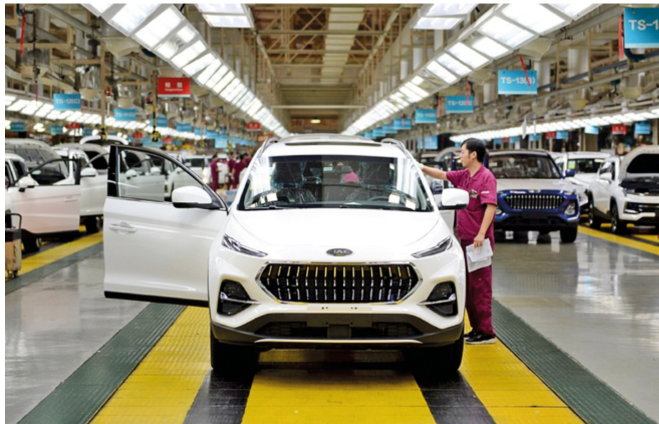
На внутреннем рынке КНР электромобили уверенно вышли в лидеры продаж

лизации. Недавно на 4-й сессии Всекитайского собрания народных представителей 14-го созыва приняли «Экологический кодекс КНР». Это означает, что охрана экологической среды в нашей стране вступила в эпоху «кодификации», и знаменует собой вступление строительства прекрасного Китая в новую стадию правового оформления. «Экологический кодекс» – второй закон Китая, в названии которого используется слово «кодекс». В его основе духовном стержне лежат идеи Си Цзиньпина об экологической цивилизации; ему отведена важная миссия по охране чистых вод и зеленых гор, и он закладывает прочную экологическую основу для великого возрождения китайской нации.