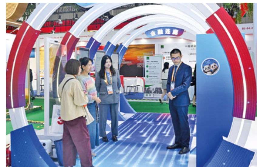
Интерактивные инсталляции на стенде Шанхайского банка развития Пудун в зоне выставки торговли услугами, 8-я Китайская международная выставка импорта (СІЕ) в Шанхае, 9 ноября 2025 г.

в том, что расширение сектора услуг в Китае происходит не за счет других государств, а, наоборот, открывает огромные общие возможности и выгоды для всего мира.