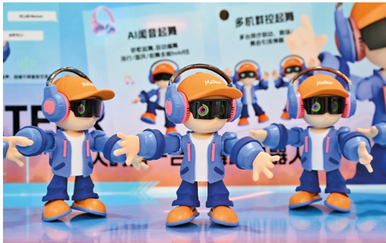
Настольные роботы-компаньоны с поддержкой искусственного интеллекта, CICPE-2026, Хайкоу, 14 апреля 2026 г.

Потребление товаров и услуг в сфере здравоохранения и «экономики впечатлений» также стали одними из главных тем