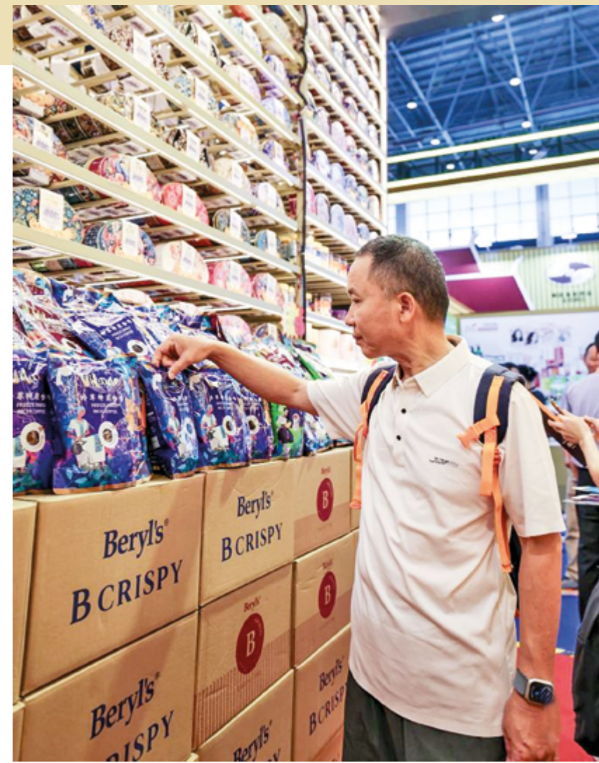
Посетители знакомятся с малайзийской кухней на 6-й Китайской международной выставке потребительских товаров, 15 апреля 2026 г.

Вице-премьер приветствовал активное использование глобальными предприятиями таких платформ, как SICPE, и призвал их углубить свое присутствие на китайском рынке, чтобы в полной мере воспользоваться возможностями для развития.