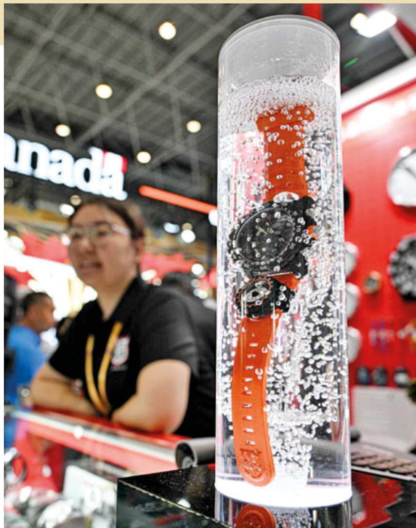
Часы на стенде швейцарской компании, представленные на SICPE-2026 в Хайкоу, 16 апреля 2026 г.

Напомним, что 18 декабря 2025 года на Хайнане был запущен общеостровной специаль-