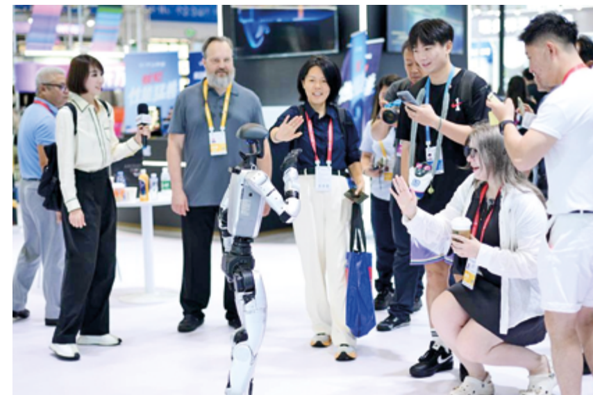
Посетители взаимодействуют с человекоподобным роботом компании Unitree Robotics, CISPE-2026, Хайкоу, 14 апреля 2026 г.

Недавно Китай запустил пилотную зону свободной торговли (ЗСТ) в северной части страны, что