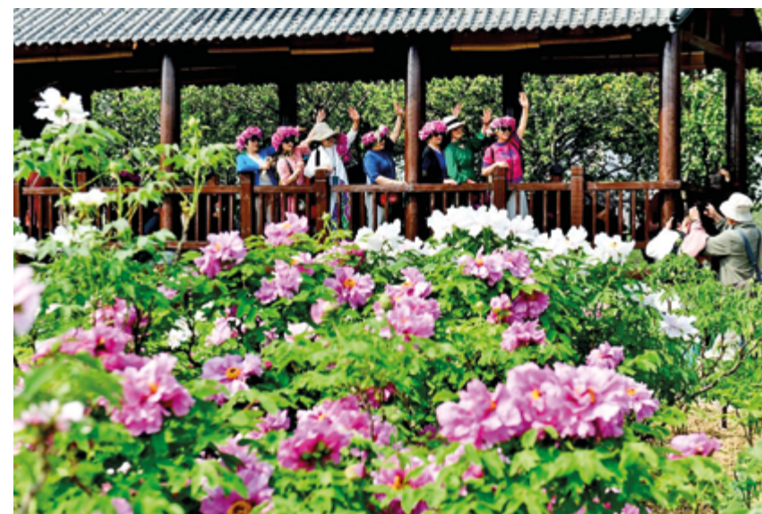
В период 15-й пятилетки яркой характеристикой китайской модернизации станет зеленое развитие

Придерживаясь принципа «общей, но дифференцированной ответственности», Китай выступает за учет интересов как климатического управления, так и права на развитие, активно отстаивая интересы широкого круга развивающихся стран. Китай решительно выступает про-