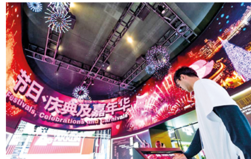
Голографическая проекция в выставочном зале «Торговля услугами» на 8-й Китайской международной выставке импорта (СІЕ) в Шанхае, 7 ноября 2025 г.

Впечатляющее развитие сектора услуг в КНР не могло не привлечь внимание всего мира. Как отмечают СМИ из разных стран, Китай, некогда крупный экспортер товаров, сейчас стремительно поднимается в мировом рейтинге ведущих экспортеров наукоем-