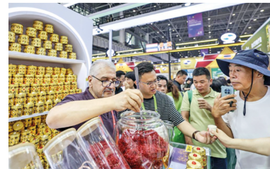
Посетители знакомятся с иранской продукцией на CICPE-2026 в Хайкоу, 15 апреля 2026 г.

Топ-менеджер также пояснила, что компания очень оптимистично оценивает потенциал