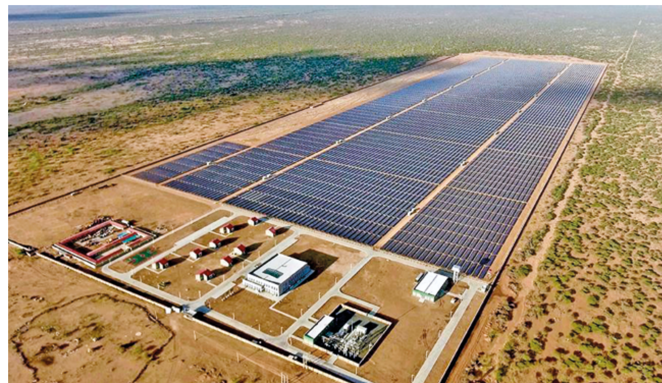
Построенная при участии Китая солнечная электростанция Garissa Solar в округе Гарисса, Кения

Китай – лидер в деле строительства экологической цивили-