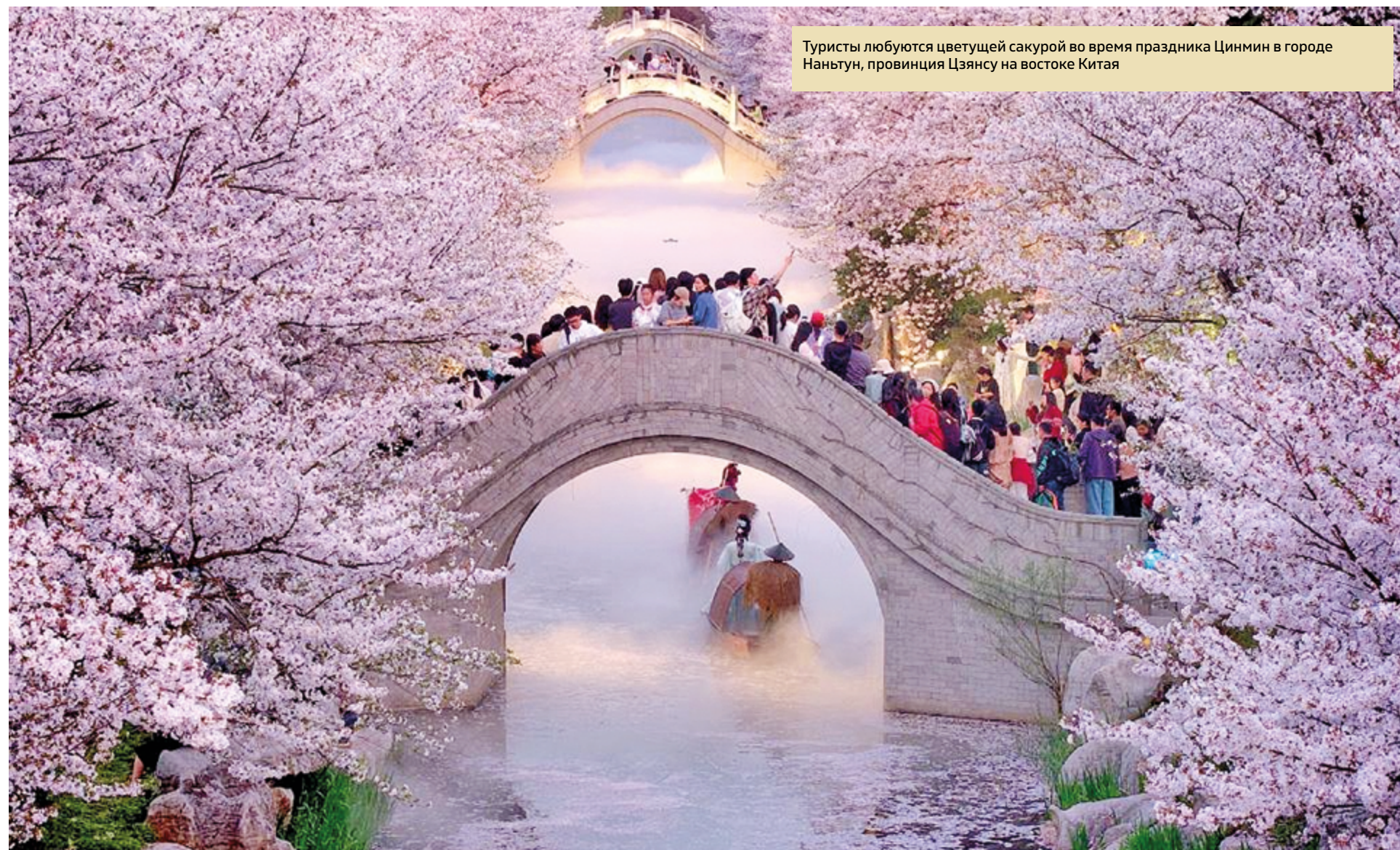
Туристы любят цветущую сакуру во время праздника Цинмин в городе Наньтун, провинция Цзянсу на востоке Китая

какой-то один цвет на свое усмотрение, а затем искать подходящие антураж и объекты для фотографирования. Полученные фото послужили отличной иллюстрацией для личных «весенних дневников».