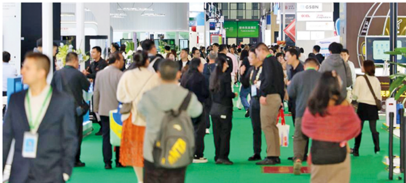
Выставочная зона торговли услугами на 8-й Китайской международной выставке импорта (СІЕ) в Шанхае, Восточный Китай, 9 ноября 2025 г.

Поставленная и с успехом реализованная цель китайского правительства по искоренению бедности в стране подтянула и показатели, которые как нельзя лучше демонстрируют победу на данном направлении. Одним из таких показателей, безусловно, являются качественные изменения в секторе услуг.