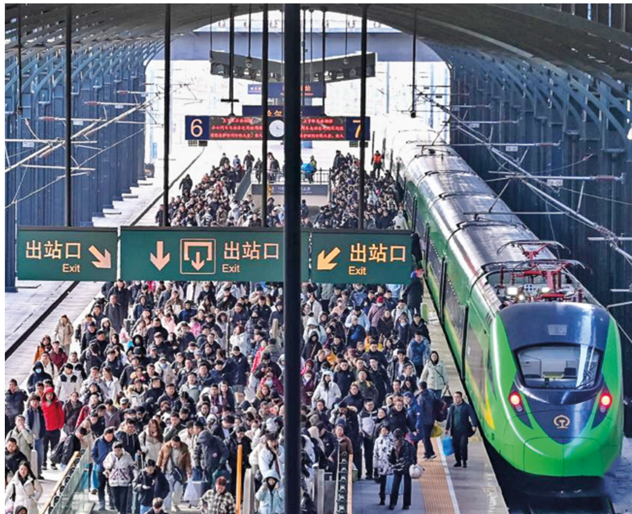
Экономические показатели Китая в первом квартале достигли впечатляющих результатов, в полной мере продемонстрировав высокую устойчивость национальной экономики

Финансовые аналитики из разных стран продолжают следить за динамикой экономических показателей Китая, понимая, что данный фактор играет существенную роль в «состоянии здоровья» всей мировой экономики.