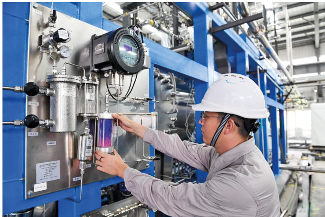
Оборудование для производства водорода, водородная энергетическая компания в Чанчуне, провинция Цзилинь на северо-востоке Китая

выглядит крайне впечатляюще. Будучи крупнейшей развивающейся страной в мире, Китай торжественно обещал международному сообществу достичь пика выбросов углерода до 2030 года и углеродной нейтральности до 2060 года, что демонстрирует чувство долга и ответственности крупной державы.