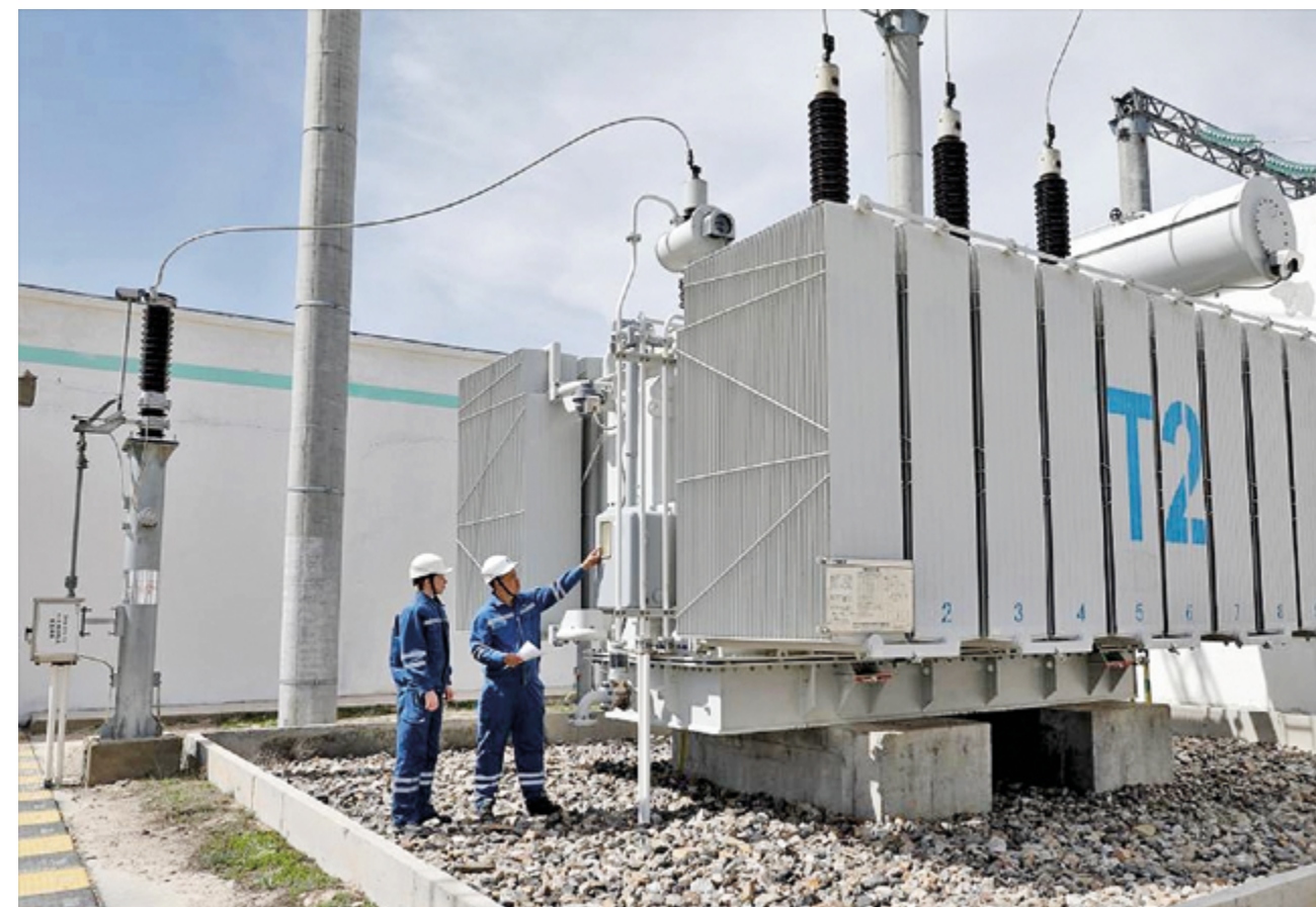
Оборудование силового трансформатора на казахстанской ветровой электростанции Жанатас, построенной при участии китайских партнеров

Китай неуклонно следует курсу высококачественного развития, отдавая приоритет экологии, а также зеленому и низкоуглеродному росту