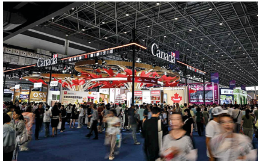
Оживление царит в национальном павильоне Канады, CICPE-2026, Хайкоу, 16 апреля 2026 г.