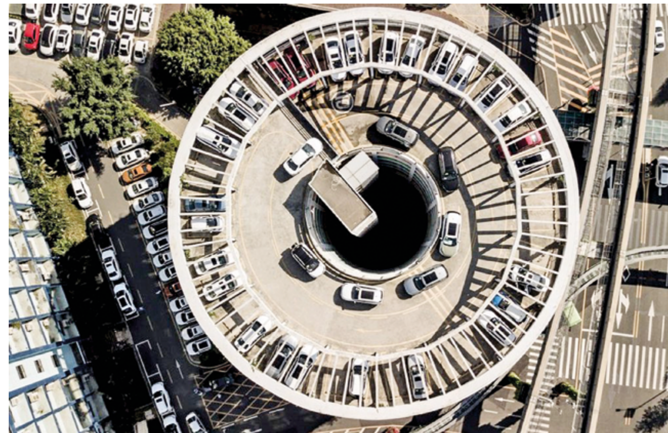
Зарядная башня для электромобилей в штаб-квартире BYD в Шэньчжэне, провинция Гуандун, Южный Китай

22 апреля Казахстан провел первый Региональный экологический саммит, который стал для стран важной платформой в деле консолидации консенсуса по вопросам зеленого развития и совместного обсуждения масштабных планов экологического управления, что отражает ответственность Казахстана в региональном и глобальном экологическом управлении. Китай и Казахстан, являясь участниками Рамочной конвенции ООН об изменении климата и других важных международных экологических соглашений, в последние годы реализуют разнообразное двустороннее и многостороннее сотрудничество и по праву могут