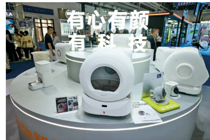
«Умные» товары для домашних животных, представленные на CISPE-2026 в Хайкоу, 14 апреля 2026 г.