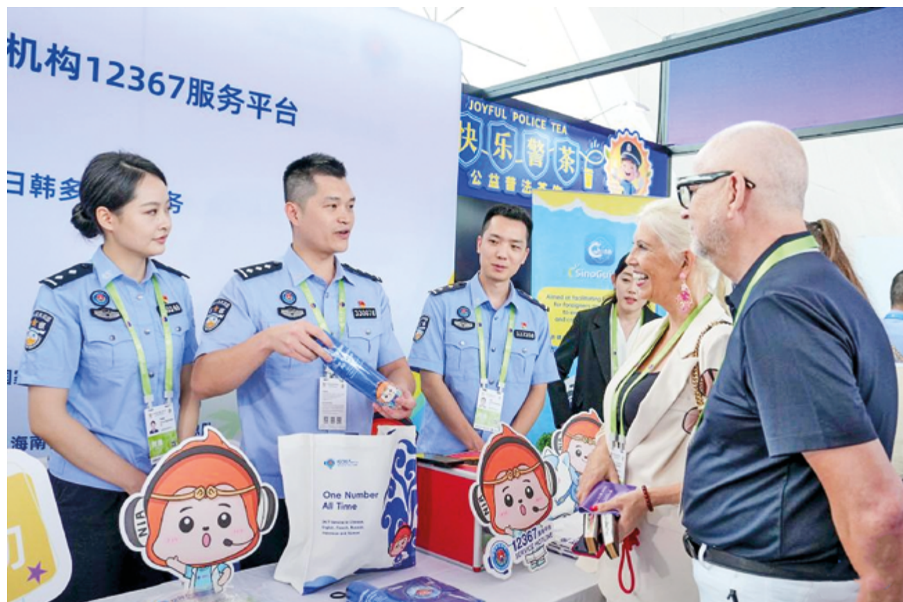
На главной площадке CISPE-2026 сотрудники пограничного пункта Хайкоу представляют иностранным участникам платформу обслуживания и политику упрощения процедур иммиграционного контроля на острове Хайнань, 15 апреля 2026 г.

В середине апреля в Хайкоу, столице южнокитайской провинции Хайнань, состоялась 6-я Китайская международная выставка потребительских товаров (CISPE). Она стала масштабным событием, в полной мере продемонстрировав возможности свободного торгового порта Хайнань (FTP) после его полного запуска в декабре прошлого года в масштабах всего острова.