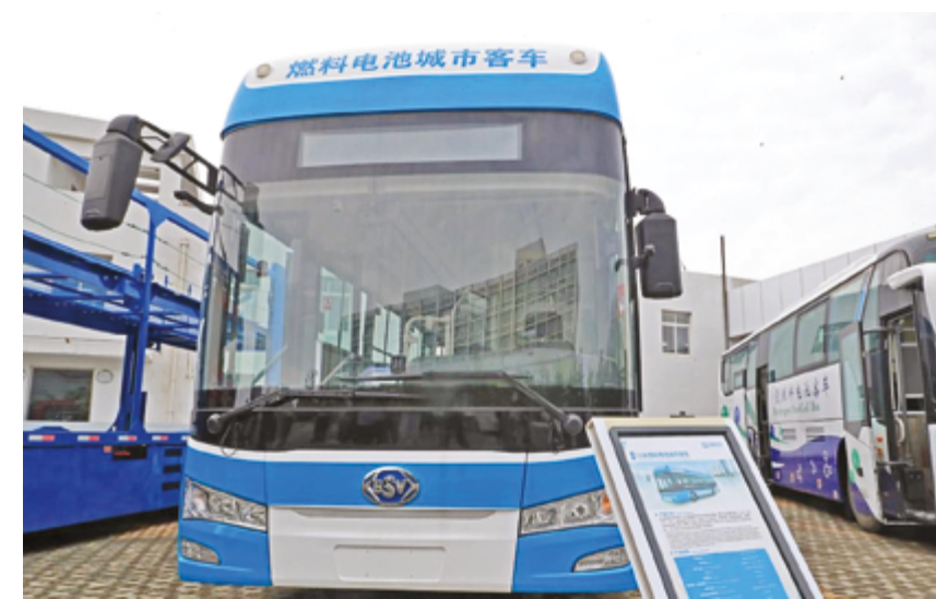
Автобус на топливных элементах в Mixwell Technology (Dalian) Co., Ltd. в Даляне, провинция Ляонин на северо-востоке Китая

По мнению Тянь Си, профессора Школы экономики и менеджмента Наньчанского университета, от систематического внедрения комплексного «зеленого» перехода в рамках «15-го пятилетнего плана» до четкого осуществления двойного контроля над общим объемом и интенсивностью выбросов углерода к 2026 году, эти меры представляют собой целостную и институционализированную политическую систему.