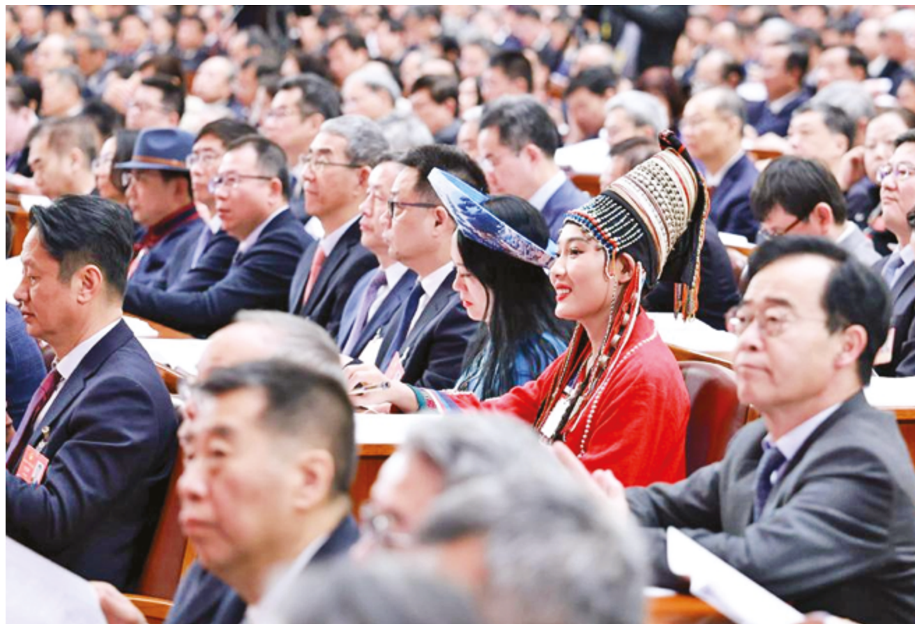
Молодые китайцы принимают активное участие в политической жизни страны

основанная на китайской классической литературе «Путешествие на Запад», стала мировым хитом,