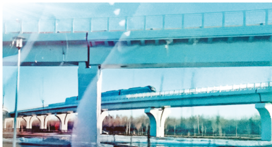
Саида ЖАРКИНОВА, фото автора

В середине текущего месяца в Астане заработал долгожданный ЛРТ. Среди первых, кто опробовал новый вид транспорта, были журналисты и блогеры. Во время пресс-тура нам показали, как работает система изнутри, и дали возможность проехать в современных составах с аэропорта до железнодорожного вокзала Нурлы Жол. Это 22,4 километра восторга от открывающихся красивых пейзажей города.