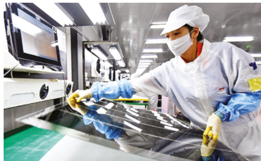
Производственный цех компании WG Tech, занимающейся производством оптоэлектроники, в городе Синьюй, провинция Цзянси, Восточный Китай

Контроль за вырабатываемой электроэнергией обеспечивается сертификатами на потребление экологически чистой электроэнергии на уровне часов, разработанными компанией State Grid Jiangxi Electric Power Co., Ltd., которые предоставляют экспортным предприятиям решение для снижения углеродного следа в рамках экологически чистой цепочки поставок, являющееся «отслеживаемым, проверяемым и заслуживающим доверия».