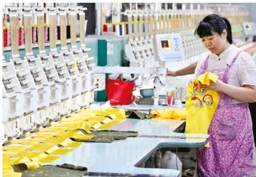
Вышивальное предприятие в уезде Цаосянь, провинция Шаньдун

В последние годы этот стиль переживает большой подъем благодаря всплеску интереса к традиционной культуре среди молодежи и растущей популярности в социальных сетях. Кстати, в Китае около половины платьев ханьфу производится именно в Цаосяне.