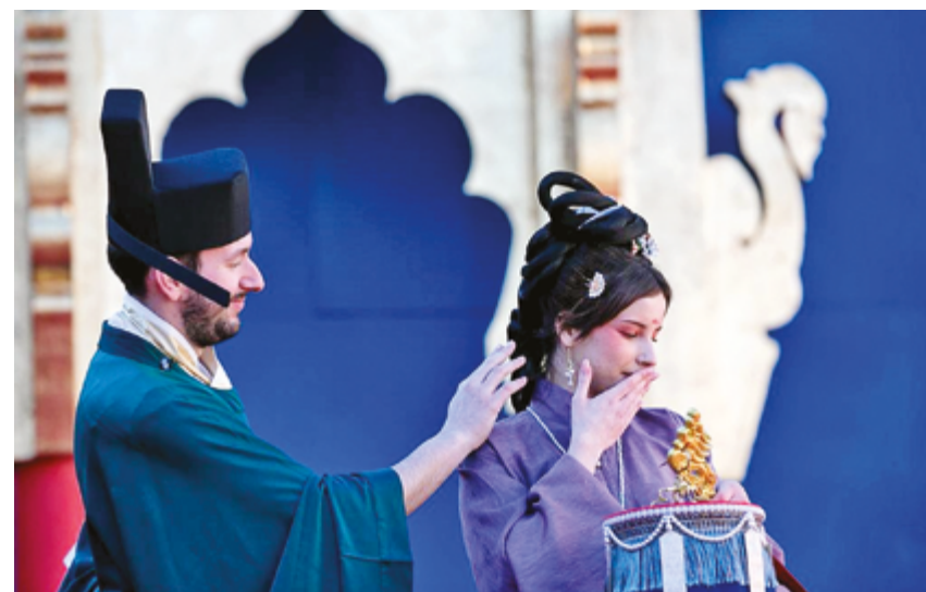
Демонстрация традиционной китайской одежды ханьфу на площади Сан-Марко в Венеции считается одним из главных событий карнавального сезона в Италии

Кроме того, предприятие запустило интеллектуальную систему дизайна «AI+ Hanfu», которая уже создала более тысячи уникальных узоров с использованием инновационных технологий.