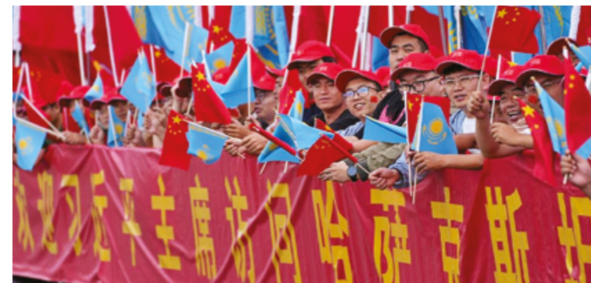
Основа китайско-казахстанских отношений – в народах, а будущее – в молодежи наших стран

Четвертое ключевое слово – «инновации». Инновации являются душой молодежи. Китай ускоряет развитие новых качественных производительных сил, и тенденция к тому, что молодежь берет на себя главную ответственность и играет ведущую роль, становится все более очевидной. Национальный научный фонд для выдающихся молодых ученых стал важной платформой для подготовки научно-технических талантов в Китае, где доля руководителей проектов в возрасте до 45 лет достигла 80%. На центральных государственных предприятиях создано более 67 000 молодежных ударных отрядов для выполнения неотложных, сложных, опасных, тяжелых