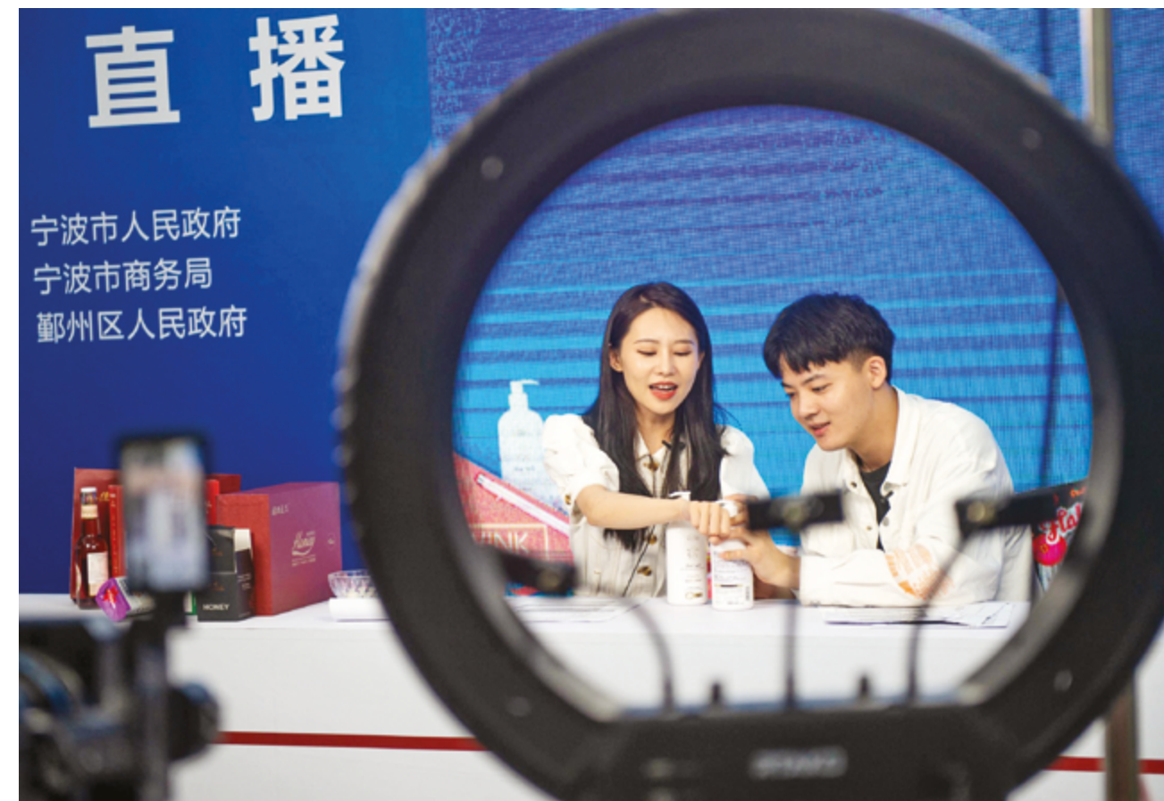
Новейшие технологии – область, где молодежь чувствует себя в своей стихии

Продемонстрировав несгибаемый дух, они оставили след в истории промышленности крупных держав, стремящихся к новым высотам. На арене чемпионата мира по профессиональному мастерству китайская молодежная команда одержала пять побед подряд в компетенции «Фрезерные работы на станках с ЧПУ», а также неоднократно завоевывала золотые медали в таких ключевых промышленных направлениях, как сварочное дело, своими техническими навыками помогая Китаю стать мощной производственной державой. На спортивных аренах