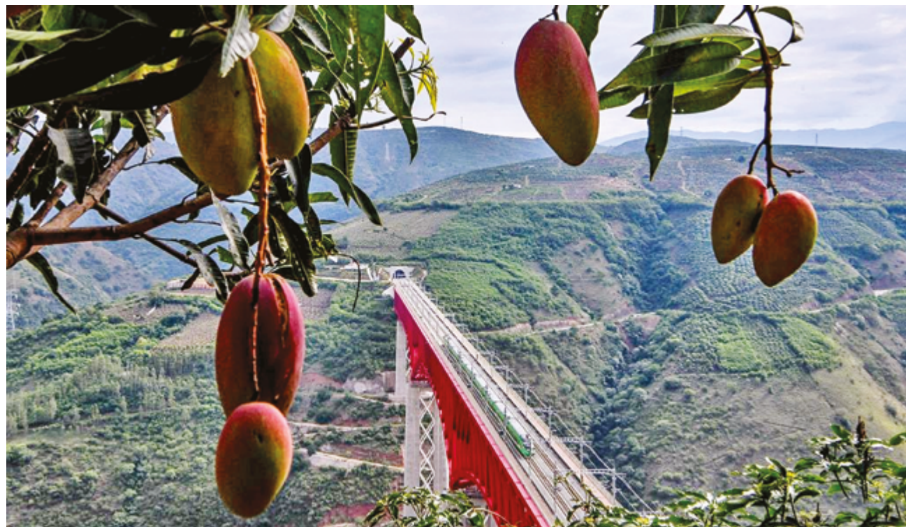
Для зарубежных инвесторов Китай сегодня предлагает не только доступ к рынку, но и участие в более широкой промышленной и инновационной экосистеме