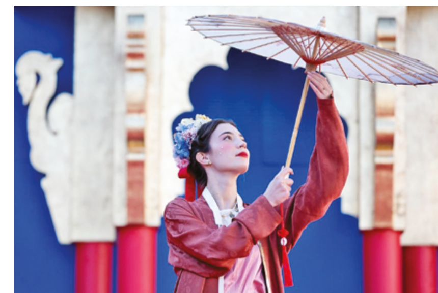
Девушка, одетая в ханьфу, на площади Сан-Марко в Венеции, Италия

Сегодня в Цаосяне, население которого составляет более 1,7 миллиона человек, расположено более 2800 предприятий, занимающихся производством ханьфу. Напрямую в них занято около 100 000 человек. Совокупный годовой объем онлайн- и офлайн-продаж ханьфу в округе в 2025 году превысил сумму в 13 миллиардов юаней. От проектирования до раскроя и создания выкроек, вышивки и печати, округ имеет полную производственную цепочку, охватывающую радиус в 5 километров.