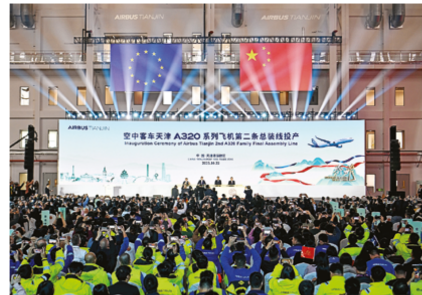
Церемония открытия второй линии окончательной сборки (FAL) самолетов семейства A320 компании Airbus в Тяньцзине, Северный Китай, 22 октября 2025 г.

«Мы назвали его SUDU, что в переводе с китайского языка означает «скорость», чтобы подчеркнуть, насколько эффективно