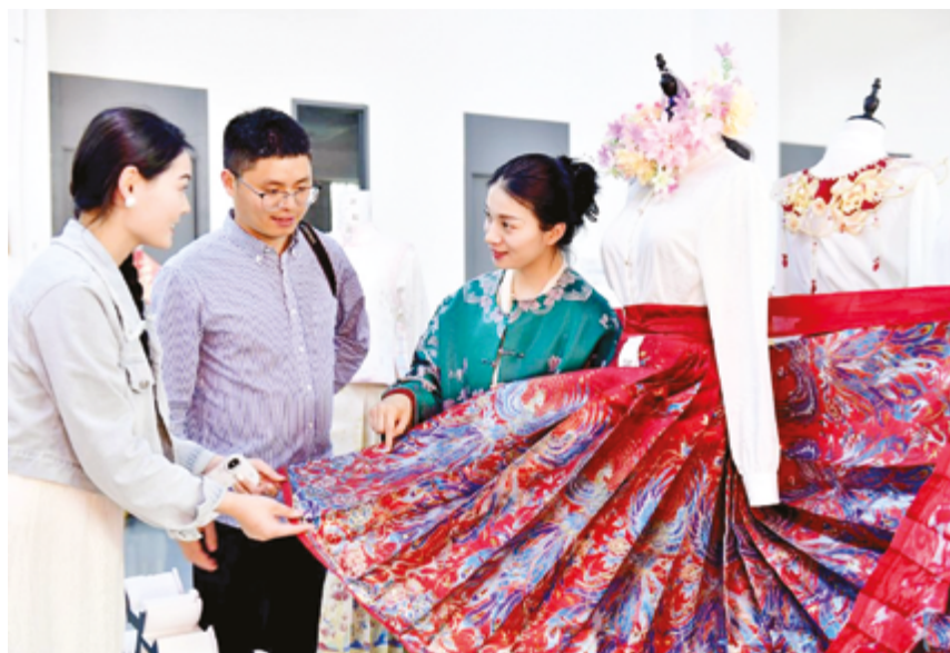
Предприятие по производству ханьфу в уезде Цаосянь города Хэцзе, провинция Шаньдун, Восточный Китай