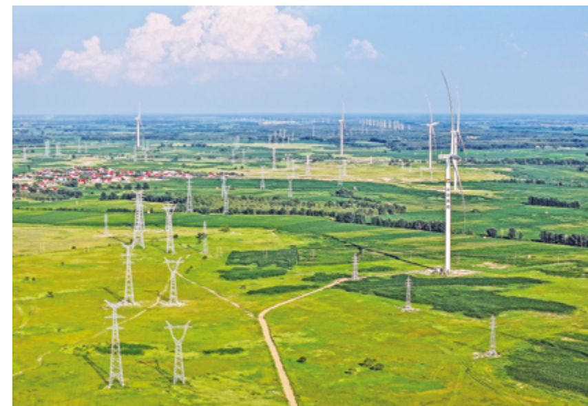
Ветряная электростанция в Тунляо, Автономный район Внутренняя Монголия в Китае

В последние годы компания WG Tech глубоко погрузилась в передовые технологии производства стеклянных подложек, инвестировав почти 2 миллиарда юаней (около 288,9 миллионов долларов) в исследования и раз-