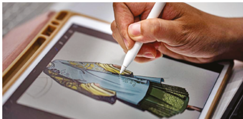
Дизайн-студия традиционной китайской одежды ханьфу в уезде Цаосянь, провинция Шаньдун

Бренд также сотрудничает с университетами для разработки техники ткачества парчи в античном стиле, стремясь успешно восстановить традиционные узоры с почти стопроцентной точностью.