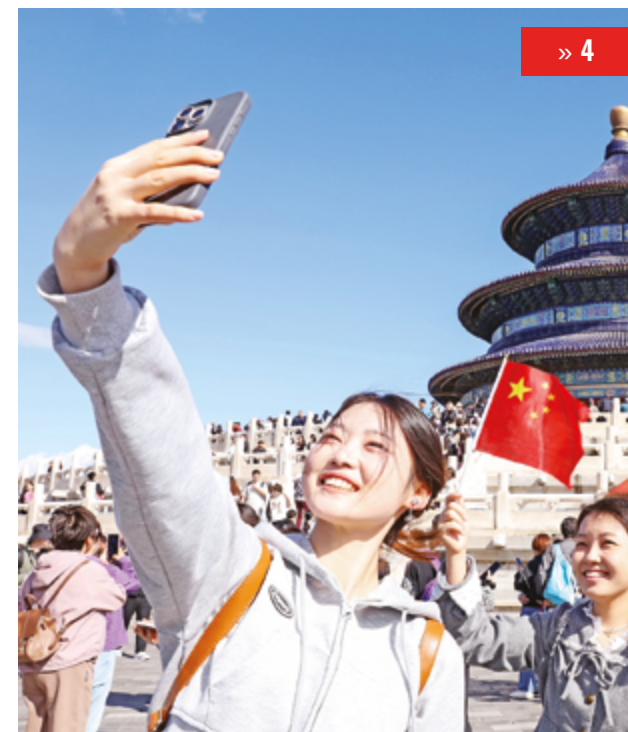
КИТАЙСКАЯ МОЛОДЕЖЬ В НОВУЮ ЭПОХУ