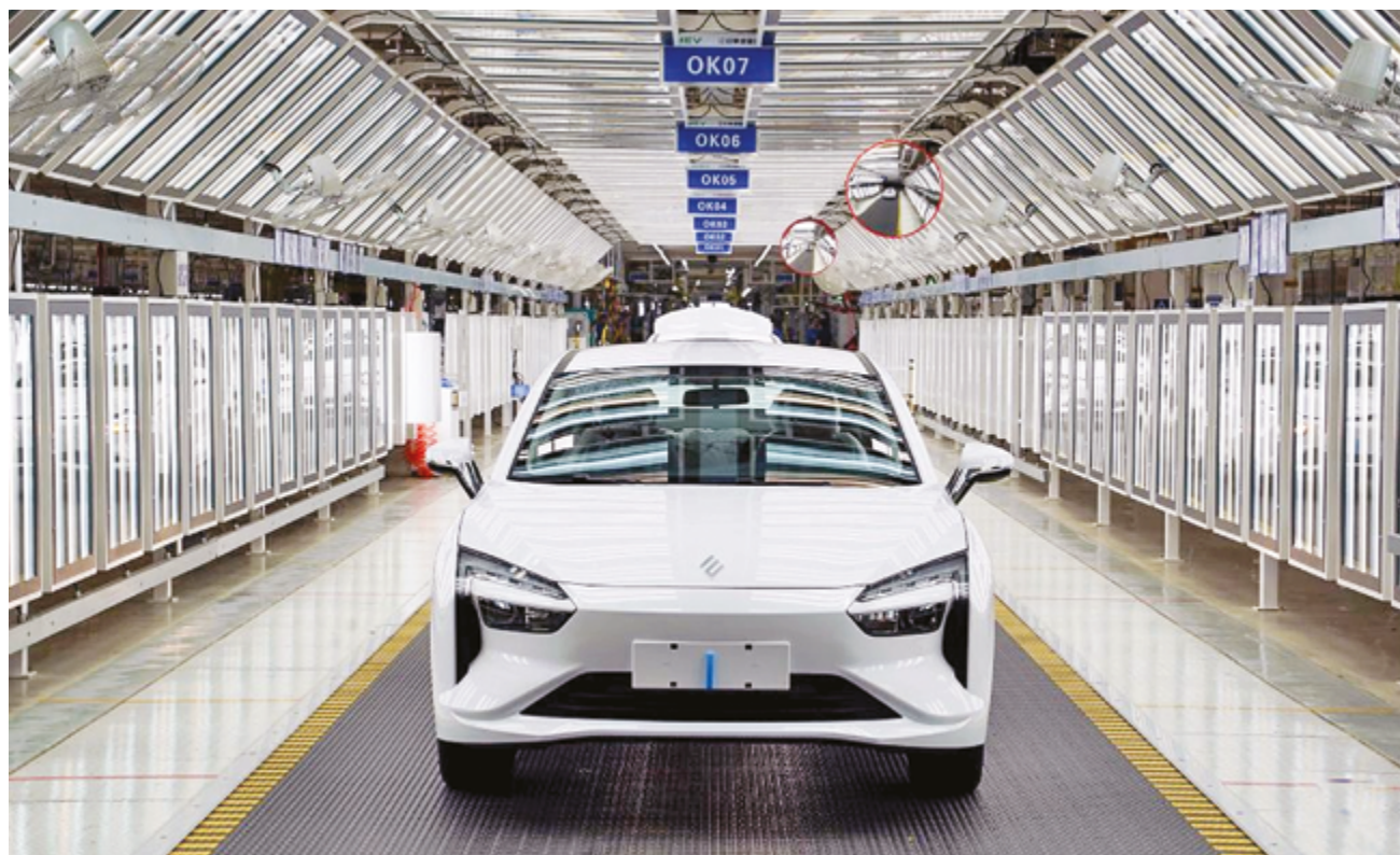
Производственная линия в цехе завода компании Jiangling Motors Co., Ltd. в городе Наньчан, провинция Цзянси, Восточный Китай

Начиная с четкого определения приоритетов в докладе правительства КНР за этот год по ускорению всеобъемлющего «зеленого» перехода и заканчивая конкретной целью, изложенной в плане 15-й пятилетки на 2026-2030 гг., – сокращением выбросов углекислого газа на единицу ВВП на 17 процентов, а также переходом к полному двойному контролю над общим объемом и интенсивностью выбросов углерода и содействием трансформации «зеленых» отраслей, Китай превращает «зеленый» и низкоуглеродный переход в новый двигатель высококачественного развития.