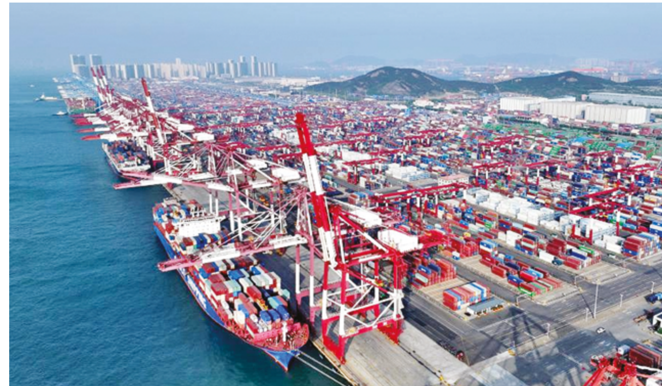
Масштабный рынок Китая и стабильность деловой обстановки продолжают поддерживать иностранные фирмы, работающие в стране

шлого года в Тяньцзине, северном китайском портовом городе, компания Airbus открыла вторую линию окончательной сборки самолетов семейства A320 в Китае – вторую подобную линию как в Китае, так и в Азии в целом. Это говорит о чем-то гораздо большем, чем просто выход на рынок. Для некоторых транснациональных корпораций Китай становится не только местом вложения капита-