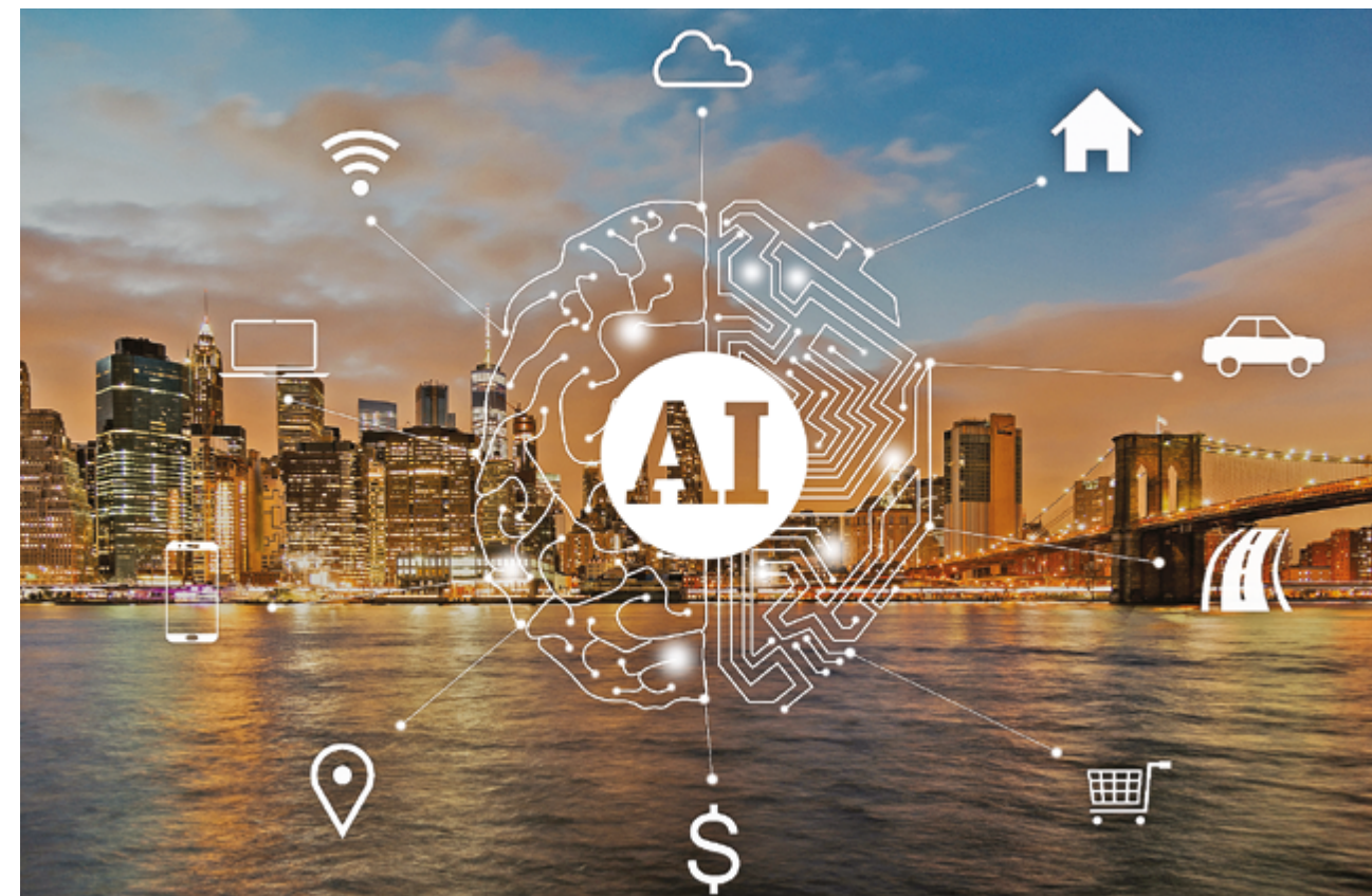
Искусственный интеллект сегодня превращается из простого инструмента в инфраструктуру предприятий

трансграничные инвестиции – это не просто перераспределение капитала, а в большей степени интеграция ресурсов, правил и возможностей. Он предложил компаниям, инвестирующим за рубежом, стать долгосрочными участниками, глубоко укоренившимися на местных рынках, и одновременно объединять глобальные ресурсы для достижения устойчивого развития посредством согласованности в работе.