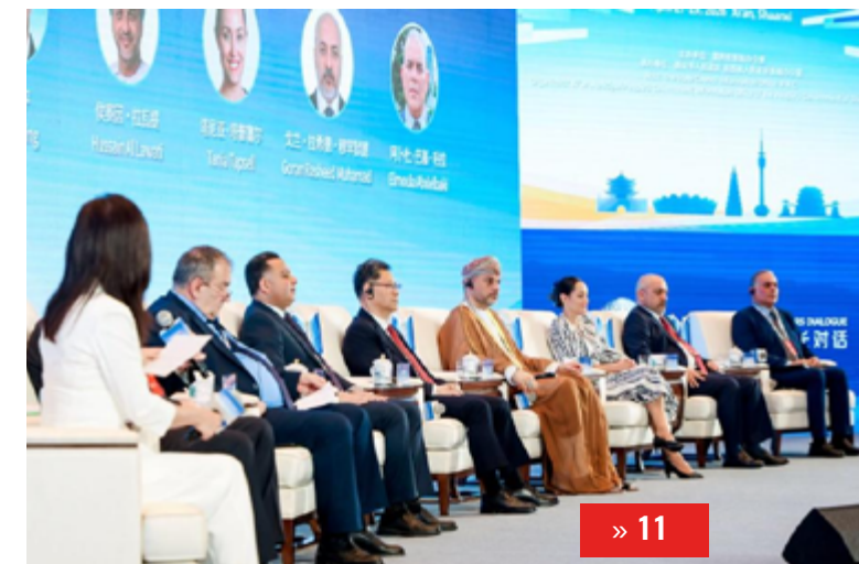
СОХРАНЯЯ КУЛЬТУРНОЕ НАСЛЕДИЕ

Периодичность: 1 раз в месяц Тираж: 5 тысяч экземпляров