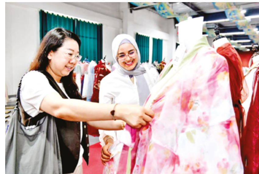
Участница учебного курса, организованного Китайским женским университетом, выбирает ханьфу в ателье по пошиву ханьфу в уезде Цаосянь, провинция Шаньдун