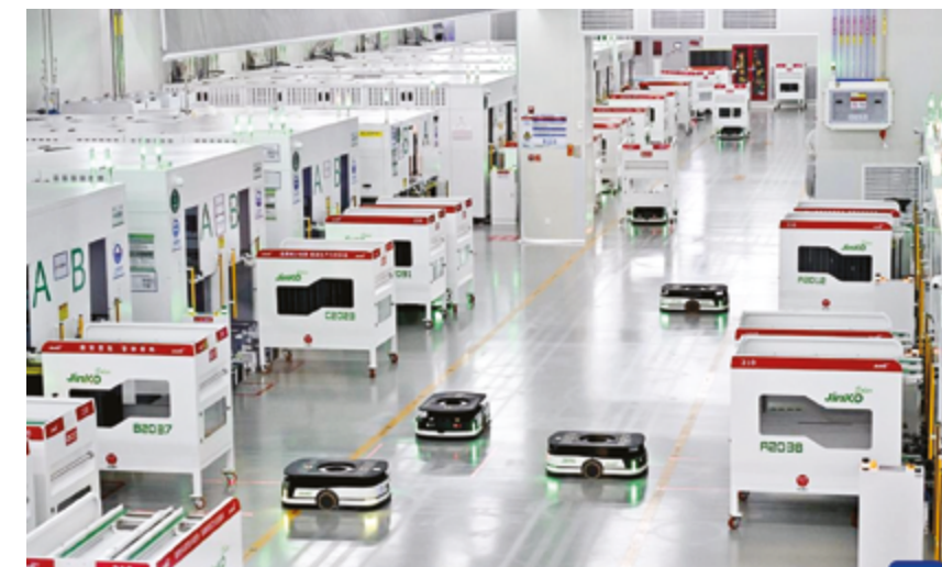
«Интеллектуальная мегафабрика» компании Jinko Solar Co., Ltd. в городе Шанграо, провинция Цзянси, Восточный Китай