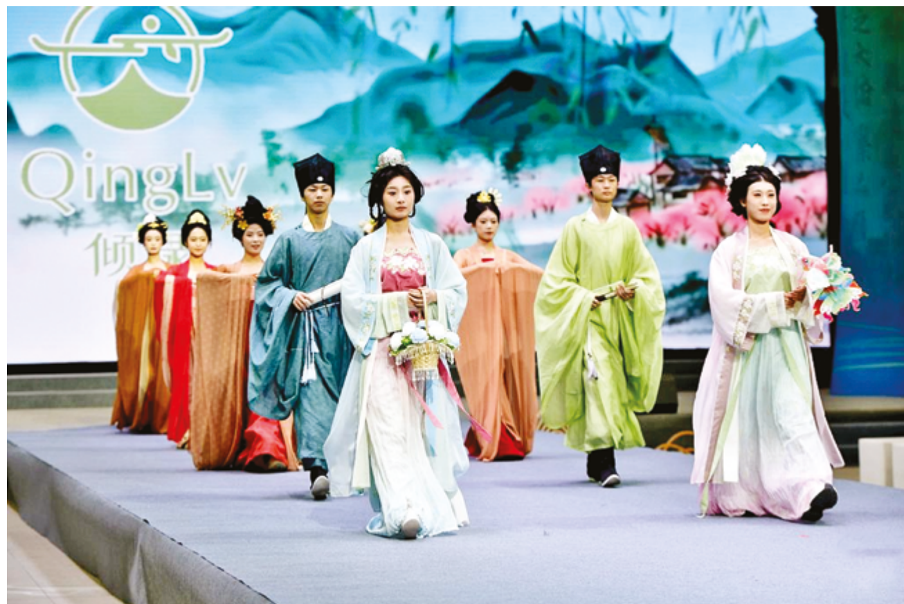
Презентация традиционного китайского костюма ханьфу в индустриальном парке цифровой экономики в уезде Цаосянь, провинция Шаньдун

Однако бурно развивающийся рынок также ставит ряд непростых задач, и тогда на передний план выходят инновации, становясь ключом к устойчивому успеху.