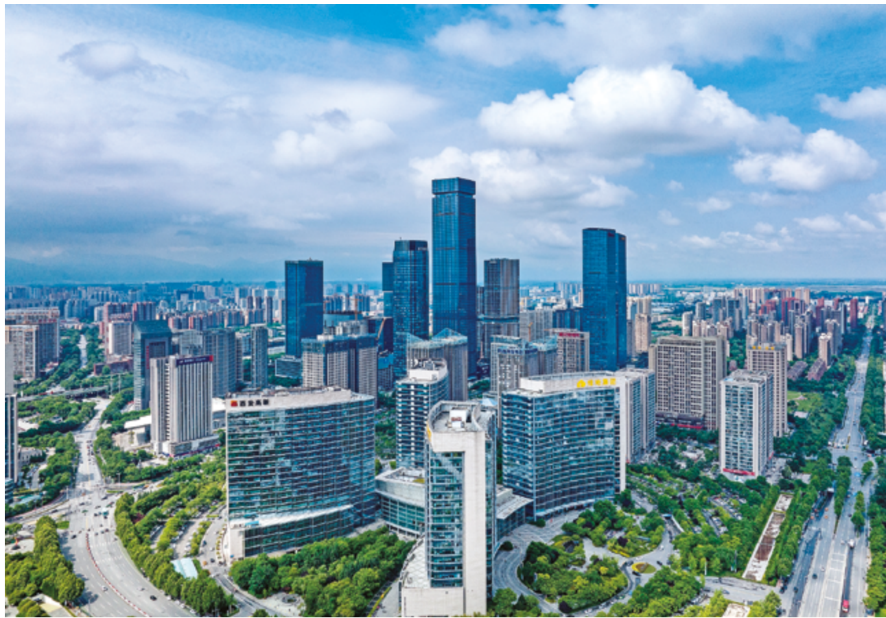
Зона развития высокотехнологичной промышленности в Сиане, провинция Шэньси, северо-запад Китая

На фоне усиливающейся неопределенности в мировой экономике многие транснациональные компании по-прежнему предпочитают расширять свое присутствие в Китае. Их привлекает сочетание факторов, которое трудно переоценить: хорошо развитая производственная цепочка, масштабный рынок и стабильная политическая обстановка, которая продолжает поддерживать иностранные инвестиции.