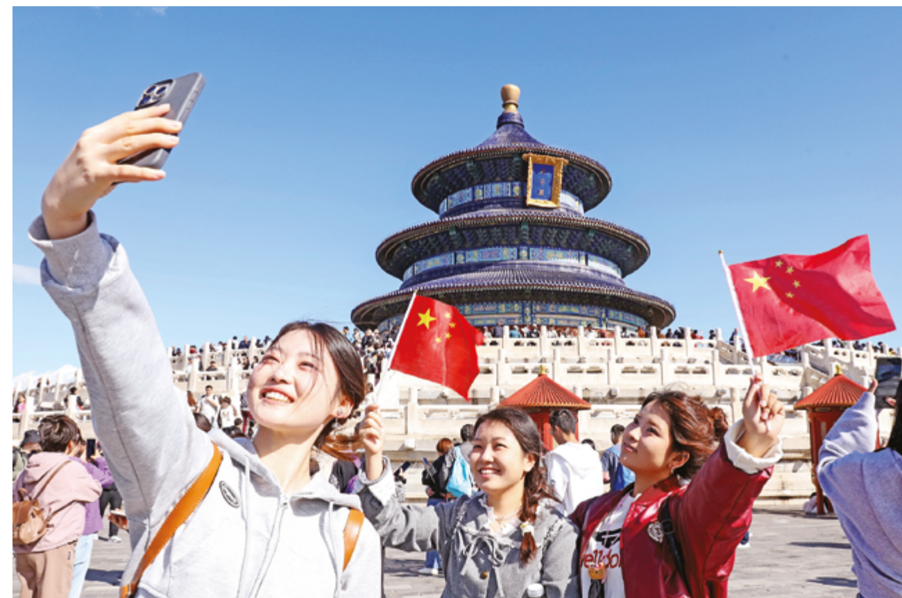
Вступив в новую эпоху, китайская молодежь уверенно принимает на себя ответственность, активно участвуя в процессе китайской модернизации

Второе ключевое слово – «ответственность». Ответственность является отличительной чертой китайской молодежи новой