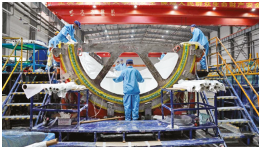
Производственная линия лопастей ветряных турбин на предприятии Chongtong Chengfei New Material Co., Ltd. в г. Даань, провинция Цзялинь на северо-востоке Китая

За последние пять лет продажи электромобилей компании Jiangling выросли с 10 000 до 123 600 автомобилей, а объем экспорта увеличился с 34 000 до 169 900 автомобилей, причем доля электромобилей в общем объеме экспорта превысила 30 процентов.