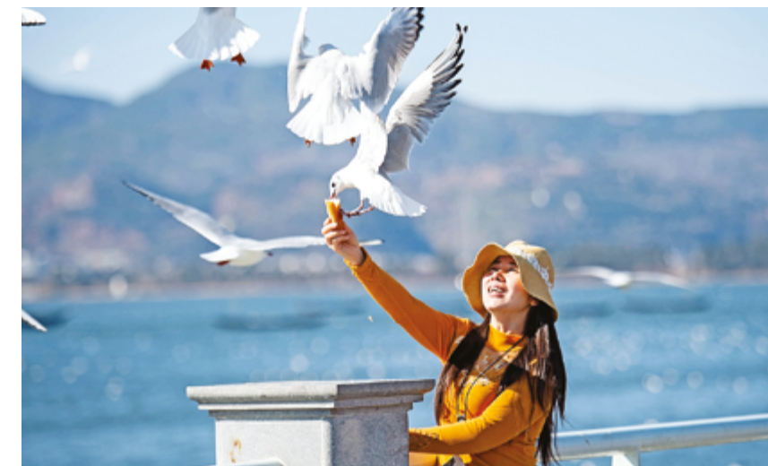
Идеалы выступают неиссякаемым источником силы для китайской молодежи в новую эпоху

установил рекорды кассовых сборов в истории кино. AAA-игра «Black Myth: Wukong»,