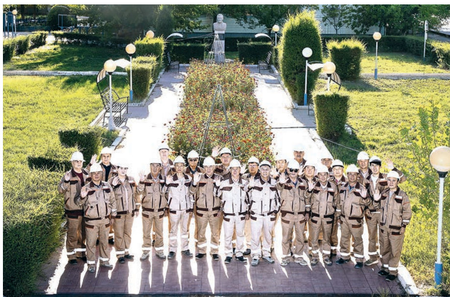
Татьяна БИРЮКОВА, фото из архива компании

Кумколь по праву можно назвать одной из «школ» казахстанской нефтянки – местом, где формировались кадры, накапливался практический опыт, отработывались технологические решения и выстраивались подходы к работе в сложных условиях приаральских Кызыл-кумов. Для многих специалистов именно здесь начинался профессиональный путь, который впоследствии продолжился на других крупных проектах страны.