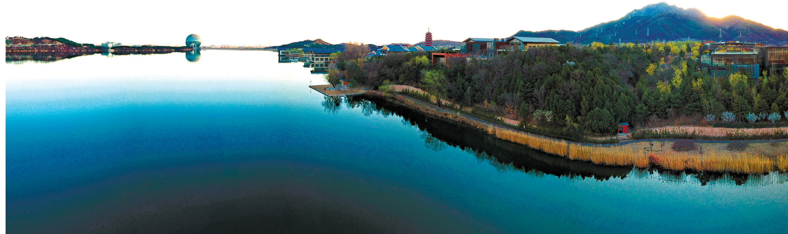
Вид с беспилотника на озеро Яньциху в Пекине.