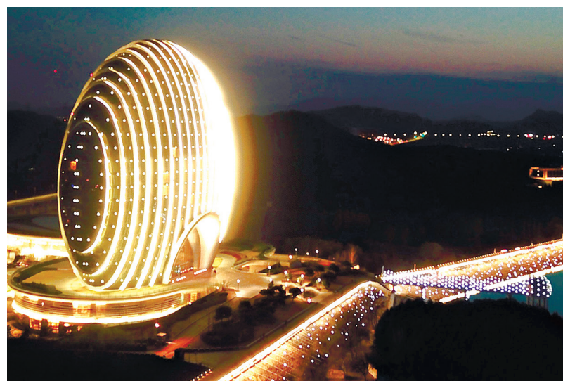
2-й Форум высокого уровня по международному сотрудничеству в рамках «Пояса и пути» прошел в Пекине 25-27 апреля 2019 года. На сделанном с беспилотника фото – отель Sunrise Kempinski на берегу озера Яньциху в Пекине.

Еще один вывод – наладить эффективные механизмы финансирования в рамках «Пояса и пути». Не все проекты на сегодня реализованы, но их актуальность возрастает с каждым годом. Важным является сопряжение китайской инициативы с Евразийским экономическим союзом, заключил эксперт.