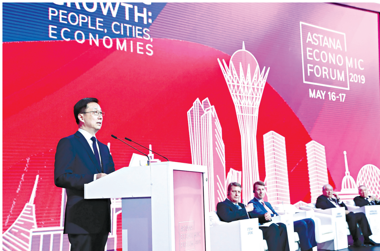
16 мая 2019 года. Член Постоянного комитета Политбюро ЦК КПК, вице-премьер Госсовета КНР Хань Чжэн принял участие в 12-м Астанинском экономическом форуме в Нур-Султане.

строй доставки товаров из КНР в Европейский союз через территорию Казахстана, транзитный потенциал открывает перед страной большие перспективы