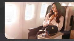
Luxury Amenity Kits