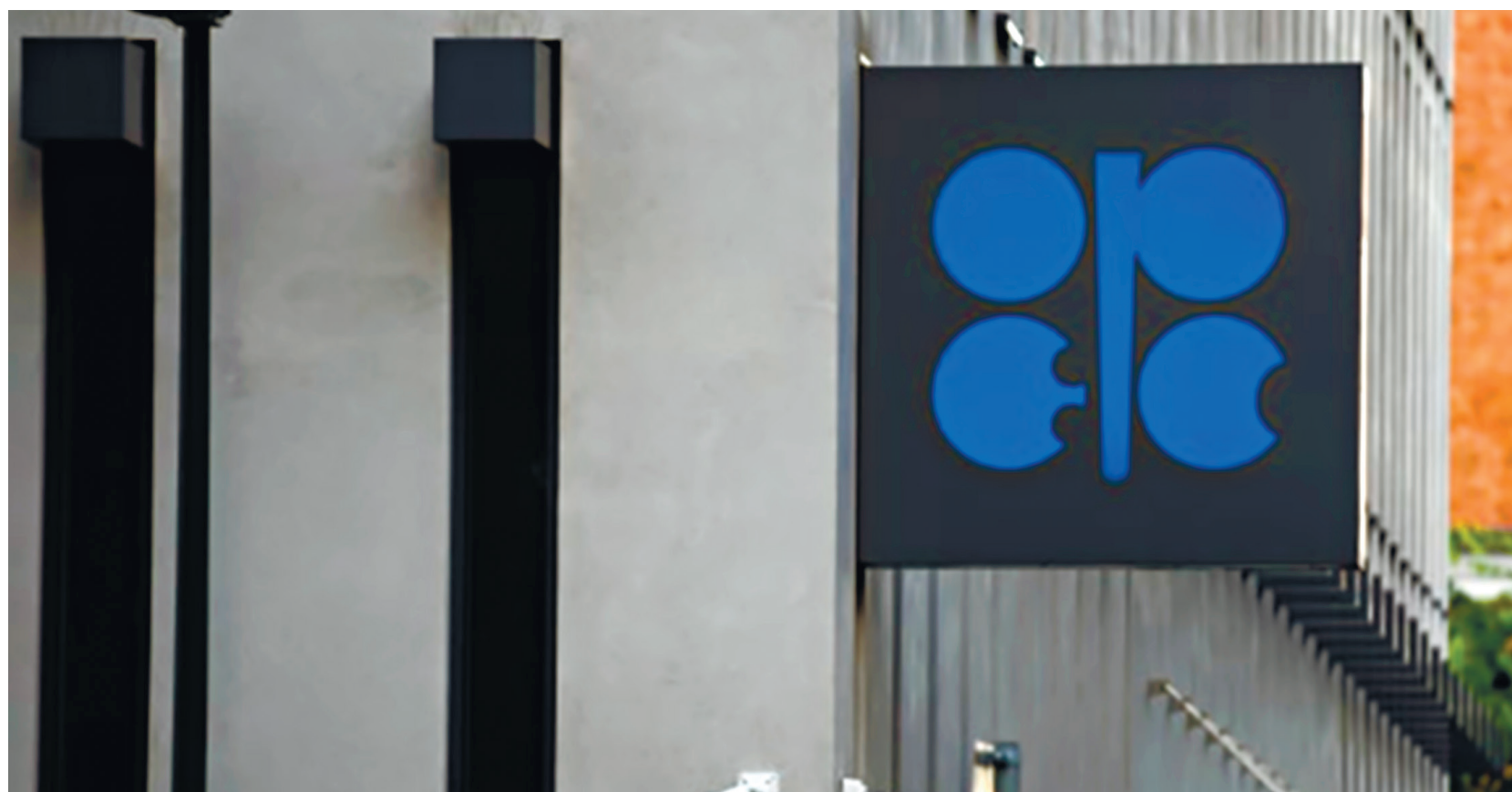
Логотип Организации стран – экспортеров нефти (ОПЕК) в штаб-квартире.