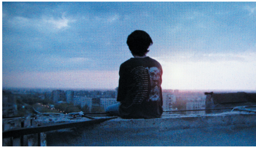
Кадр из фильма «18 килогерц»

Европы, а также считается одной из лучших площадок для встреч представителей кинематографа Восточной Европы». Фильм имеет шансы попасть в конкурсные программы FFG, при условии, если его продюсер или со-продюсер проживает в одной из бывших социалистических стран Европы, включая постсоветское пространство.