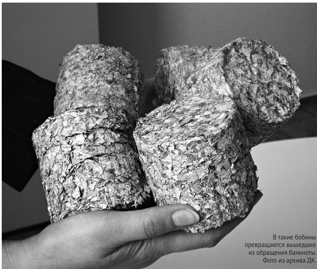
В такие бобины превращаются вышедшие из обращения банкноты.

Граждане страны смогут обменять банкноты на действующие денежные знаки национальной валюты в филиалах Национального банка после внесения соответствующих изменений в акты НБ РК. Информация по возобновлению обмена