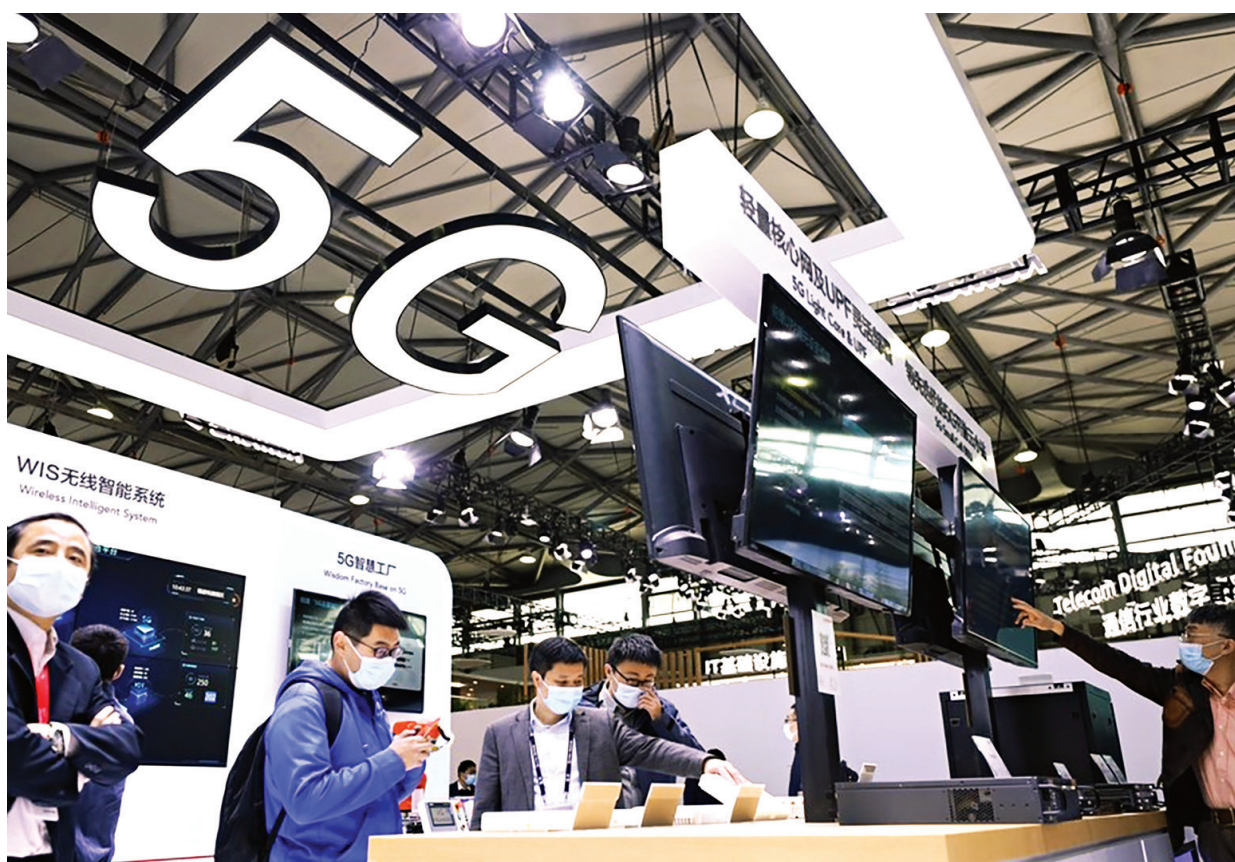
Всемирный мобильный конгресс (MWC) в Шанхае. Февраль, 2021 г.