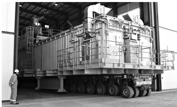
Наталья БУТЫРИНА, Мангистауская область

Разработанные модульные передвижные временные укрытия могут быть использованы на производственных объектах месторождения Кашаган в случае возникновения ЧС и в период проведения капитального ремонта. Конструкции подходят для использования как на море, так и на суше. Всего изготовлено три комплекта временных укрытий общим весом 843 тонны.