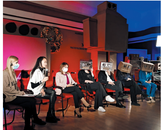
Представление группы ORTA