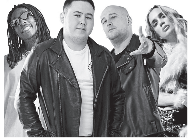
Сергей ГОРБУНОВ, Павлодар

На музыкальных сервисах опубликован новый хит Иманбека «Из обычного – только название».