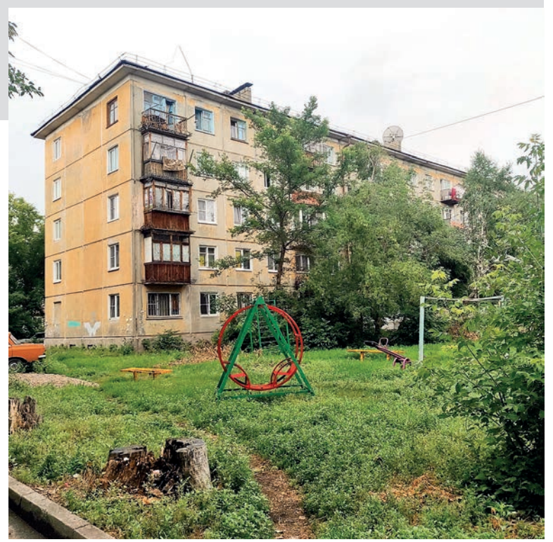
Типичные «хрущевки». Вряд ли они справятся с ОСИ

КСК проинформировали, что все же они могут проводить и эти работы, за счет эксплуатационных взносов, предлагая провести общее собрание, с утверждением повышенного тарифа... Причина