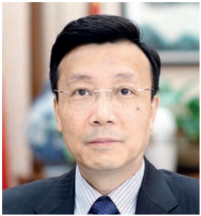
Чжан Сяо, Чрезвычайный и Полномочный Посол КНР в РК

За 31 год после установления дипломатических отношений между Китаем и Казахстаном две страны достигли скачкообразного развития в двухсторонних связях, статус которых был повышен до вечного всеобъемлющего стратегического партнерства. Неуклонно укрепляется политическое взаимное доверие двух сторон и углубляется взаимодействие в многообразных областях.