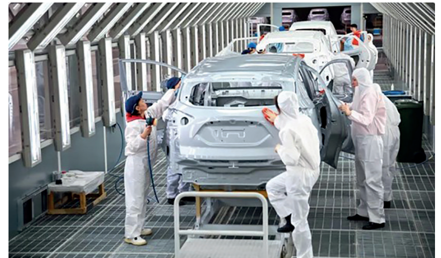
Цех китайской автомобильной компании JAC в Казахстане.