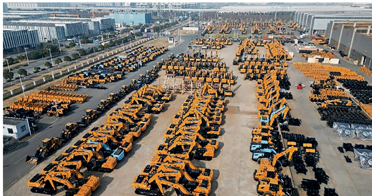
Экскаваторы, дорожные катки и другая инженерная техника в индустриальном парке ведущего китайского производителя тяжелой техники SANY в новом районе Линьган (Восточный Китай) готовится к отправке за границу.

«За последние годы мы построили в городе Чанша (провинция Хунань, Центральный Китай) первую в отрасли базунтеллектуального производства экскаваторов по полному циклу. По сравнению с традиционными производственными линиями средняя производственная мощность на новой базе увеличилась почти на 70%, а производственный цикл сократился на 65%. Крупные и средние экскава-