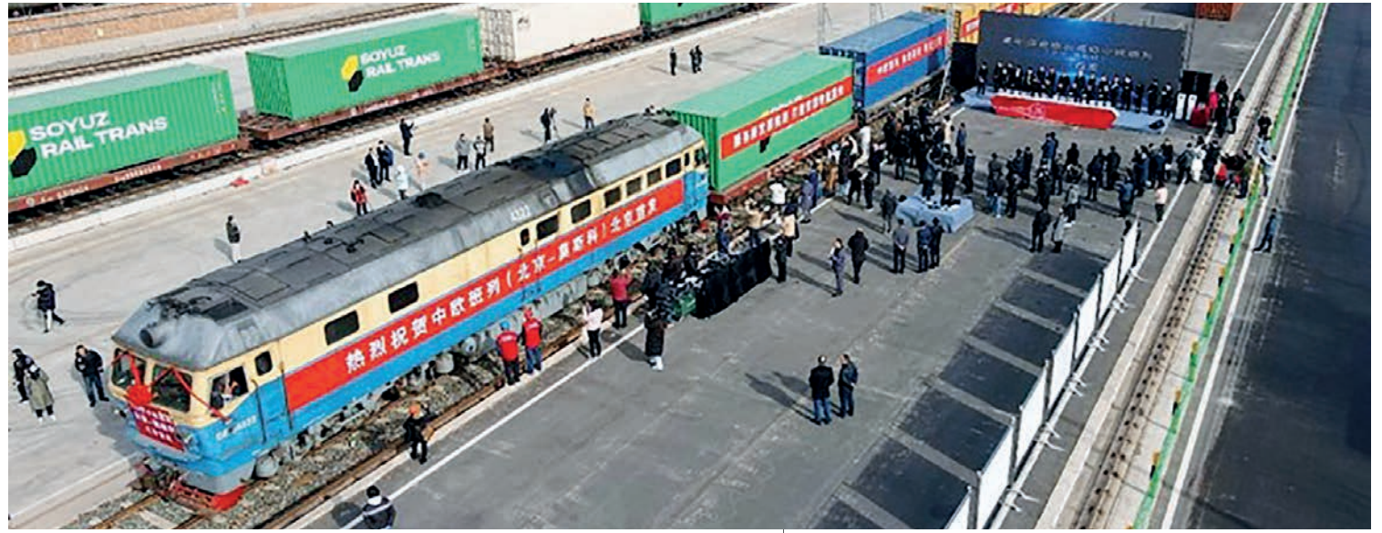
Из логистического хаба района Пингу города Пекин выехал первый для столицы Китая прямой грузовой поезд в рамках международных ж/д грузоперевозок Китай – Европа.

Чтобы удовлетворить спрос на услуги грузовых перевозок поездами Китай-Европа, пекинское подразделение корпорации «Китайские железные дороги» открыло два новых грузовых