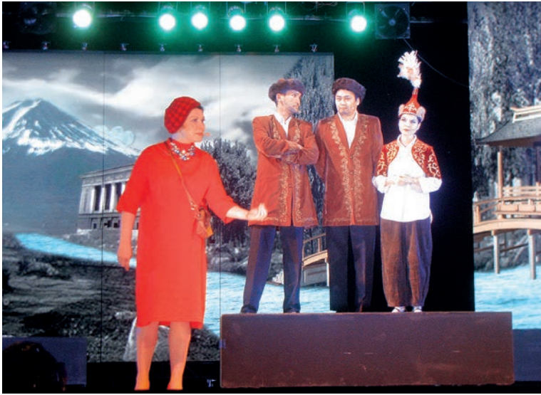
Сцена из спектакля «Сац. Хроника одной репетиции»

«Репетируя третий месяц спектакль «Сац», четко сформулировала свое желание выразиться не о режиссере, а о Театре и об