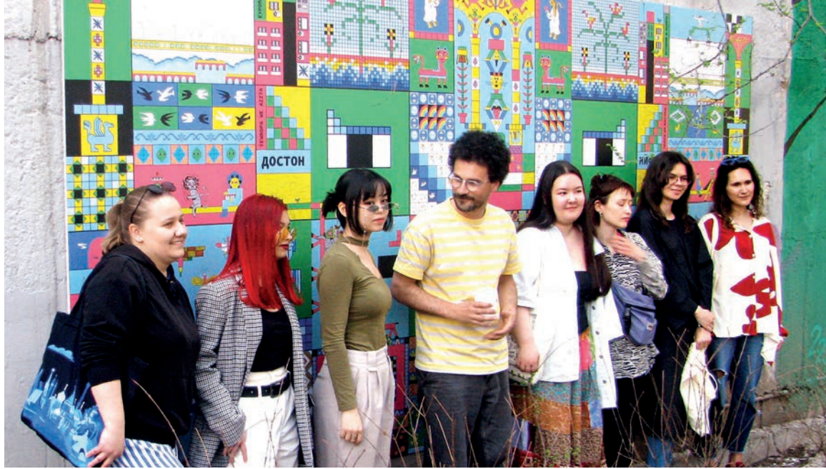
Художник Гийомит со своими соавторами на фоне фрески Mindsco

В Казахстане финишировал масштабный фестиваль французского языка и франкофонных культур «Франкофонная весна». Он завершился концертами французских музыкантов и презентацией интерактивной фрески Mindsco. Фестиваль, продолжавшийся с 1 марта по 21 апреля, организован посольствами Армении, Бельгии, Канады, Марокко, Румынии, Туниса, Франции и Швейцарии в РК в сотрудничестве с Французскими альянсами и другими казахстанскими франкофонными организациями.