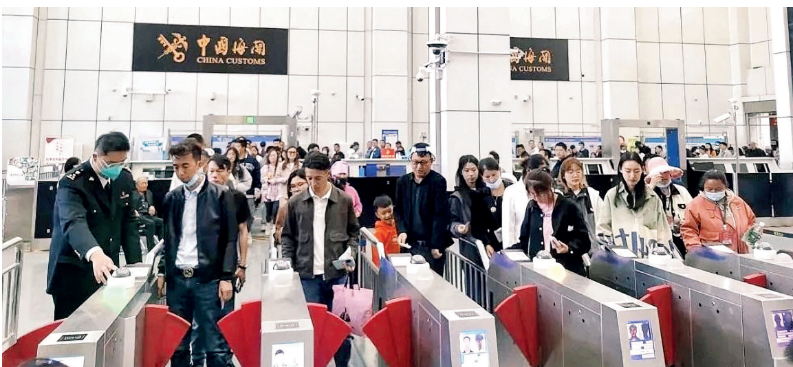
В первый день каникул по случаю 1 мая 2024 года у входа в МЦПС «Хоргос» выстроились длинные очереди туристов.

Как сообщила Цзо Сюэмэй, коэффициент загрузки «Одного пояса, одного пути» Университета Цинхуа Лу Ян считает, что успешная работа Китайско-казахстанской базы логистического сотрудничества в Ляньюньгане не только способствует взаимовыгодному сотрудничеству между двумя странами, но и служит образцом для взаимодействия Китая с другими странами и регионами, участвующими в инициативе «Один пояс, один путь».