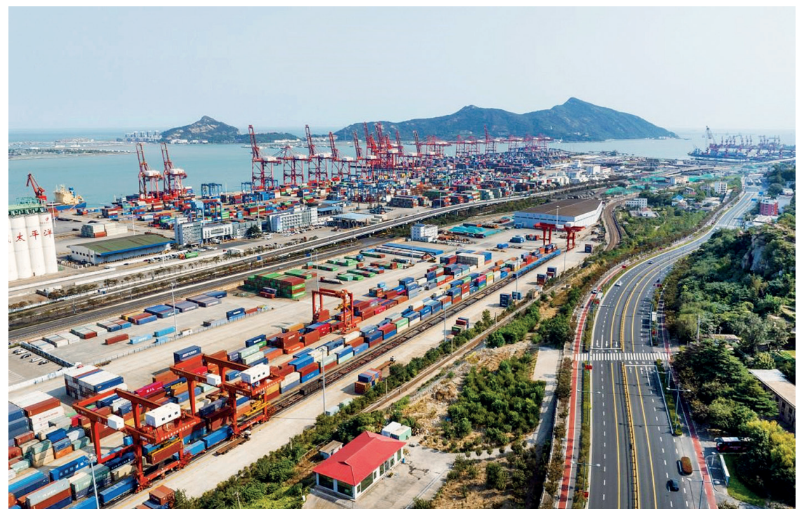
Китайско-казахстанская база логистического сотрудничества в Ляньюньгане (провинция Цзянсу, Восточный Китай)