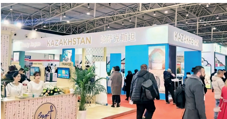
На фотографии, сделанной в ноябре 2023 года, запечатлен казахстанский павильон на Китайской международной выставке выездного туризма 2023 года в Пекине.

С начала этого года наблюдается устойчивый рост числа китайских туристов, посещающих Казахстан. Страна стала новым популярным направлением выездного туризма для китайцев. Согласно данным