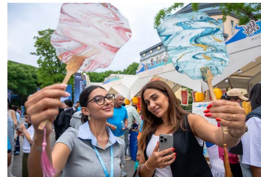
27.04.2025. В городе Уху (провинция Аньхой, Восточный Китай) в тематическом парке «Дунфан шаньхуа», входящем в сеть парков развлечений Fantawild, зарубежные гости демонстрируют собственноручно изготовленные лаковые веера.

Ассортимент товаров, привлекающих иностранных туристов, становится все более разнообразным: от традиционных китайских товаров, таких как чай, шелк и одежда, до современных электронных устройств – умных часов, фотоаппаратов и смартфонов. Это способствует выходу все большего числа модных китайских товаров на международный рынок.