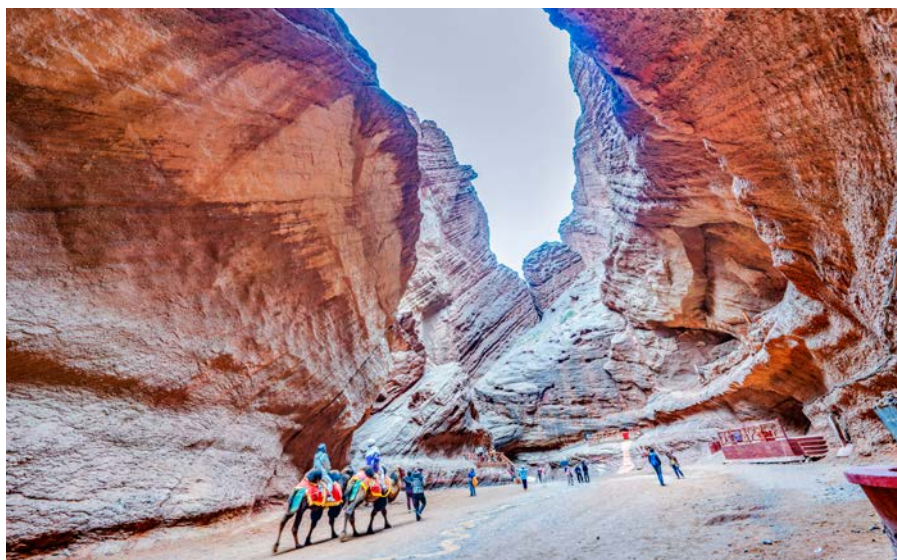
В Национальном геологическом парке «Большой каньон» в городе Куча туристы любят смотреть на ледниковые реликты, рельефом яданы и другими природными достопримечательностями.

Уроженец Кучи Маймайты Имити рассказывает: «Теперь дома отремонтированы,