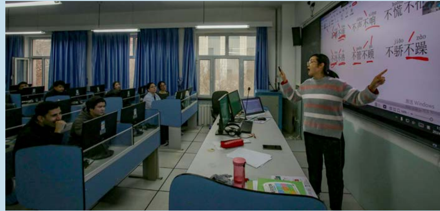
04.12.2024. Иностранцы студенты Института международного образования Синьцзянского сельскохозяйственного университета посещают занятия по китайскому языку.