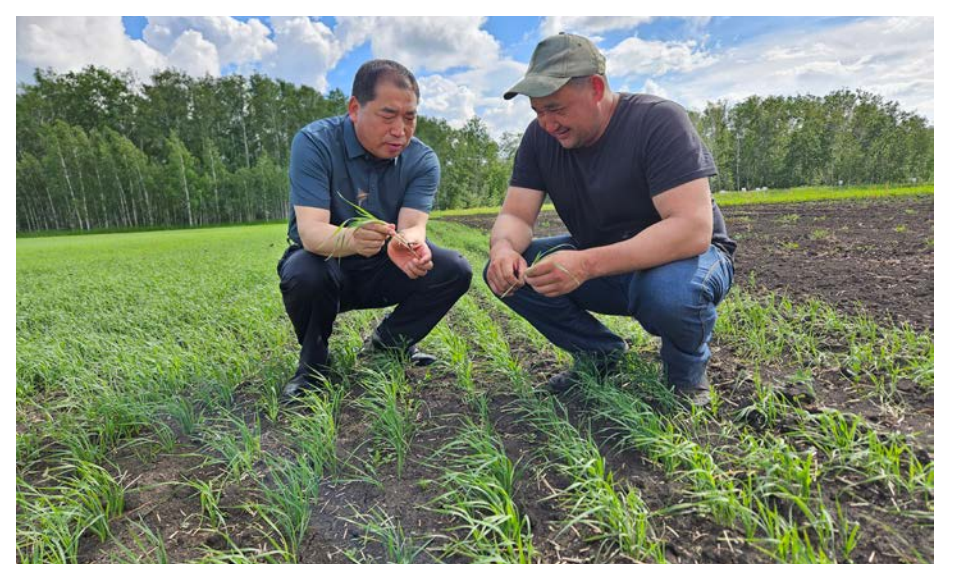
На экспериментальном пшеничном поле в Казахстане китайский селекционер пшеницы из Северо-Западного университета сельского и лесного хозяйства (слева) объясняет местному агротехнику особенности ухода за всходами пшеницы.

Например, пригласив профессиональную команду для тщательной проработки и управления проектом, Куча с помощью деликатной реконструкции создал 1,2-километровый переулочек Цюцзи. При этом удалось сохранить аутентичный облик древнего города и органично вписать в его пространство элементы культуры Цюцзи, что привлекло множество туристов. Сосредоточив внимание на двух ключевых направлениях – природном наследии Томура (часть объекта ЮНЕСКО «Тянь-Шань – Синьцзян») и культурном наследии Цюцзи, Куча создает культурно-туристический район Шелкового пути, сочетающий богатое историко-культурное содержание и живописные природные пейзажи.