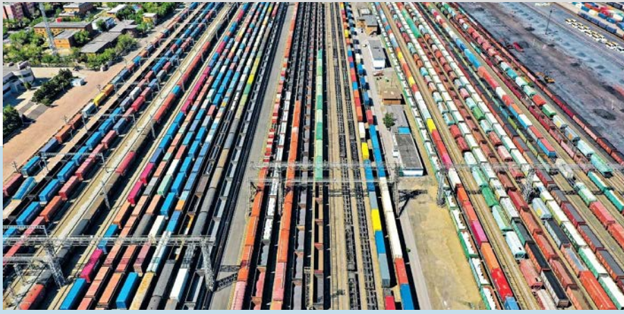
На железнодорожной станции Алашанькоу в Синьцзяне стоят готовые к отправке поезда Китай – Европа, а также другие грузовые составы, ожидающие пересечения границы.

Корреспонденты газеты «Жэньминь жибао» Ян Минфан, Ли Яньнань