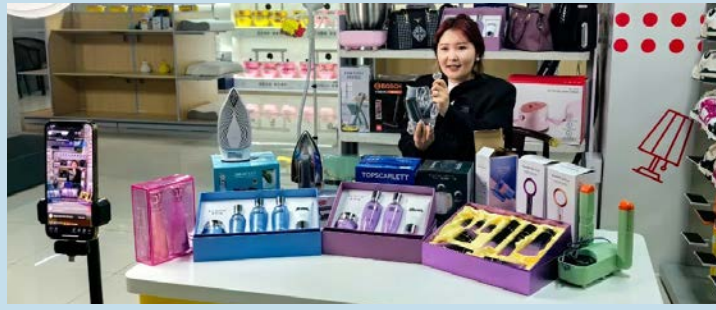
В студии прямых трансляций компании «Чжунда Шицзя», занимающейся трансграничной электронной торговлей в Синьцзян-Уйгурском автономном районе, ведущая рекламирует товары.

В студии прямых трансляций компании «Чжунда Шицзя», занимающейся трансграничной электронной торговлей в Синьцзян-Уйгурском автономном районе (Северо-Западный Китай), более 20 ведущих на казахском, русском, английском и других языках рекламируют зарубежным интернет-пользователям кухонную утварь, бытовую технику, косметику и прочую продукцию.