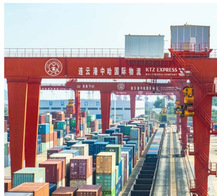
Китайско-казахстанская база логистического сотрудничества в Ляньюньгане (провинция Цзянсу, Восточный Китай).