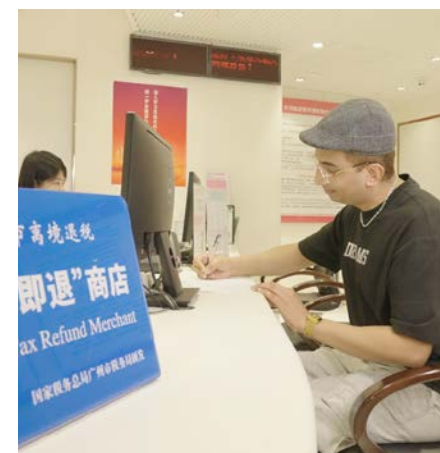
На днях в универсаме TEEMALL города Гуанчжоу (провинция Гуандун, Южный Китай) турист из Австралии получил налоговый возврат всего через пять минут после оплаты покупки.

Расположенный в торговом центре Wanxiang магазин компании Sunda, специализирующейся на продаже бытовой и цифровой техники, стал одним из первых в Шэньчжэне (провинция Гуандун), кто присоединился к программе возврата налога при выезде, и пользуется популярностью среди иностранных туристов. «За первые четыре месяца этого года объем операций по возврату налога в нашем магазине вырос на 500% по сравнению с аналогичным периодом прошлого года. Постоянное совершенствование поли-