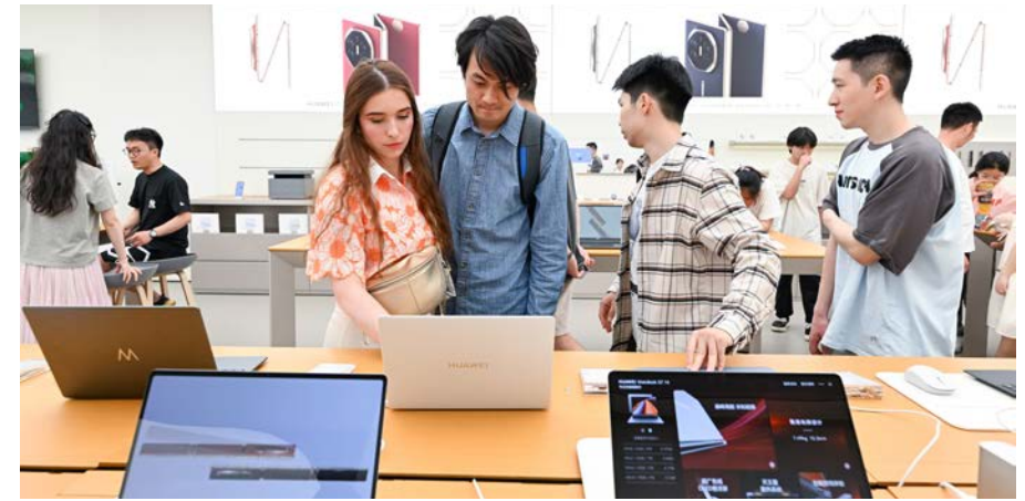
03.05.2025. В торговом центре The Ring в новом районе Лянцзян города Чунцин (Юго-Западный Китай) иностранные туристы знакомятся с последними моделями электронных устройств.