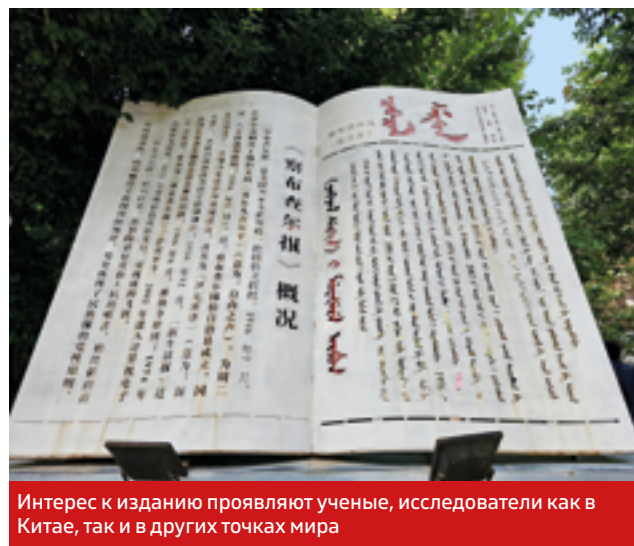
Интерес к изданию проявляют ученые, исследователи как в Китае, так и в других точках мира

Редакция газеты, которую еще называют «Народное сибо», давно стала не только хранителем сибинского диалекта, письменности сибо, но и культурно-историческим центром народа, который влился в многонациональный Китай и успешно развивается. Так, согласно данным Википедии, здесь в 1953 году проживало всего 19,02