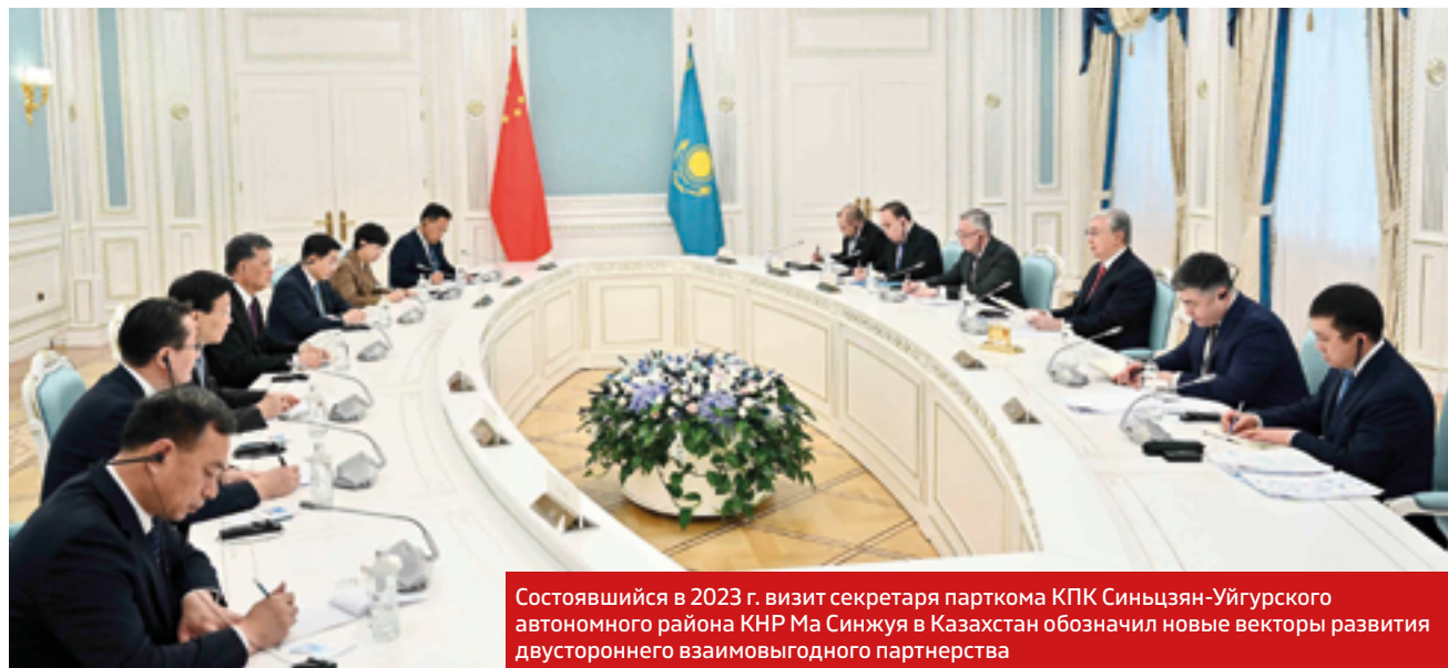
Состоявшийся в 2023 г. визит секретаря парткома КПК Синьцзян-Уйгурского автономного района КНР Ма Синжуня в Казахстан обозначил новые векторы развития двустороннего взаимовыгодного партнерства

в реализацию «китайской мечты о великом возрождении китайской нации» и где обеспечиваются базовые права человека на достойную жизнь и доступ к основным благам современной цивилизации.