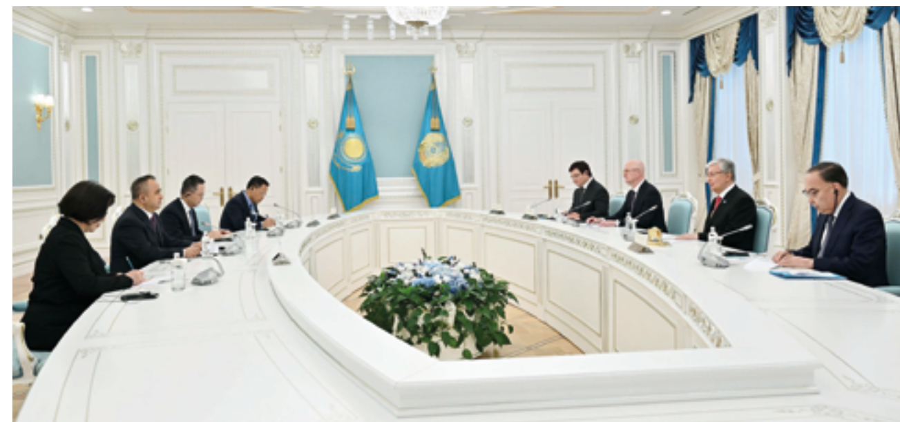
Визит заместителя секретаря парткома КПК Синьцзян-Уйгурского автономного района КНР, председателя Народного правительства СУАР Эркина Тунияза в Казахстан направлен на дальнейшее укрепление взаимовыгодного сотрудничества между нашими странами

Третье. Тесная взаимосвязанность. СУАР и Казахстан имеют семь круглогодичных пограничных пунктов пропуска, пять трансграничных нефтегазопроводов и две железнодорожные линии. По состоянию на август 2024 года через железнодорожные пограничные переходы Хоргос и Алашанькоу прошло более 10 тысяч грузовых поездов в рамках маршрута «Китай-Европа» (Центральная Азия), что на 9% больше по сравнению с прошлым годом. На территории Казахстана ведется активное