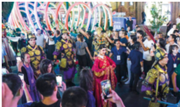
Традиционно культурные мероприятия в Китае проходят ярко и красочно

дарств двух стран объявили, что Год туризма в Китае будет проведен в Казахстане в 2025 году, что ознаменует собой шаг вперед в китайско-казахстанском партнерстве в туристической сфере. Таким образом был открыт новый этап двустороннего и беспроигрышного сотрудничества в области туризма между Китаем и Казахстаном.