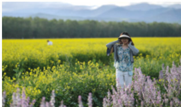
В следующем году в Казахстане готовится к старту Год туризма в Китае