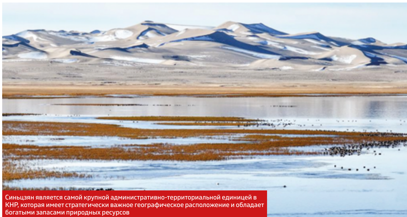
Синьцзян является самой крупной административно-территориальной единицей в КНР, которая имеет стратегически важное географическое расположение и обладает богатыми запасами природных ресурсов

Синьцзян-Уйгурский автономный район (СУАР) имеет исключительное значение для развития и углубления сотрудничества Китая с новыми независимыми государствами Центральной Азии – Казахстаном, Кыргызстаном, Таджикистаном, Туркменистаном и Узбекистаном. И это вовсе не случайно, поскольку исторически Синьцзян являлся частью единой цивилизационной целостности, связывая Центральную Азию с Великой Китайской равниной, колыбелью китайской цивилизации.