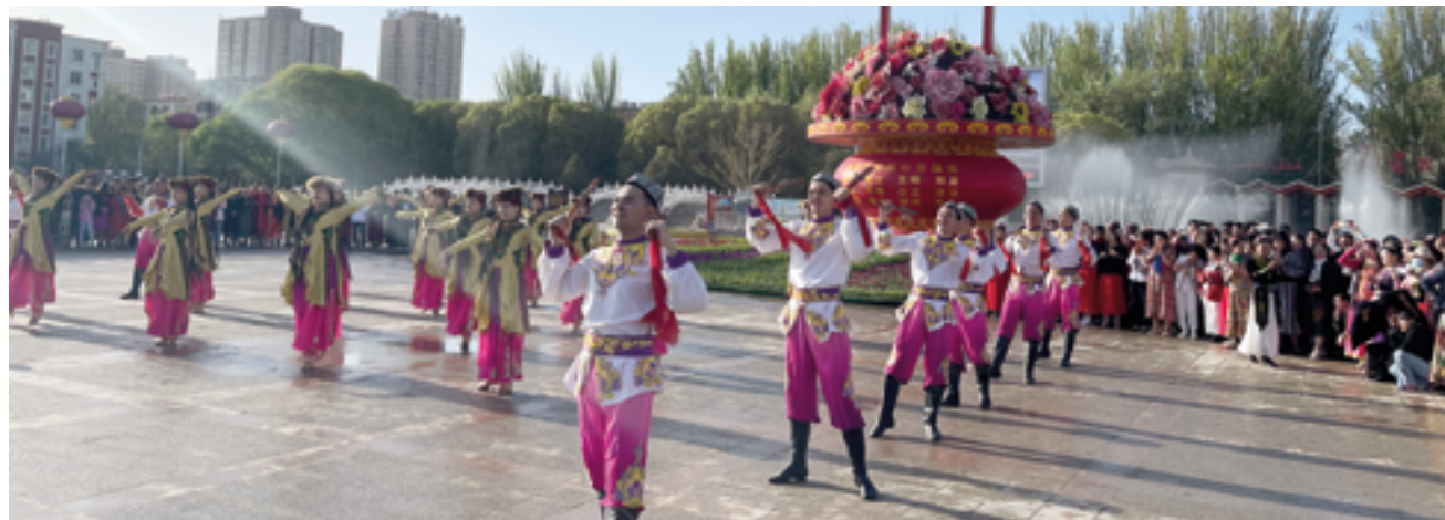
Кашгар притягивает своей особой атмосферой, сочетающей в себе историческое наследие и современную динамику

Кашгар – окутанный мифами и легендами древний город на краю китайской провинции Синьцзян, с давних времен служил важным торговым узлом на Шелковом пути. Этот город, где пересекаются культуры Востока и Запада, продолжает притягивать путешественников своей особой атмосферой, которая сочетает в себе историческое наследие и современную динамику. Группа журналистов, в состав которой входил автор этой статьи, отправилась в Кашгар с целью исследовать, как живет и дышит город, его культурные особенности и историческое значение.