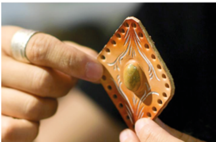
Казахстан с Синьцзяном объединяют схожие культурные ценности