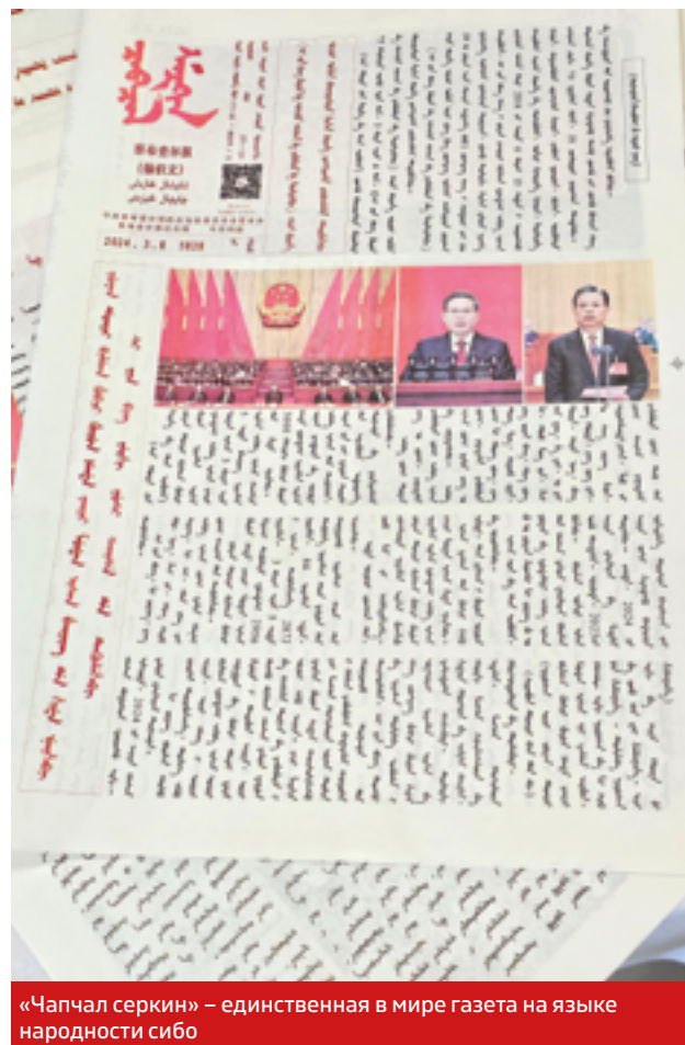
«Чапчал серкин» – единственная в мире газета на языке народности сибо

Одна из 56 официально насчитывающихся национальностей Китая – народность сибо – компактно проживает в Чапчал-Сибоском автономном уезде, входящем в состав Или-Казахского автономного округа, СУАР. Уезд Чапчал расположен на южном берегу реки Или к югу от Кульджи, на границе с нашей Алматинской областью. Здесь сибо сохранили и уклад, и письменность, и традиции, и национальную идентичность. Чему во многом способствует редакция газеты «Чапчал серкин» («Чапчалские новости»).