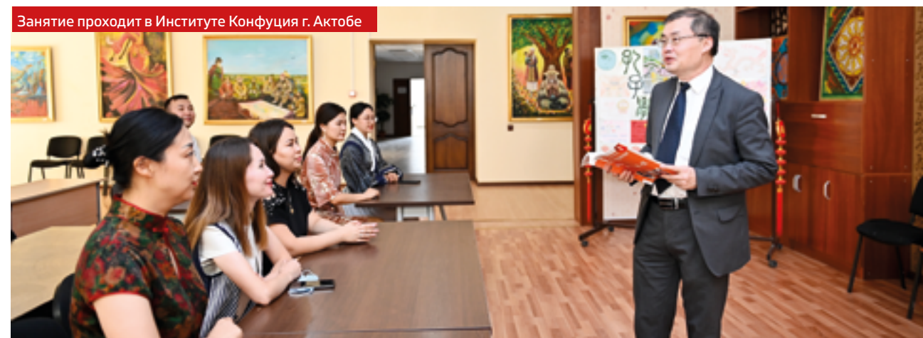
Занятие проходит в Институте Конфуция г. Актобе

Пятое. Выход общественных обменов на новый уровень. С ноября 2023 года действует соглашение о взаимном освобождении от визовых требований между Китаем и Казахстаном. В нынешнем и следующем году сторонами организованы «Год туризма Казахстана в Китае» и «Год туризма Китая в Казахстане», что, бесспорно, подогрело интерес к двустороннему туризму, способствуя взаимопониманию между народами двух стран и укрепляя социальную