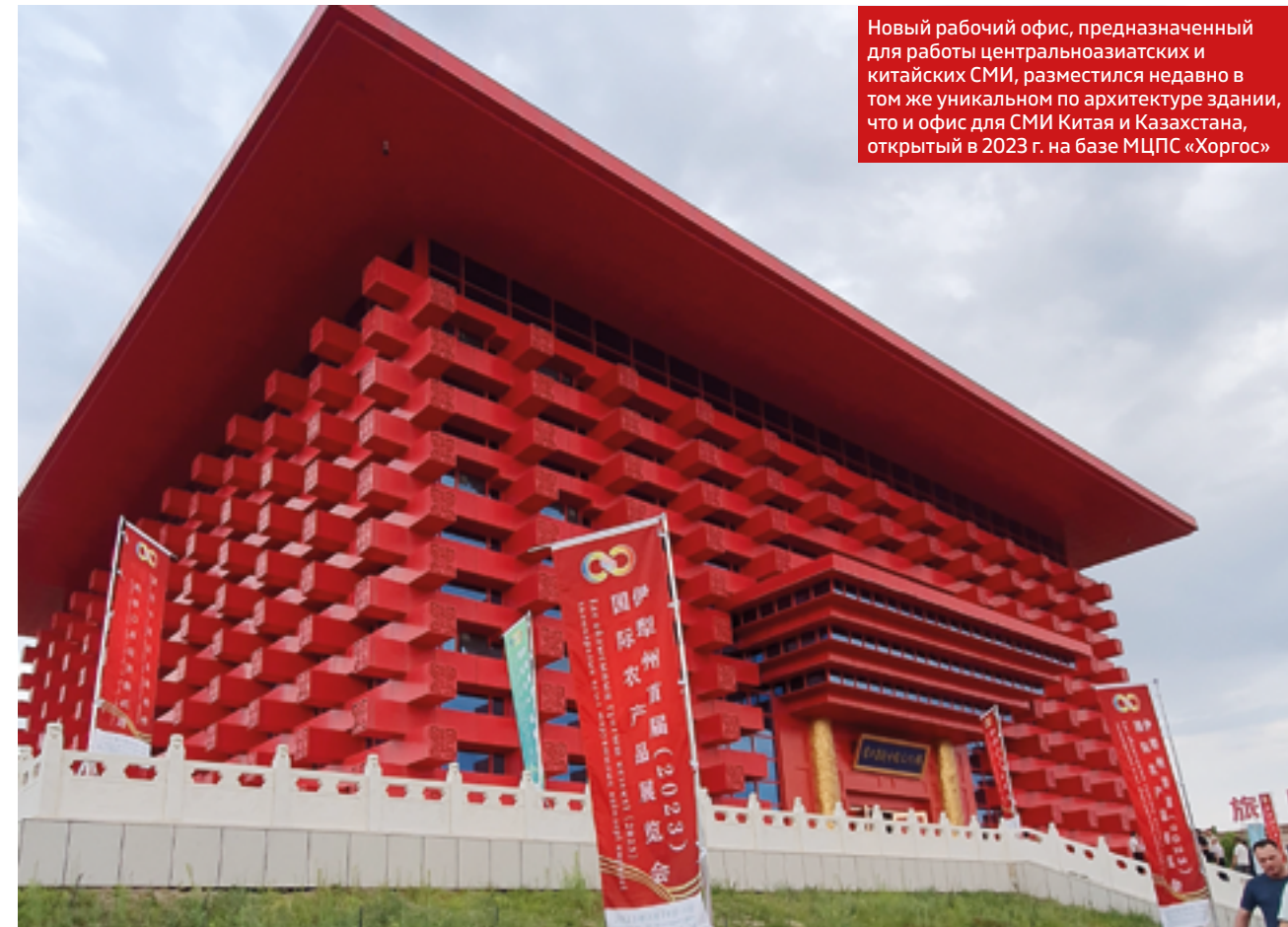
Новый рабочий офис, предназначенный для работы центральноазиатских и китайских СМИ, разместился недавно в том же уникальном по архитектуре здании, что и офис для СМИ Китая и Казахстана, открытый в 2023 г. на базе МЦПС «Хоргос»

В перспективе, благодаря реализации стратегии возрождения Великого Шелкового пути и развитию северо-западных районов Китая, Синьцзян превратится в крупный транспортный и энергетический узел, экономически развитый внешнеориенти-