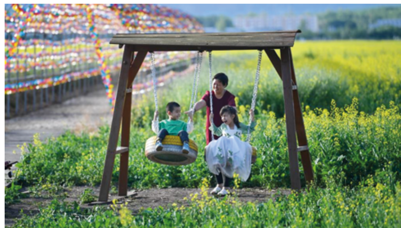
Синьцзян – ключевая точка на маршрутах «Пояса и пути»

Синьцзян, будучи важными воротами для открытия Китая на Запад и центральной точкой «Пояса и пути», в полной мере задействует свои уникальные преимущества, ведь он не только связан с Казахстаном горами и реками, но и имеет схожий культурный фундамент.