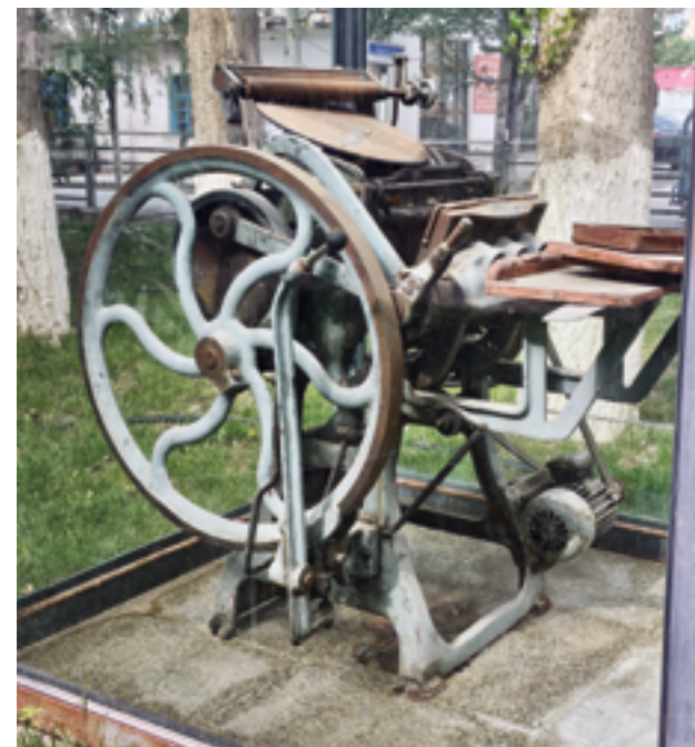
По соседству с редакцией расположен музей, где посетители смогут ознакомиться, в том числе, с атрибутикой типографского дела середины прошлого века

Прежде чем попасть в здание редакции, гостей обязательно проведут через музей под открытым небом, где бережно, в стеклянных кубах, хранятся и первые станки, в том числе линотипные, и первые номера газеты, и уже многими нашими коллегами подзабытая атрибутика типографского дела середины 20-го века. Точнее было бы сказать, неизвестная молодым журналистам