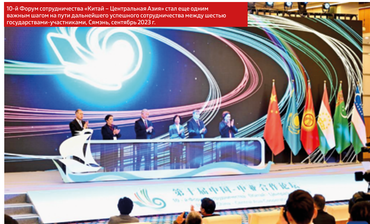
10-й Форум сотрудничества «Китай – Центральная Азия» стал еще одним важным шагом на пути дальнейшего успешного сотрудничества между шестью государствами-участниками, Сямэнь, сентябрь 2023 г.

Говоря о Синьцзяне, следует также отметить высокие показатели социально-экономического роста и внутривнутриполитическую стабильность региона. Благодаря политике ЦК КПК в борьбе с бедностью эта проблема в регионе практически решена и, как следствие, растет благосостояние граждан, создается социально-экономическая инфраструктура, вследствие чего развивается индустрия туризма, что ведет к появлению новых рабочих мест и, в конечном итоге, к росту материального достатка населения.