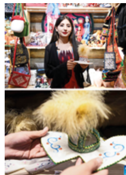
Изделия ручной работы синьцзянских мастеров пользуются любовью как у казахстанских, так и зарубежных туристов

В июле этого года по приглашению Президента РК Касым-Жомарта Токаева Председатель КНР Си Цзиньпин совершил государственный визит в Казахстан и принял участие в саммите Шанхайской организации сотрудничества в Астане. Лидеры двух стран предприняли новые шаги в планировании всестороннего сотрудничества, что придало мощный импульс высококачественному развитию китайско-казахстанских отношений. Генеральное консульство готово совместно с казахстанской стороной в полной мере реализовать ключевые договоренности между лидерами двух стран, усилить сопряжение стратегий развития Синьцзяна и Казахстана, делиться плодами реформ и развития СУАР, чтобы раскрыть «золотой потенциал» Синьцзяна в качестве «золотого коридора» между Азией и Европой. Все это, несомненно, позволит непрерывно повышать «золотую ценность» китайско-казахстанских отношений вечного всестороннего стратегического партнерства.