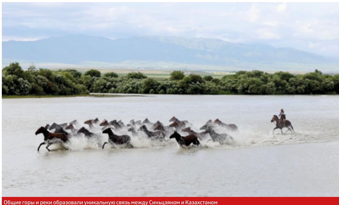
Общие горы и реки образовали уникальную связь между Синьцзяном и Казахстаном

Древний Шелковый путь, пересекавший Тянь-Шаньские горы и пустыни под стук лошадиных копыт и верблюжьих колокольчиков, положил начало тысячелетним дружеским узам между Китаем и Казахстаном, а в наши дни, в 2013 году, в Казахстане Председатель КНР Си Цзиньпин впервые выдвинул инициативу «Один пояс и один путь», которая оживила укоренившуюся дружбу между двумя странами в новую эпоху.