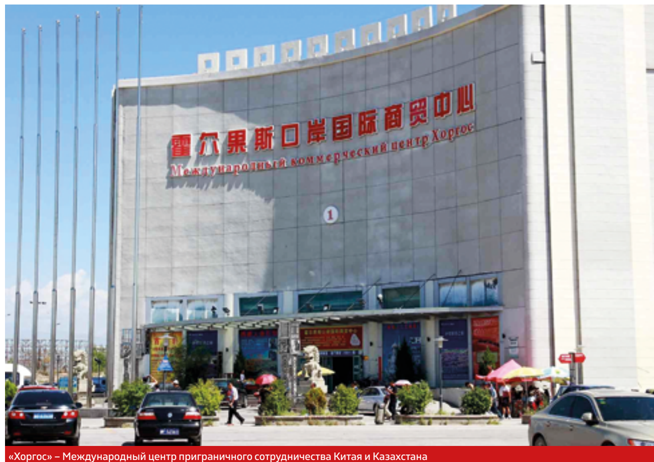
«Хоргос» – Международный центр приграничного сотрудничества Китая и Казахстана

активности. В июне этого года в г. Урумчи прошел Форум научно-технического сотрудничества «Китай (Синьцзян) – Центральная Азия», на котором Синьцзян и страны Центрально-Азиатского региона, включая Казахстан, достигли важного консенсуса по созданию взаимовыгодных научно-технических партнерских отношений. Кроме того, университеты двух государств активно практикуют обмен студентами, создают Институты Конфуция и Школу Шелкового пути, способствуя подготовке кадров по программе «Китайский язык плюс профессиональные навыки». Все эти меры отвечают современным потребностям социального развития Китая и Казахстана.