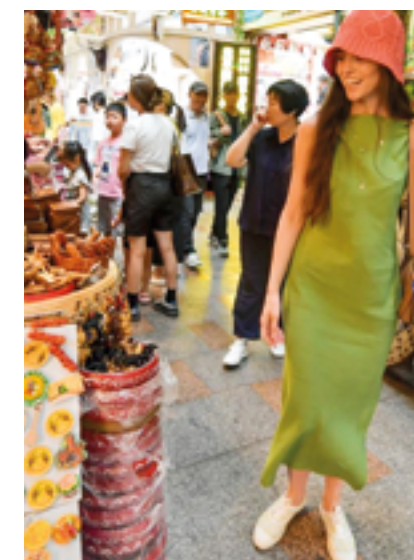
Синьцзян как туристическое направление в последние годы становится все более популярным у гостей со всего мира