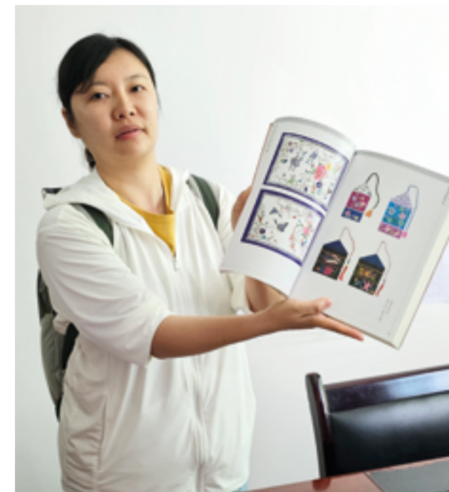
Газета издается в целях сохранения языка, письменности и культуры народа сибо

Понятно, что ее читают в основном местные жители, но интерес к ней проявляют ученые, исследо-