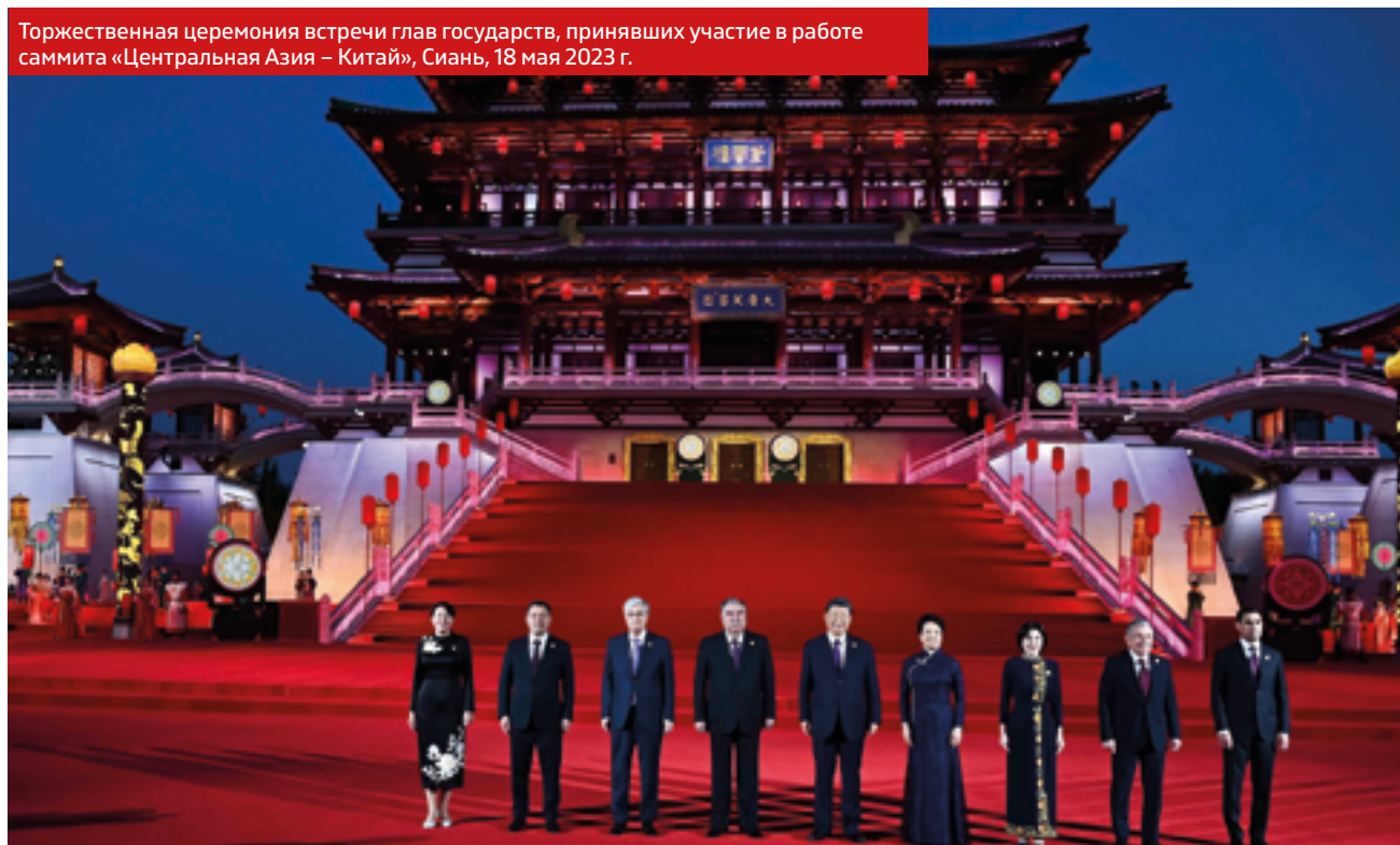
Торжественная церемония встречи глав государств, принявших участие в работе саммита «Центральная Азия – Китай», Сиань, 18 мая 2023 г.

ной стратегии, отвечающей его социальным, экономическим, политическим требованиям и особенностям. Так, в конце XX века начинается процесс интеграции Синьцзяна, встраивание его в единую экономическую и политическую систему Китая. Сегодня же, в начале третьего десятилетия XXI века, происходит постепенная реорганизация политики Синьцзяна от процессов внутреннего развития Китая на поддержание торгово-экономических отношений КНР с соседними странами.