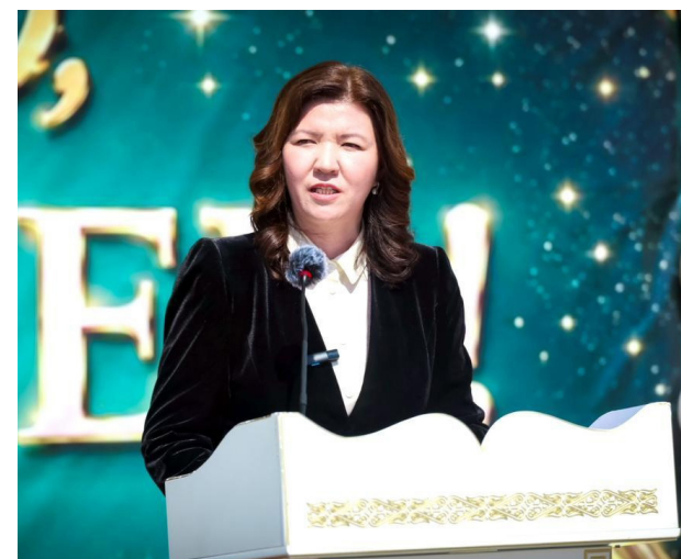
Министр просвещения РК Жулдыз СУЛЕЙМЕНОВА приняла участие в торжественной линейке по случаю окончания учебного года в селе Талапкер Акмолинской области

Форум «Посол своей земли» стал не только площадкой для обсуждения литературного и научного наследия Олжаса Сулейменова, но и пространством для осмысления идей, которые продолжают сохранять актуальность в современном мире. В выступлениях участников неоднократно звучала мысль о том, что его деятельность всегда была направлена на поиск взаимопонимания между культурами, укрепление международного диалога и формирование ответственности за общее будущее. Именно поэтому разговор о наследии Олжаса Сулейменова вышел далеко за рамки юбилейной даты, превратившись в обсуждение тех ценностей и ориентиров, которые остаются востребованными и актуальными во все времена.