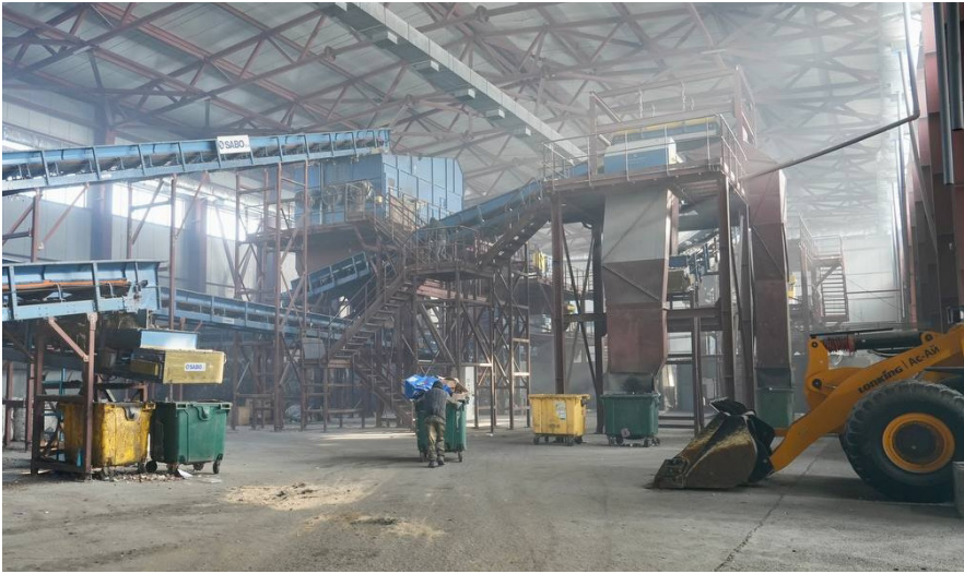
Ольга СИЗОВА, Усть-Каменогорск