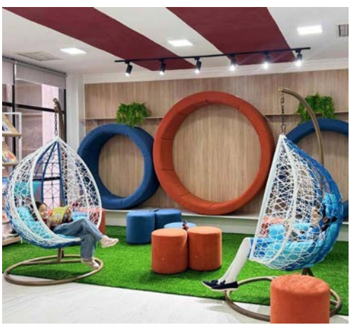
Наталья БУТЫРИНА, Актау

В Мангистауской области всего работает 70 библиотек. И сегодня библиотеки – это не просто хранилища книг, а живые пространства, которые меняют жизни людей и укрепляют социальные связи.